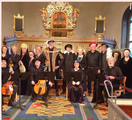
Kammarkören Mikaeli Sångare