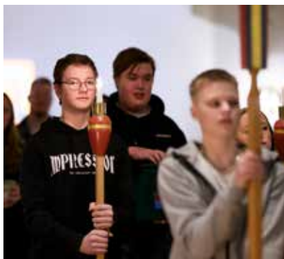
Ungdomar deltar i procession.

I april är det dags för vårens konfirmation. 16 ungdomar har deltagit i gruppen som träffats varannan onsdag. Konfirmandarbetslaget förbereder dessutom redan sommarens läger dit 40 ungdomar anmält sig. Runt om i landet samlar konfirmandverksamheten fler ungdomar igen efter många års nedåtgående trend. Undersökningar visar att ungdomarnas val att delta är mer medvetna och ett ökat intresse för kärnfrågorna – den kristna tron och vem Jesus är. Ett stort gäng unga ledare, själva konfirmander för några år sedan, planerar och genomför veckoträffar och läger tillsammans med präst och församlingspedagog. Då och då möts vi i gudstjänsten, där både unga ledare och konfirmander frimodigt och självklart deltar i olika uppgifter, roligt!