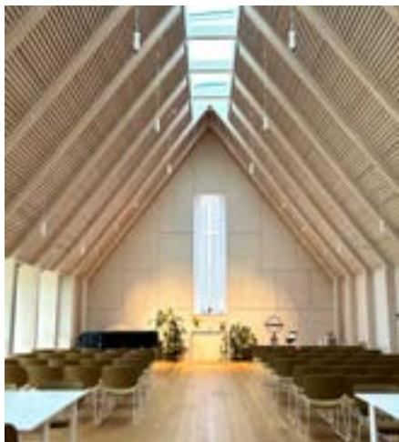
Kyrksalen i församlingsgården

Välkommen att inleda dagen med en enkel morgonmessa tisdagar 08.30 (jämna veckor i församlingsgården i Stångby, ojämma veckor i Norra Nöbbelövs kyrka)