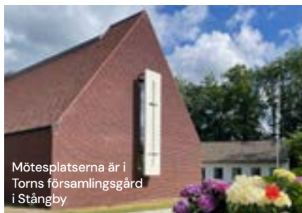
Mötesplatserna är i Torns församlingsgård i Stångby

Några gånger under våren firar vi Himlaskoj mässa i församlingsgården. En gudstjänst som riktar sig till både barn och vuxna. Barnkörerna står för musiken. Nyhet 2025: Efteråt blir det korv med bröd. Se kalendarium för datum.