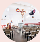
Två Systrars kapell www.svenskakyrkan.se/kalmar/tsk Lille Bullens väg 1

Men nu består tro, hopp och kärlek, dessa tre, och störst av dem är kärleken – 1 kor 13:13