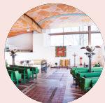
S:ta Birgitta kyrka www.birgittakyrkan.se Villagatan 2