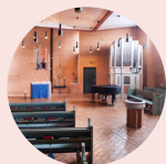
S:t Johannes kyrka www.kalmarstjohannes.se Hanellsgatan 5

För bokning av vigselgudstjänst i våra kyrkor, kontaktar ni någon av församlingens präster. På respektive hemsida hittar ni kontaktuppgifter.