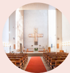
Heliga Korsets kyrka www.heligakorset.se Kungsgårdsvägen 2B