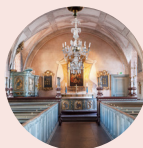
Kalmar slottskyrka www.svenskakyrkan.se/kalmar/kalmar-slottskyrka