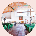
S:ta Birgitta kyrka www.birgittakyrkan.se Villagatan 2