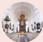
Kalmar domkyrka www.kalmardomkyrka.se Stortorget