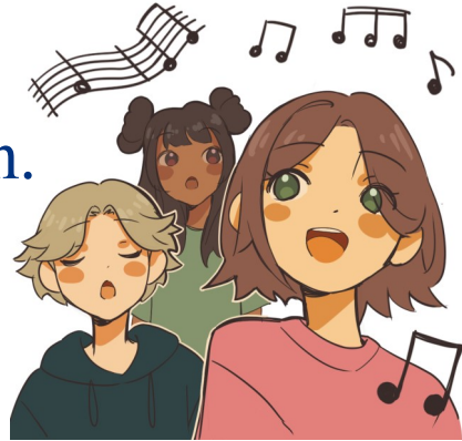
Illustration: Dorothea Malmros