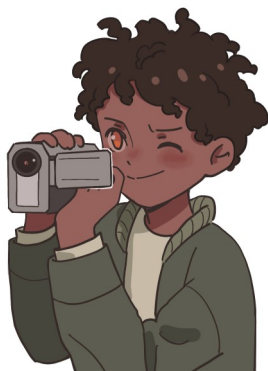
Illustration: Dorothea Malmros

Frågor och anmälan: anette.torgnysdotter@svenskakyrkan.se 072-508 58 66