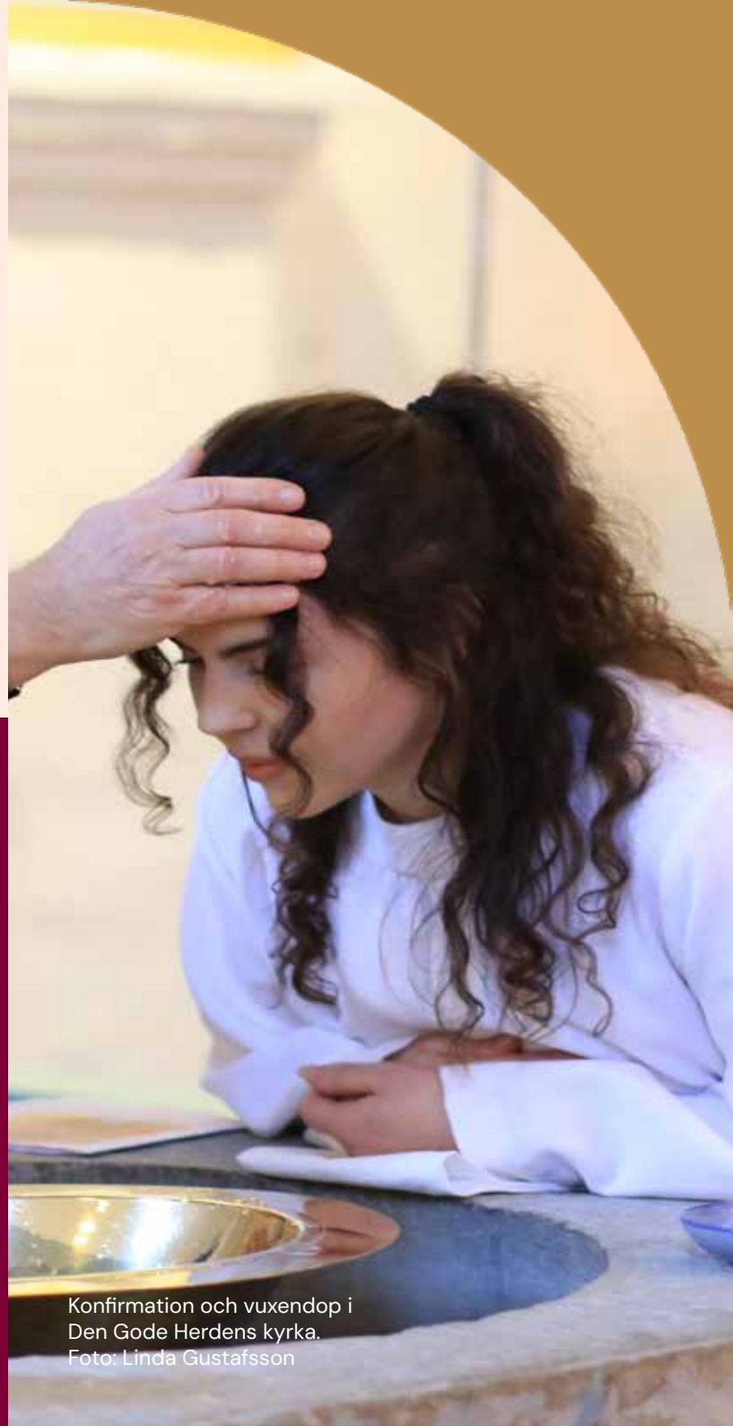
Konfirmation och vuxendop i Den Gode Herdens kyrka.