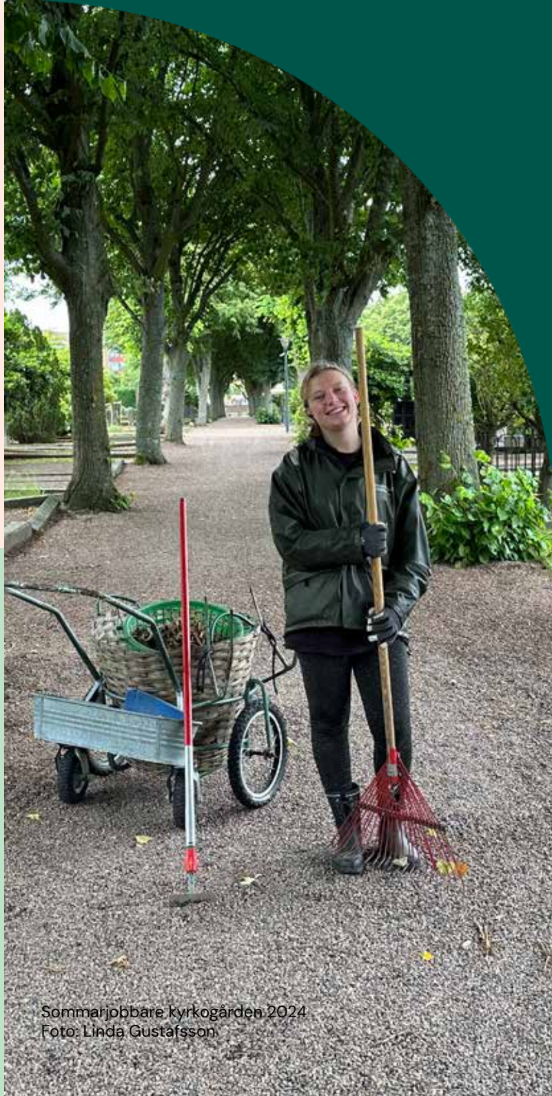
Sommarjobbare kyrkogården 2024