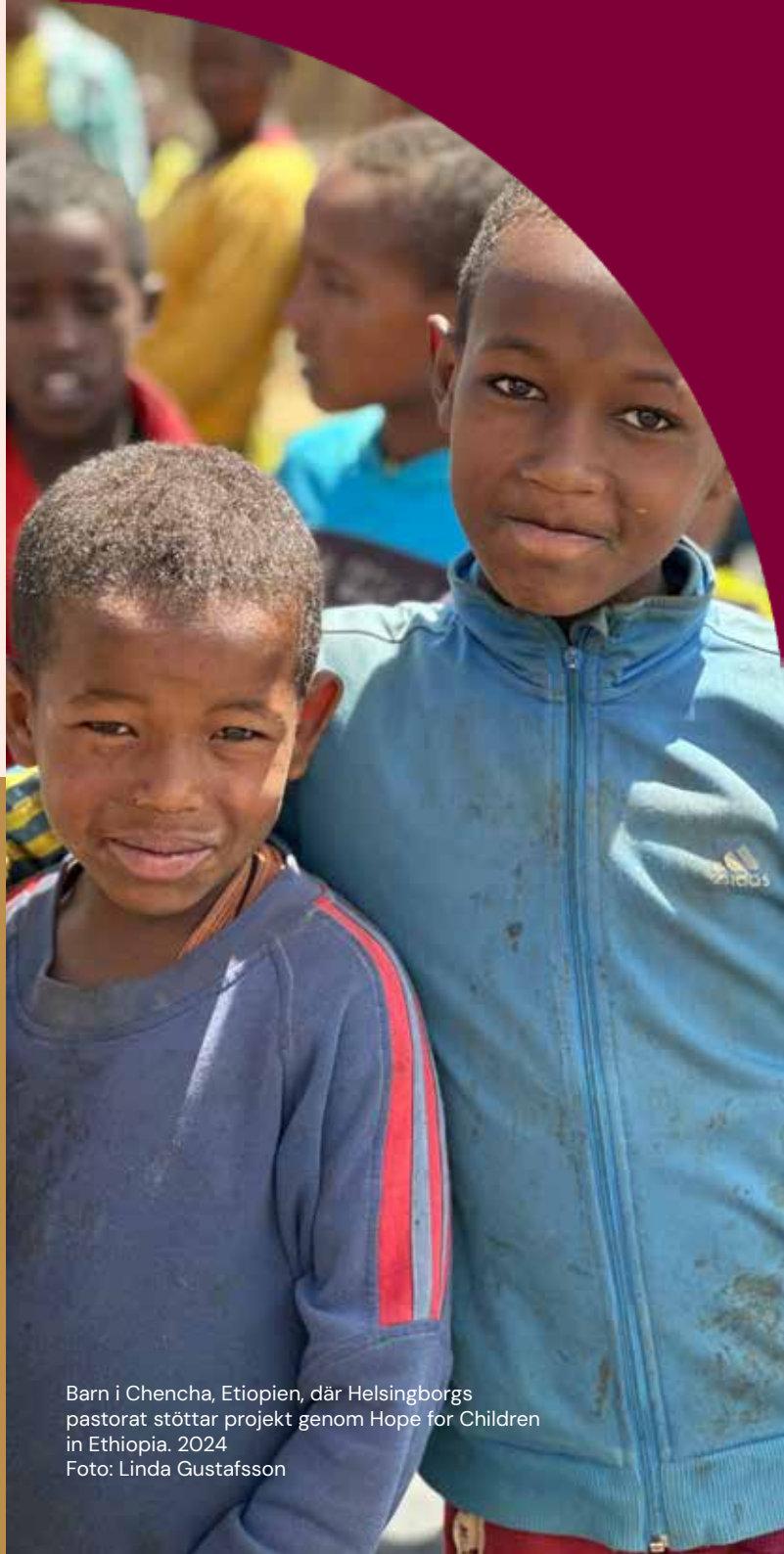
Barn i Chencha, Etiopien, där Helsingborgs pastorat stöttar projekt genom Hope for Children in Ethiopia. 2024