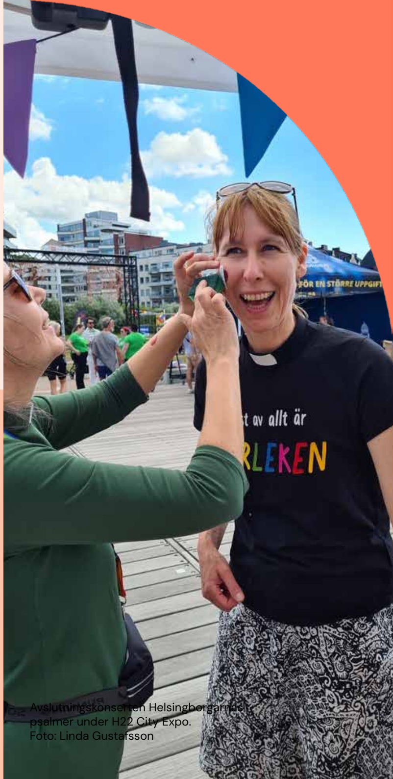
Avslutningskonserten Helsingborgarnas psalmer under H22 City Expo.