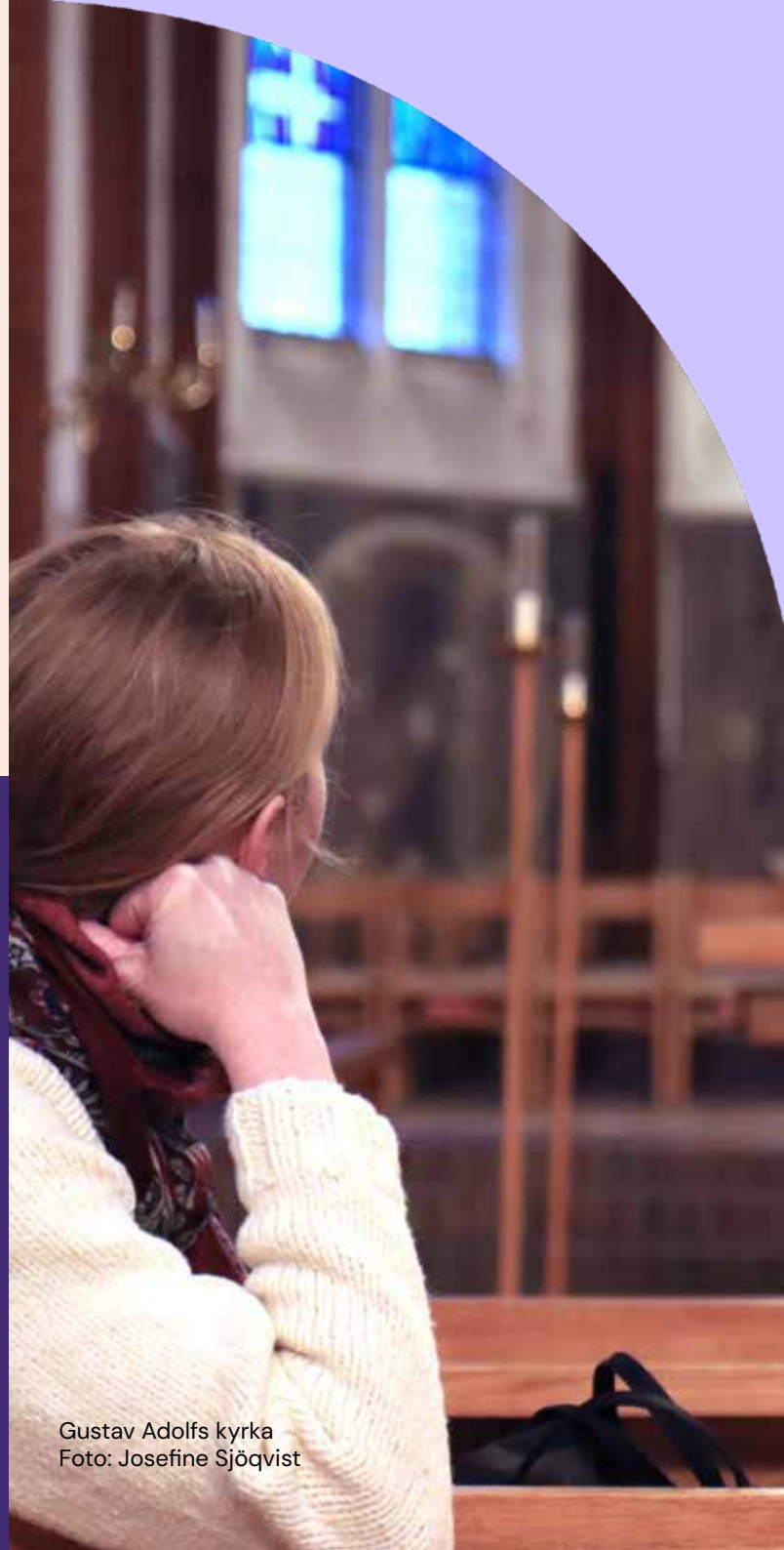
Gustav Adolfs kyrka