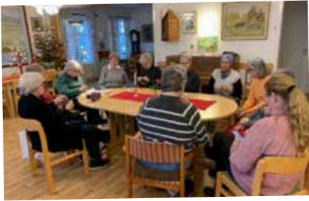
Breviks hantverkscafé har julavslutning.