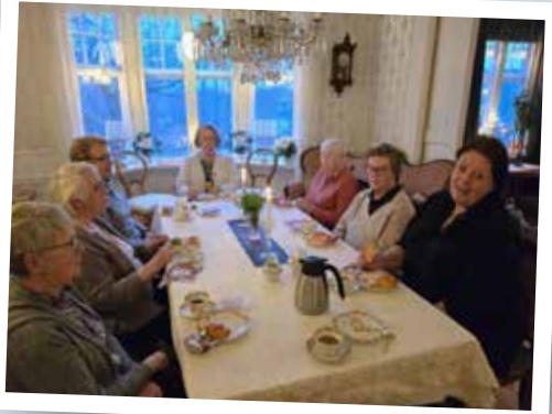
Gällsebo kyrkliga syförening har julavslutning på Ebbanäs gård.