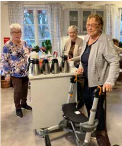
Damerna i köket ordnar med fika till syauctionen i Undenäs prästgård.