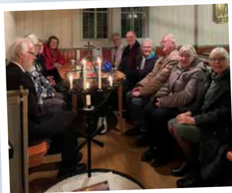
Första advent i Bocksjö kapell med kyrkkaffe efteråt.