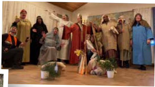
Julvandring för skolklasserna innan jul i Mölltorp, Forsvik och Karlsborg.