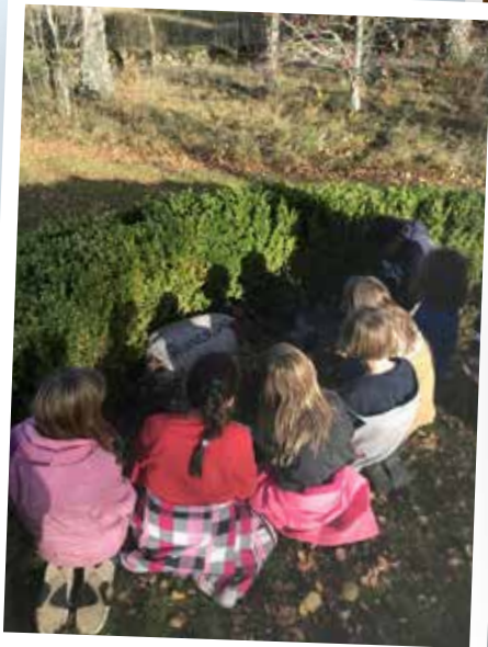
Barnen besöker kyrkogården inför Allhelgonahelgen.