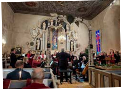
Julkonsert i Mölltorps kyrka med Brevik/ Mölltorp och Karlsborgs kyrkokörer, samt musiker och solister.