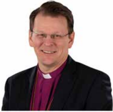
Biskop Erik Eckerdal.

I Jesu berömda Bergspredikan (Matt 5–7) säger Jesu att vi kristna är och har uppdraget att vara jordens salt (Matt 5:13). Det är en tydlig bild av att vi kristna behöver leva och arbeta så att hela samhället blir mer välsmakande. Eller med andra ord, blir ett bättre,