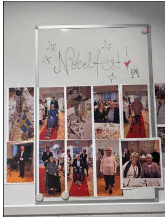
Fotokollage från "Nobelfesten".

- Jag hade bibelsamtal hemma hos mig i många år. Det har jag fortsatt med här på Gotlands sjukhem. Det är både de som bor här och gamla vänner som kommer hit och deltar. Nu har vi också något vi kallar önskep-