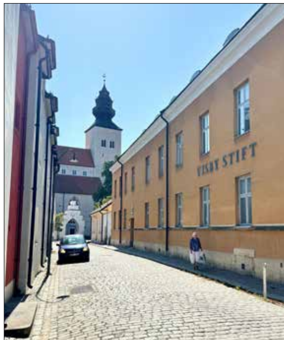
Visby stiftskansli, Norra Kyrkogatan.

- Vi rekryterar nu också en kommunikationschef för att ytterligare ta ett par steg framåt, synas mer och utveckla hur vi kommunicerar.