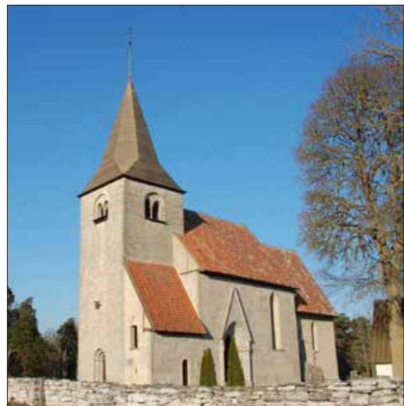
Bro kyrka. Här testas man elektromiskt lås.