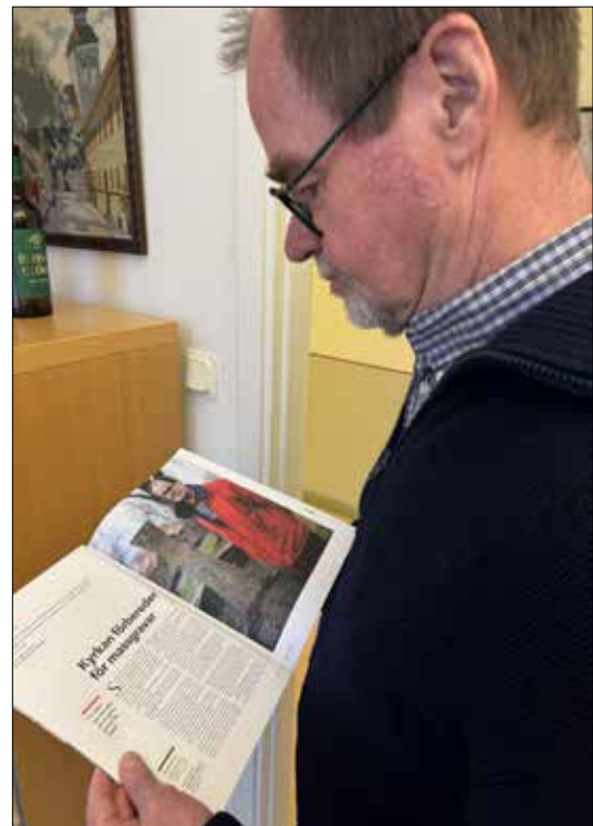
Tidningen Folket i Bild gjorde i höstas ett stort reportage om Visby stift och beredskapsplaneringen.

- Begravningsituationer som uppstår i fredstid klarar kyrkan på Gotland. Likaså en