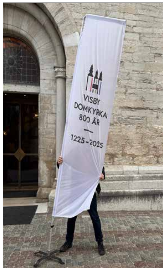
Ole kämpar i vinden som den seglare han är!

Jag säger bara. Gå in på Visby domkyrkas hemsida och titta i kalendariet, det här är bara ett litet urval! Då får ni också del av kyrkans intressanta historia.