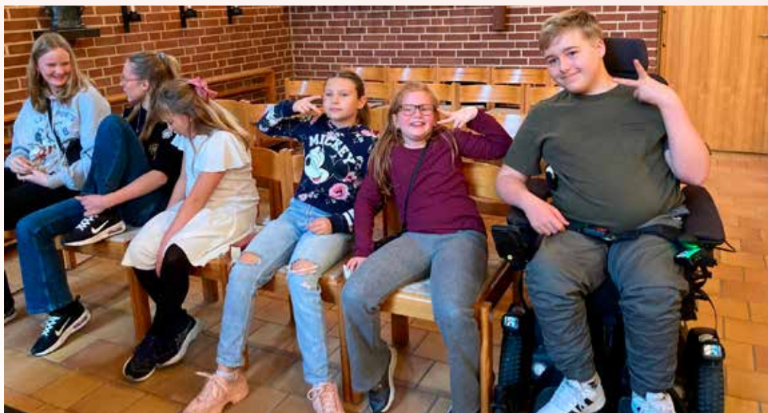
Ungdomskören Grafitti på kördag i Lerberget. Kanske det blir någon sång därifrån på Allsångskväll i Hörby församlingshem 23 april!