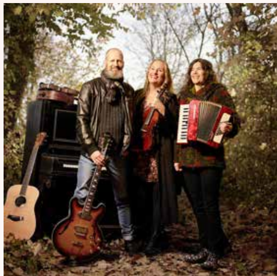
Trenne spelar i Östraby kyrka 30 mars.