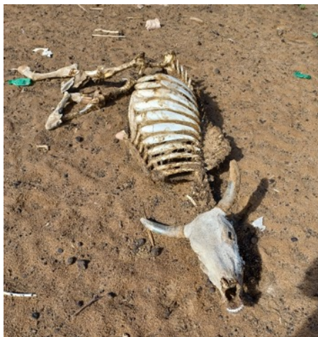
Många kor i Civicon dog under torkan 2021-2023

Åren 2021 och 2022, fram till oktober 2023 var en svår tid för hela norra Kenya, helt utan regn, den värsta torkan på 40 år. En stor del av husdjuren i Civicon dog av svält och även människorna blev hårt drabbade. Två Systrars församling skänkte nödmat vid flera tillfällen, vilket hjälpte tillfälligt. I oktober och november 2023 kom slutligen regnet och då med en sådan kraft och med häftiga skyfall att vägar spolades bort och flera manyatas fick flyttas till torrare mark. Men efteråt grönskade marken.