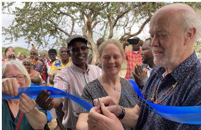
Tal och bandklippning vid invigningen av det nya klassrummet

Två personer från Two Sisters School kom till Kalmar och Två Systrars Kapell i september 2022. De kenyanska pedagogerna hade ett intensivt program i Kalmar med Kenyaväll, gudstjänster och besök på en lång rad institutioner och skolor. De ömsesidiga besöken gav en bra grund för långsiktiga relationer och erfarenhetsutbyte i båda riktningar, kan man läsa i utvärderingen.