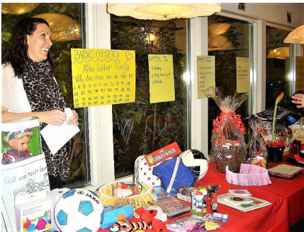
Adventsmarknad i Två systrars Kapell