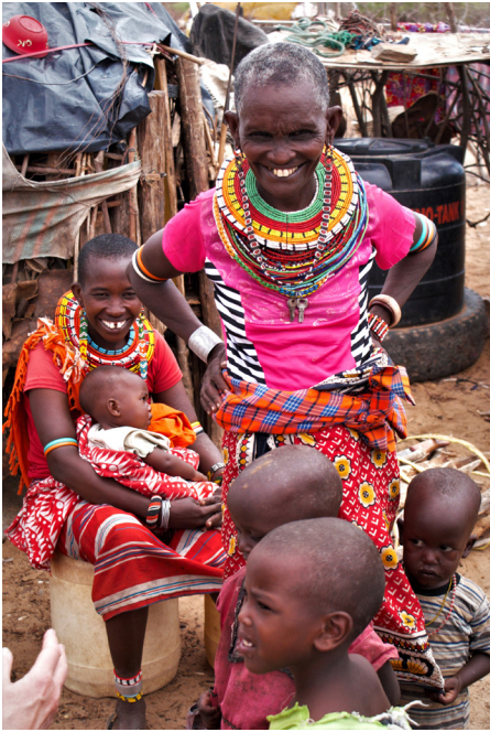
En stolt mormor i Civicon visar upp sin dotter och barnbarn