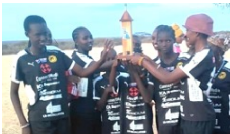
Damlaget från Civicon höjer pokalen efter sin seger i Two Sisters Cup 2022

Two Sisters Cup är en årlig fotbollscup för både herrlag och damlag som påbörjades i Civicon i december 2022. Första året deltog fem lag från regionen, andra året sex lag med drygt 100 spelare totalt. Vandringspokalen har tillverkats av en lokal konstnär i Kalmar. Stöd har kommit från så-