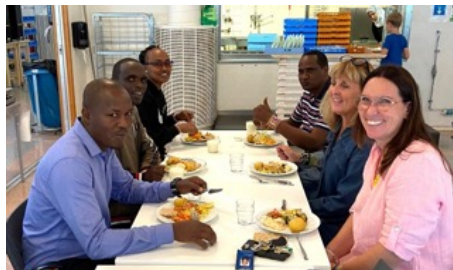
Lunch på Kalmarsundsskolan