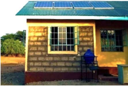
Solpanelerna ger för första gången lite elektricitet till skolan.