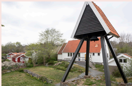
Brännö klockstapel.

Oavsett vilken ö man har bott på läser vi upp alla tacksägelser på alla de platser vi firar gudstjänst på den söndagen. Då vi inte firar gudstjänst varje söndag på varje ö så kan tacksägelsen komma efter att begravningsgudstjänsten har ägt rum.