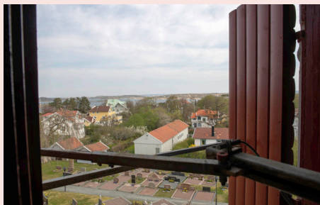
Utsikt från Styrso kyrkas klocktorn.

Helgmålsringning: Vanligt inom vissa delar av kristenheten, i Styrso församling har en del av öarna fortfarande kvar helgmålsringning. Det kommer från traditionen av att kyrkklockorna skulle påminna om att arbetsveckan var slut och det ringde in till vila och helg. Ringningen brukar ske kl. 18.00 på lördag kväll.