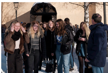
Fighting the Darkness slår rekord 2025. Bilden är från 2018.