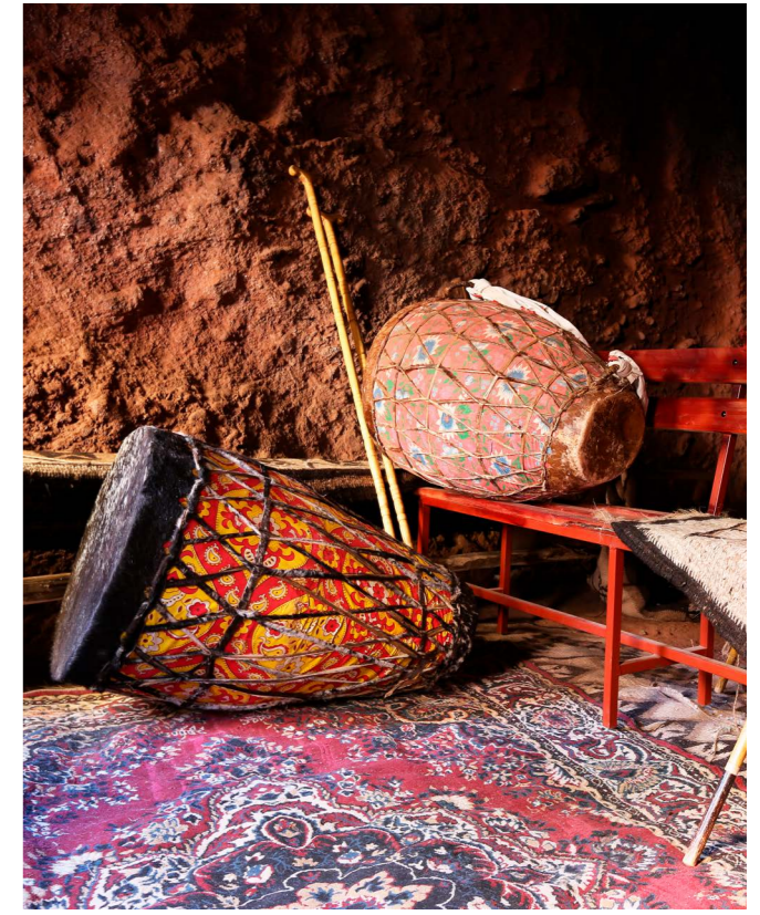
Trummor och stavar som används vid etiopiska gudstjänster.

och stridigheter med grannlandet Eritrea. Just nu pågår strider i regionen Tigray. Allt detta har givetvis påverkat landet och dess befolkning väldigt negativt.