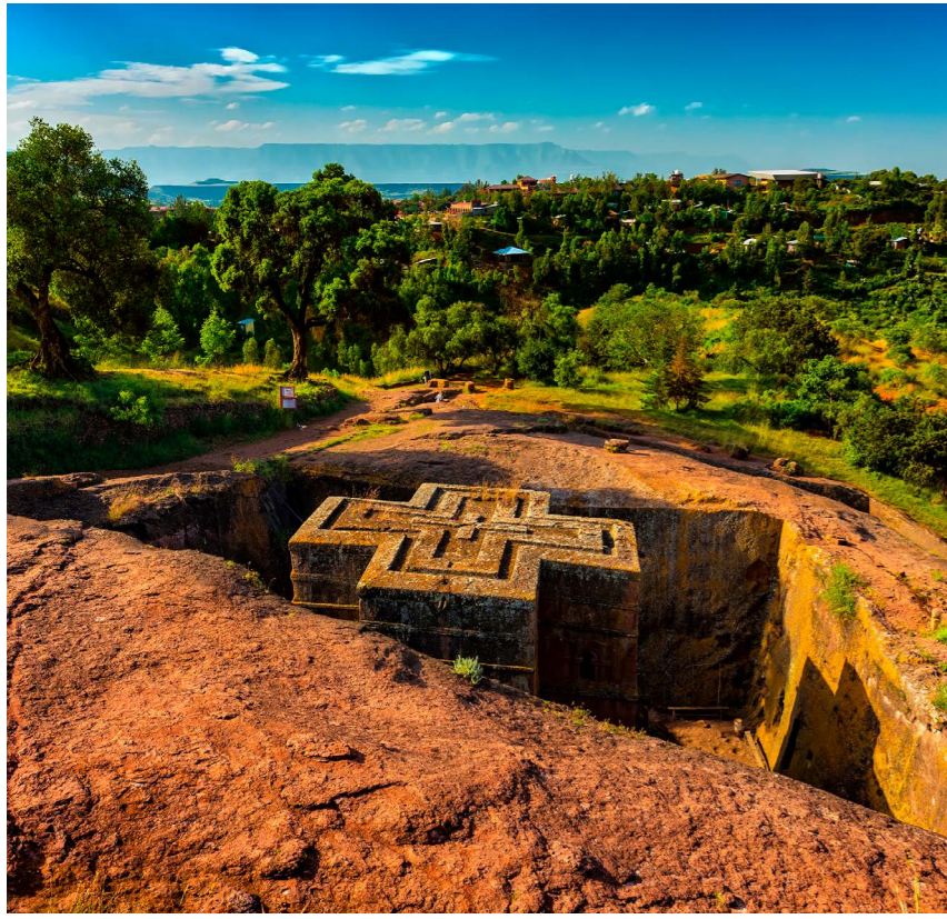
Sankt Georgs kyrka (Bete Giyorgis).