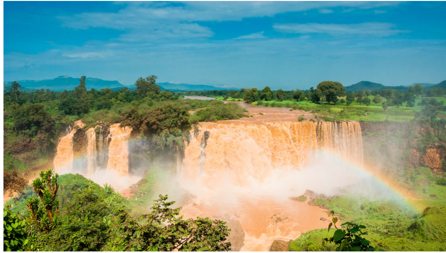
Blue Nile Falls (Tis abaye).