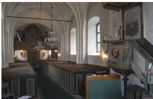
Interiör mot väster.

kyrkans äldsta textilier. Från 1800-talet härrör en mässhake i svart sammet dekorerad med kors och strålkran. Kyrkan äger även en brudpäll av siden från 1770-talet. Sakristian bevarar två runstenar.