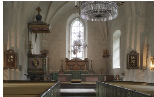
Interiör mot koret i öster.

Kyrkans altaruppsats av trä, tillverkades 1802 av hovbildhuggaren Per Ljung (1743–1819). Formen är inspirerad av en antik sarkofag och kröns av ett kors med strålskrans. Under 1970-talet ersattes den tillhörande altarringen med nuvarande knäfall. Altaruppsats liksom knäfall är målade i rosa marmorering med förgyllda ornament.