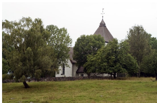
Kyrkan och bogårdsmuren från nordost.

Interiört präglas kyrkan av den form den fick i samband med senmedeltidens moderniseringar. Då slogs långhusets tegelvalv och det nuva-