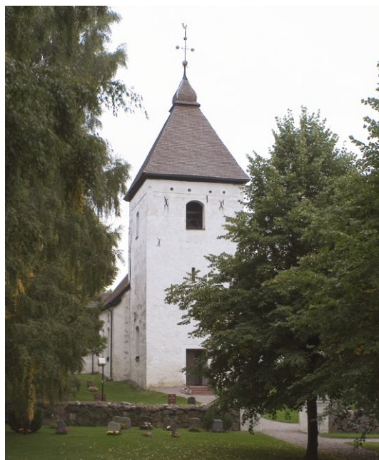
Exteriör med västtornet.

Kyrkans fasader är spritputsade med slät puts på omfattningar kring fönstren. Det östra fönstret har behållit sitt ursprungliga utseende med avtrappad profil som uppåt avslutas med en spetsbåge. Alla fönster, utom korfönstret , vidgades senast 1884.