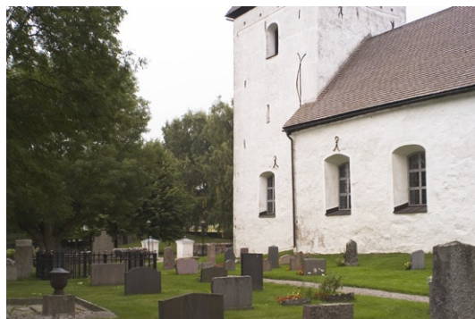
Exteriör av sydfasaden.

Kyrkan ligger i öst-västlig riktning med sakristia i norr. Murarna är uppförda av vald och kliven gråsten, medan tornets övre del, långhusets västra gavel samt alla omfattningar och valv är uppförda av tegel.