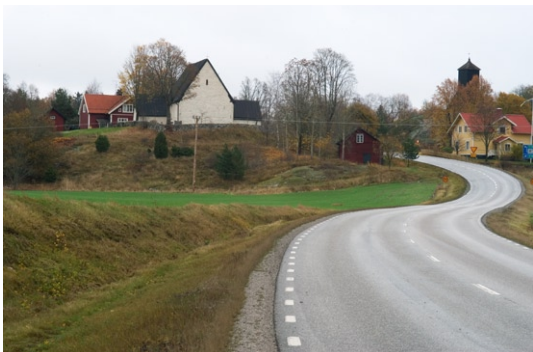
Kyrkan och klockstapeln från väster.

gamla skolhuset som uppfördes 1870–71. Byggnaden används sedan 1977 som församlingshem. Bebyggelsen kring Angarns kyrka är huvudsakligen från slutet av 1800-talet och början av 1900-talet, men har förändrats under senare tid.