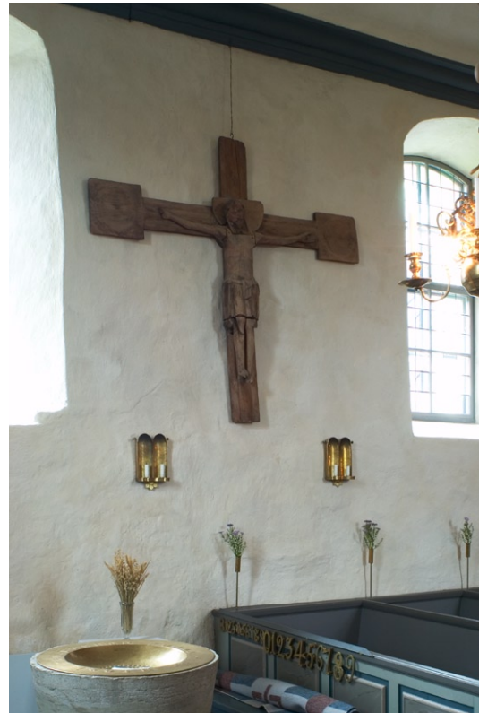
Triumfkrucifix på kyrkans sydvägg.

Av kyrkans nattvardskärl tillverkades kalk, patén och vinkanna av silver under 1800-talets första hälft. Oblatasken tillkom redan 1710. I