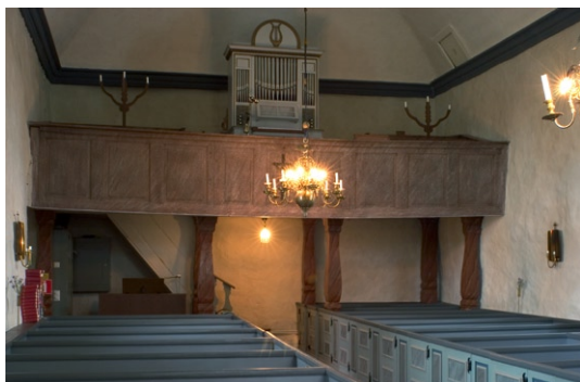
Interiör mot orgelläktaren i väster.

noveringen. Den utskjutande norra delen togs bort och fronten försågs med den porfyrmarmorering den har idag. På orgelläktaren finns ännu originalbänkarna bevarade liksom två trearmade ljusbärare, även de marmorerade. Läktarombyggnaden genomfördes av snickaren Lundin. 1849 införskaffades kyrkans första orgel. Även om orgelverket förändrats, senast 1970, är den gamla fasaden bevarad.