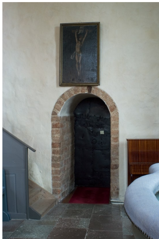
Entrén till sakristian från kyrkorummet.

Korgolvet , som är belagt med röd kalksten, är något förhöjt. Altare och altarring tillverkades 1788, men målades om under renoveringen