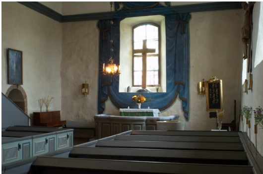
Interiör mot koret i öster.

1946 för att harmoniera med de nya bänkarna. 1846 dekorerades korfönstret av ett förgyllt kors med törnekrona samt en väggmålning med blått draperi i nyklassicistisk stil.