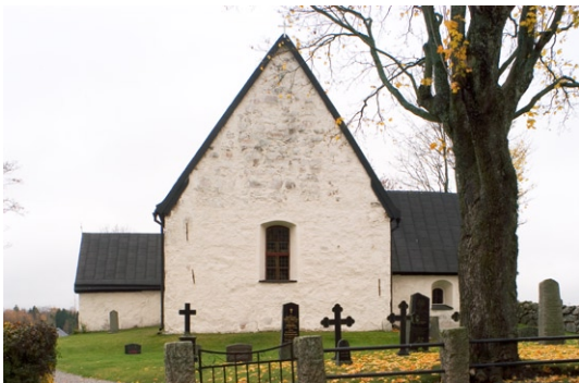
Exteriör från öster med vapenhus och sakristia .

Mot väster finns ännu ursprungsfönstret, eller snarare den ursprungliga gluggen bevarad. Kyrkans tak, som tidigare var täckta av