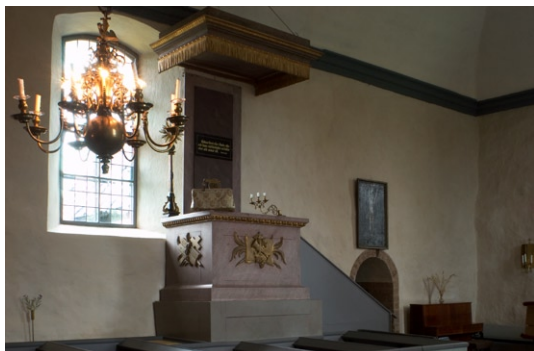
Predikstolen på norra väggen.

Predikstolen, även den porfyrimiterande, tillverkades av hovbildhuggaren Per Ljung i nyklassicistisk stil i samband med renoveringen 1795–96. Ljudtaket är dekorerat med stiliserat utskurna fransar. Timglaset, som har ett ställ av snidat och förgyllt trä, skänktes till kyrkan 1745.