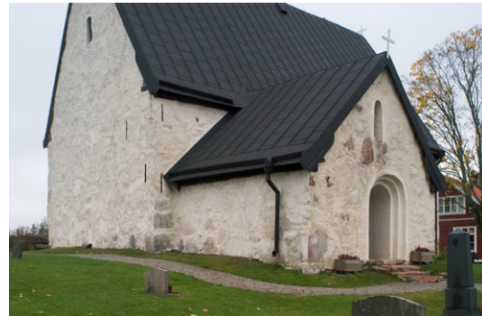
Exteriör från sydväst.

spån, är nu klädda med falsad och svartmålad plåt.