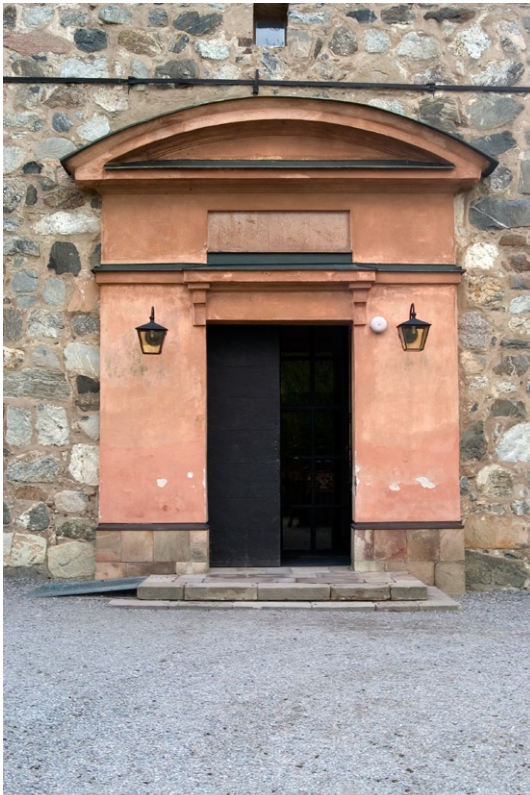
Putsad västportal från 1763.

Kyrkans oputsade gråstensfasad är murad i relativt regelbundna skift med skarpa hörnstenar och utstrukna fogar. Markerad sockel saknas. Slätputsat tegel förekommer i portal- och fönsteromfattningar och i östra gavelröstets blindering. I sydöstra hörnet finns en strävpelare av murat tegel. Över portalen finns ett rektangulärt fönster och året 1128, invigningsåret för Botvidslegendens träkyrka. En rest av målad dekor syns under hammarbandet ovanför mitt-