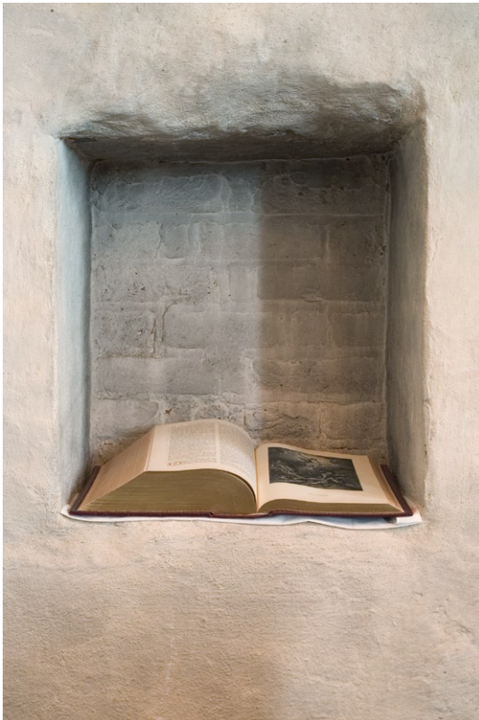
Medeltida murad nisch i korväggen.