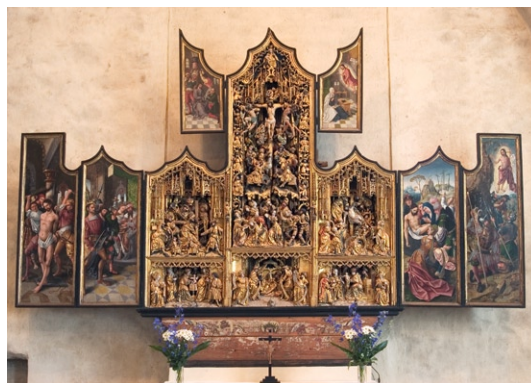
Altarskåp från Antwerpen daterat till 1500-talets början.

filerade murpelare och höga stjärnvalv är vitkalkade och ljuset flödar in genom de höga fönstren. Begravningsvapen pryder väggarna. Två nummertavlor av svartmålat trä med förgylld ram är uppsatta på valvpelarna i koret .