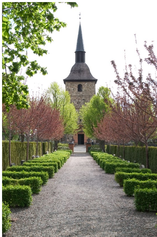
Exteriör med utvidgad kyrkogård mot väster.

Söder om vapenhuset är en sandstenskopia