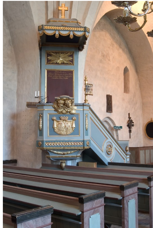
Predikstolen i norr.

Ingången från kyrkan till sakristian är spetsbågig och utåt mot kor et tresprånig. Dörren av sammannitade järnplåtar med dörring är medeltida. En dörr i väster mot kyrkogården togs upp 1928. Sakristian täcks av ett tunnvalv med