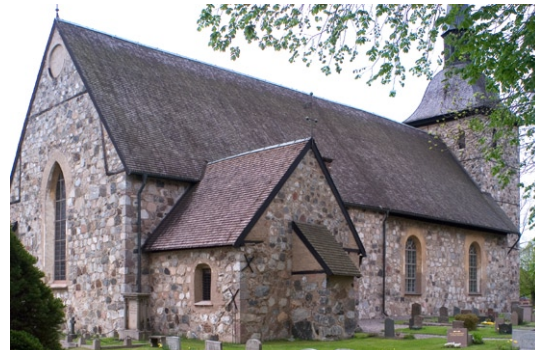
Exteriör från nordost.

Samtliga tak är spåntäckta. Tornet har svarttjärade ljudluckor och avslutas av en karnisformad tornhuv med plåttäckt spira som kröns av en kyrktupp av smide. Sakristian har utgång