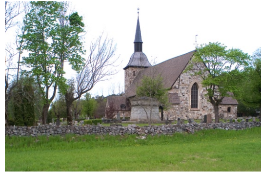
Exteriör från öster.

fönstret på norrsidan av långhuset. Kyrkans ingång i väster genom tornet med putsad och tegelfärgad portal med halvmeterhög sandstenssockel tillkom 1763. Porten av trä är på insidan målad, på utsidan beslagen med svartmålad järnplåt. Inskriftstavlan på frisen saknar inhuggningar. Entrén genom vapenhuset i söder används inte längre. Östgavelns spetsbågiga fönster, synligt enbart från utsidan, är medeltida. Övriga, rundbågiga fönster mot norr och söder är senare förstorade.