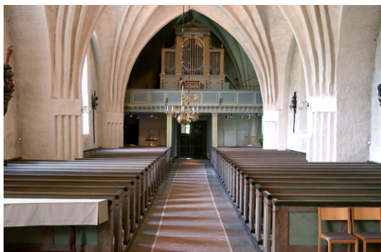
Interiör mot väster. Gångmatta Jacobs stege © BARBRO NILSSON/ BUS 2008

hov. Orgeln, som ursprungligen hade 31 stämmor, är byggd av Åkerman & Lund 1977 och kompletterad med 5 stämmor 1992 av Nye Orgelbyggeri.