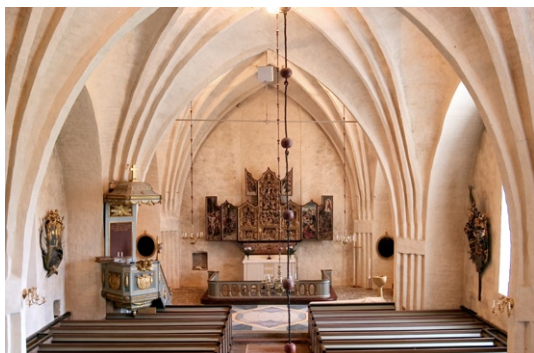
Interiör mot öster.

Bakre delen under orgelläktaren saknar tre bänkrader, utrymmet används bl a för liggande förvaring av textilier. Väggen mot väster har skåp för förvaring. Kyrkorummets väggar, pro-