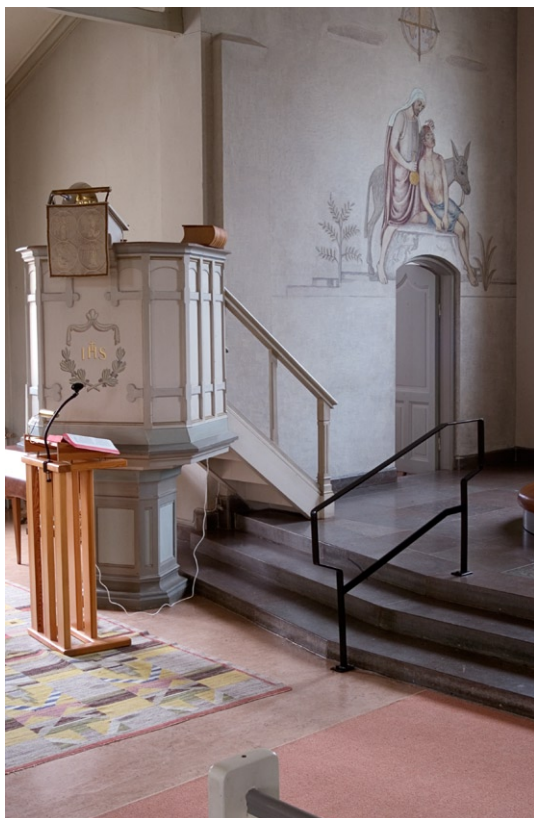
Predikstolen intill koret.