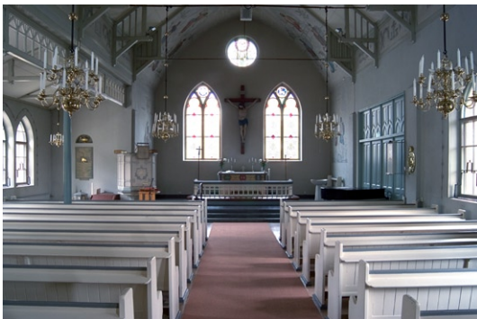
Interiör mot koret i öster.

Altarringen och predikstolen hör till kyrkans originalinredning. Även bänkarna är ursprungliga, men ändrades och flyttades i samband med renoveringen 1955 så att en mittgång uppstod. Den nuvarande orgelläktaren och orgeln tillkom i och med 1955 års renovering. Läktarbar-