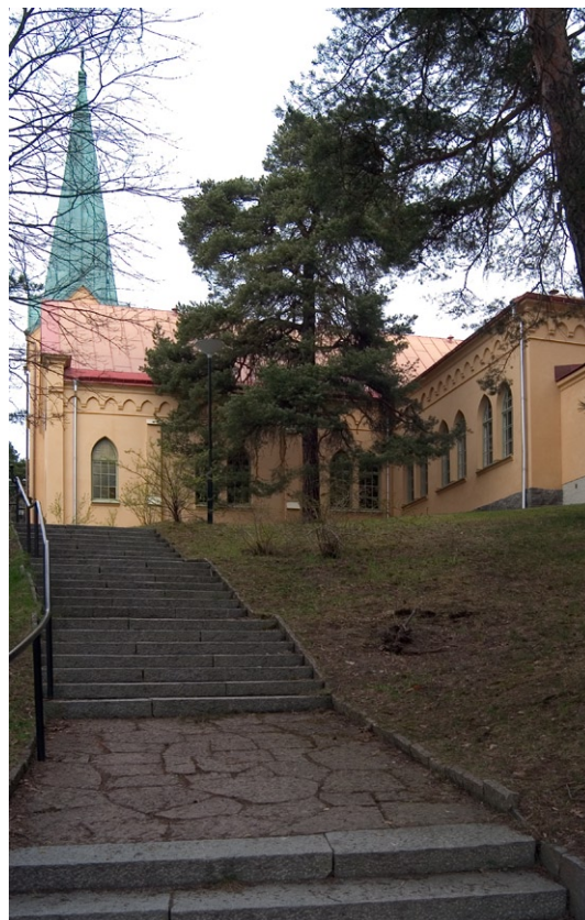
Exteriör från söder.

Kyrkorummet täcks av en öppen takstol och väggarna är målade i vitt. Överst kröns väggfältet av målade språkband .