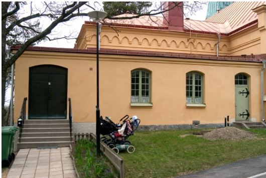
Församlingsdelen från öster

ståndelsen. Cirka tio år senare dekorerades även korgväggarna med målningar av samma konstnär, denna gång föreställande Den barmhärtige samariten och Kristi dop. Under renoveringen målades hela interiören om i ljusa färger, i motsats till den dovare färgskala inredningen tidigare haft. Sedan 1950-talets renovering är korggolvet upphöjt och belagt med kalksten. På långhusgolvet ligger däremot en linoleummatta.