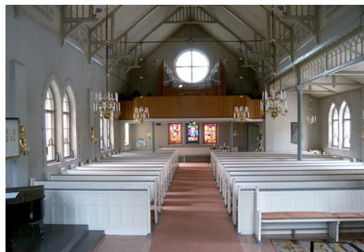
Interiör mot orgelläktaren i väster.

Kyrkans äldre dopfunt i trä tillverkades av församlingsbor och står numera i sidoskeppet. I samband med den stora renoveringen under 1950-talet skänktes en ny dopfunt till kyrkan. Denna är huggen i vit marmor av skulptören Bengt Härdelin. Dopfatet utfördes av silver-