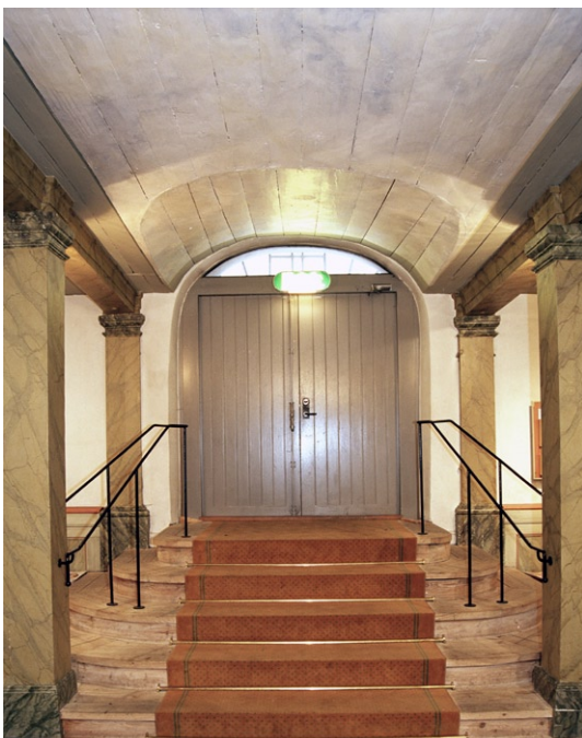
Ytterporten i väster under läktaren.

ren av trä har en brunrödmålad insida medan gavlarna är marmorerade i grågrönt med ett räfflat fält, delvis förgyllt. I väster leder en trätrappa med svart smidesräcke till en ytterport med ett spröjsat, stickbågigt fönster över.