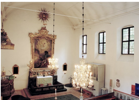
Kyrkorummet från läktaren mot koret.

ren av trä har en brunrödmålad insida medan gavlarna är marmorerade i grågrönt med ett räfflat fält, delvis förgyllt. I väster leder en trätrappa med svart smidesräcke till en ytterport med ett spröjsat, stickbågigt fönster över.