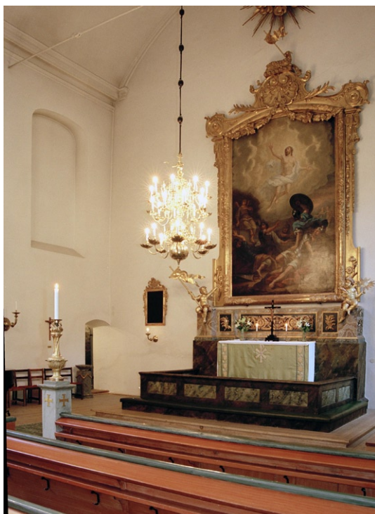
Kyrkorummet mot koret.

taruppsatsen utgörs av en mycket stor förgylld träram med snidad dekor, krönt av Guds lamm och nederst flankerad av fristående keruber. Altartavlan föreställer Kristus uppståndelse ur grav. Uppsatsen har ett postament klätt med marmoreringsmålade duk. Altaret av trä har en dekormålad framsida. Altarringen av trä är marmorerad och har fyllningar.