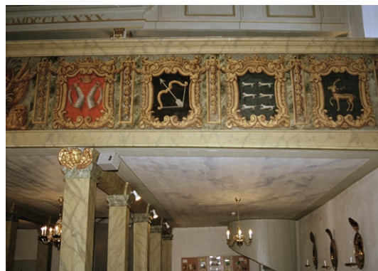
Läktarbarriär med finska landskapsvapen.

Den övre läktaren, där orgeln står, bärs upp av fyra pelare med förgyllda voluter . I sydost ligger ett nytt brädgolv, i övrigt ett äldre obehandlat plankgolv. Taket är det samma som i kyrkorummet. I väster sitter ett rosettfönster. I den norra delen står kyrkbänkar av en enkel, ålderdomlig typ. Barriären av trä är fältindelad och gråmålad med delvis förgyllda, profilerade lister. Orgeln, ursprungligen byggd 1790 av Olof Schwan i Stockholm, har en gråmålad fasad med stram dekor och räfflade fält. Det är den enda 1700-tals Schwanorgeln i Stockholm som