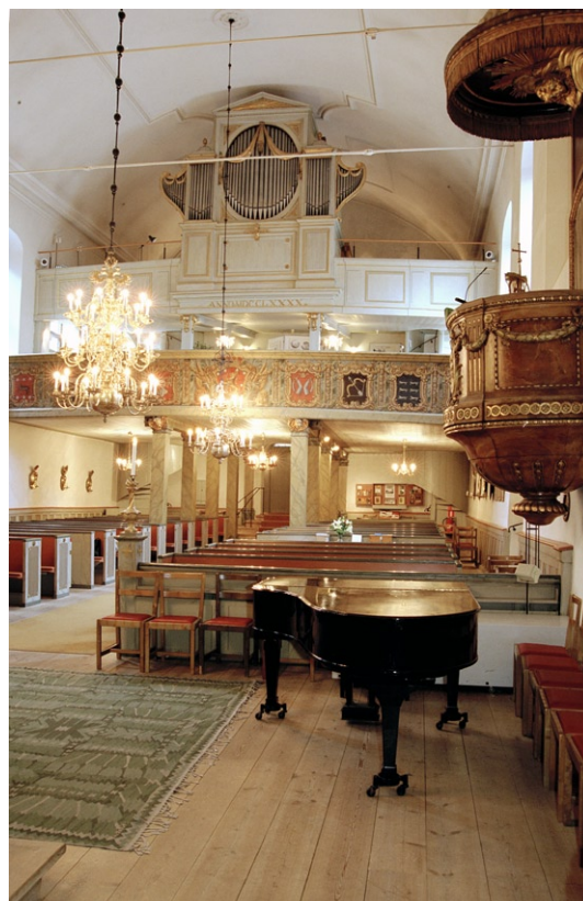
Kyrkorummet mot orgelläktaren. Till höger syns predikstolen.

Intill dörren till sakristian i nordost står dopfunten av trä. På ett gråmarmorerat postament med en snidad och förgylld girland vilar en funt av trä. Kormattan är mönstrad i grönt. Under predikstolen står en flygel och på motsvarande plats mot den södra väggen står en kororgel . Den är tillverkad 1995 av Orgelbyggeri Martti Porthan AB i Finland. Fasaden är målad i ljusgrått.