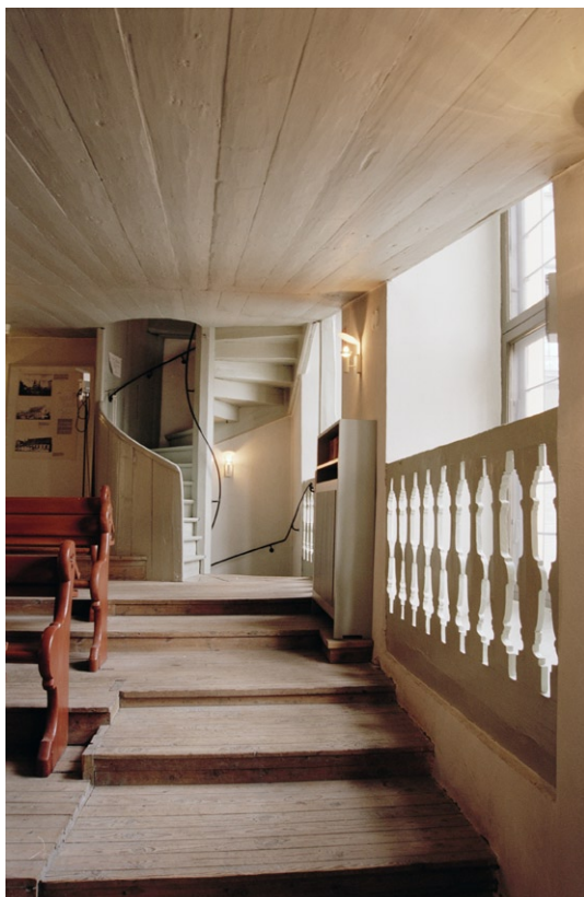
Den undre läktaren med spiraltrappa i fonden.

barriären är Finlands åtta landskapsvapen och riksvapnet målat på en duk.