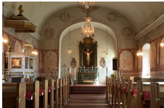
Interiör mot öster.

Från kyrkans entré i väster kommer man först in i ett mindre vapenhus med träinredning från 1950-talet. Väl inne i kyrkorummet kan man överblicka hela rummet, som har prägel av sockenkyrka på landet. Väggarnas fältindelade målningar från 1600-talet togs fram vid restaureringen 1913. De kompletterades sparsamt och utrymmet mellan 1600-talsmålningarna och taket dekorerades med en jugendinspirerad fris av Allan Nordvall, som även gjorde målningar i det då nybyggda koret, överkalkade 1951, och triumfbågens mur. Golven i mittgången och koret är lagda med tegel på 1950-talet, medan golvytan i bänkkvarteren är täckt med ekparkett 2001.