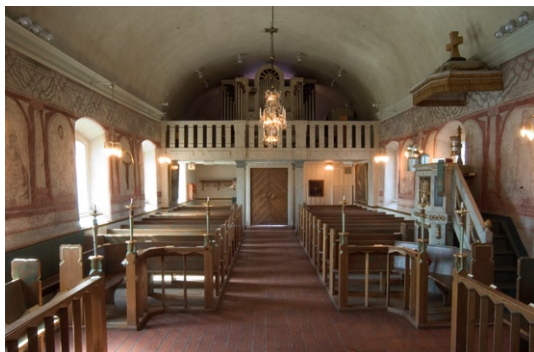
Interiör mot ingång och orgel i väster.

Sakristian är uppförd i två våningar efter branden 1969. Övervåningen utgör den egentliga sakristian med textilskåp och förvaringsut-