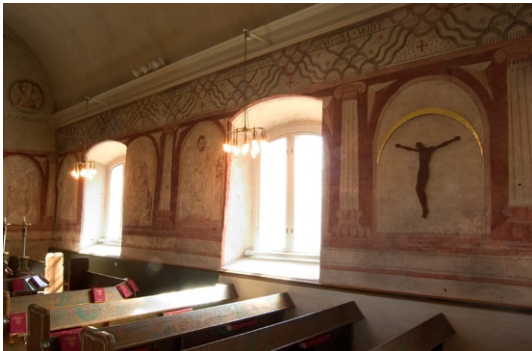
Södra väggen med 1600-talets arkadmålningar och tidiga 1900-talets målade fris under profilerad taklist. Bänkar och armatur från 1950-talet.

Det något högre belägna kor et byggdes 1913 med en rektangulär plan, smalare än långhuset och med rakt avslutad östmur. Ljuset kommer från två fönster i sydmuren. Altare och altartavla, utförd i rokokons anda, är skänkta till kyrkan i samband med renoveringen 1756. Altartavlan består av en ram med förgyllda och målade ornament och av en oljemålning på väv som visar Kristus på korset. Altaruppsatsen kröns av Gudsögat och en framställning av korslammet med segerfanan . Krucifixet på altaret är skänkt av Norra Lidingö kyrkliga syförening. I kor et hänger en malmkrona från 1689 samt en replik från 2001 och på kor väggen hänger ett