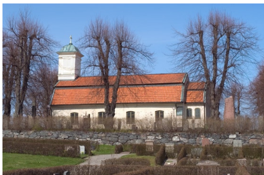
Kyrka, bogårdsmur och lindar från söder.

1810 en sk stomplantering med 30 lindar av vilka 24 hamlade lindar ännu står kvar. 1854 utvidgades kyrkogården åt söder och öster vars gräns markeras av de yngre lindarna. Två år senare ersattes den västra bogårdsmuren av ett smidesstaket med grindar mitt för kyrkans ingång. Staketet var inköpt från Ulriksdals slott. Framför kyrkans västfasad och grindarna finns en kyrkplan som begränsas av vinkelställda kallmurar, troligen uppförda 1818. Från den tiden finns ringar i muren där hästarna bands. Vid sidan om grinden hänger den gamla fattigbössan av järn, skänkt 1823 av Carl Lindbom på Hersby.