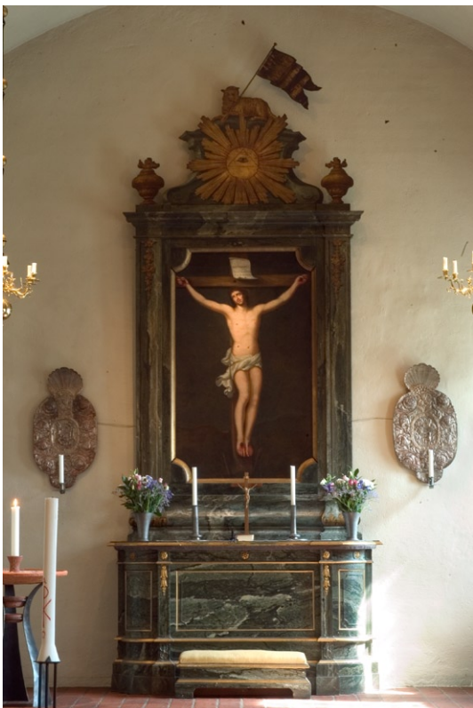
Målat altare och altaruppsats i rokostil , barock -ljusplåtar i mässing och ljusbärare från vår tid.

Det något högre belägna kor et byggdes 1913 med en rektangulär plan, smalare än långhuset och med rakt avslutad östmur. Ljuset kommer från två fönster i sydmuren. Altare och altartavla, utförd i rokokons anda, är skänkta till kyrkan i samband med renoveringen 1756. Altartavlan består av en ram med förgyllda och målade ornament och av en oljemålning på väv som visar Kristus på korset. Altaruppsatsen kröns av Gudsögat och en framställning av korslammet med segerfanan . Krucifixet på altaret är skänkt av Norra Lidingö kyrkliga syförening. I kor et hänger en malmkrona från 1689 samt en replik från 2001 och på kor väggen hänger ett