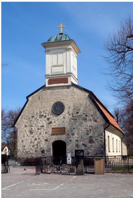
Exteriör från sydväst.