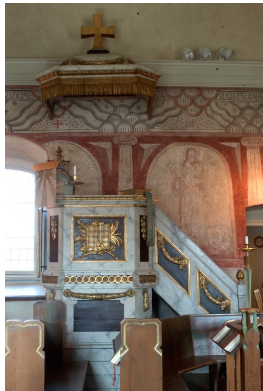
Predikstol i norr från 1779 i gustaviansk stil av Per Ljung.