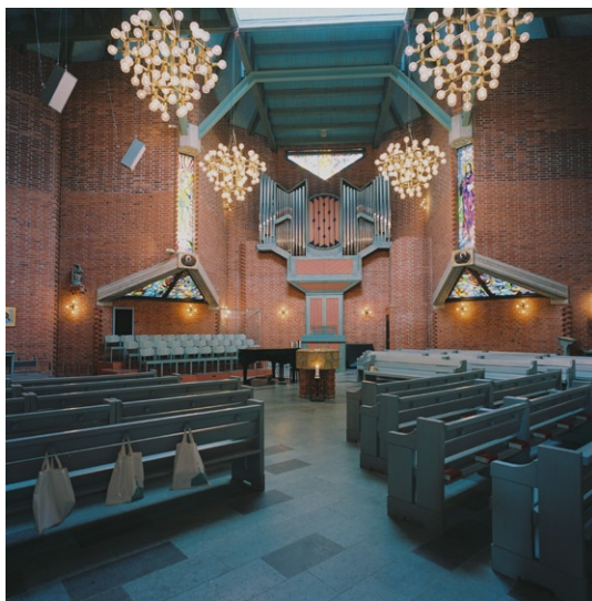
Kyrkorummet mot orgeln.

kubformad sten, delvis polerad och inmurad i väggen. Stenen sattes upp 1990 till minne av de barn från Kista som omkom i en bussolycka i Norge 1988.