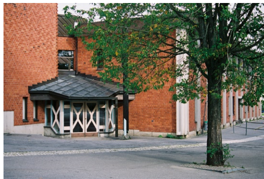
Exteriör från sydväst.

Golvet är belagt med kalksten. Det träpanelklädda taket har många vinklar, synliga bjälkar och är till största delen laserat i ljusblått. En stor