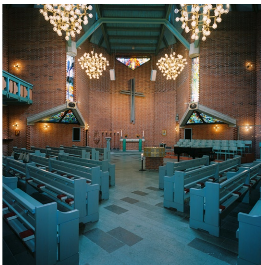
Kyrkorummet mot koret.

lanternin höjer sig över mitten av kyrkorummet och sprider överljus. Fyra stora takkronor består av en mängd stora glödlampor i en mässingsarmatur. Utmed kyrkans väggar sitter väggarmaturer av samma typ men med fyra glödlampor.