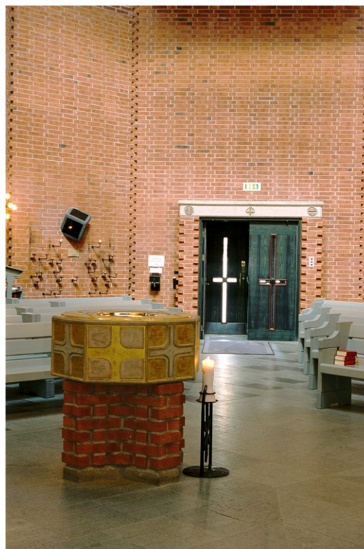
Kyrkorummet mot ytterporten med dopfuntens förgrunden.

I den södra korsarmen ligger koret med ett altare av rött tegel och en gjuten betongskiva dekorerad med ingjutna kalkstensplattor och viss förgylld dekor. På korväggen sitter ett stort träkors. Ambon av gråmålat trä, som ersätter den ursprungliga predikstolen, står framför piscinan. Den är murad som en del av väggen med en nisch i teglet över en konvex murdel med en skål