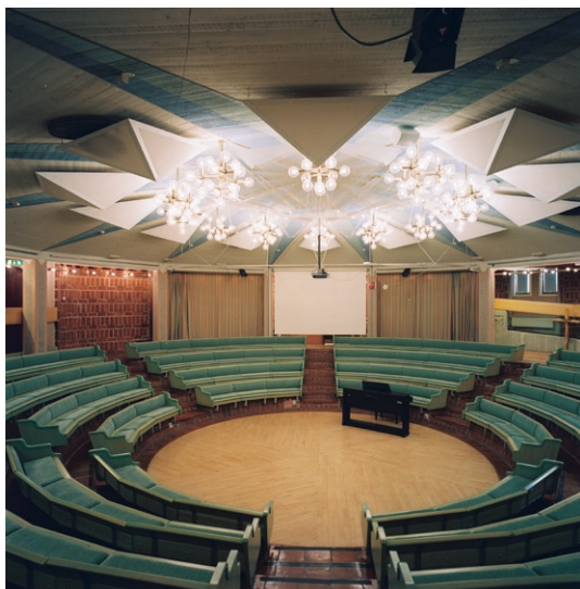
Samlingssal på b v, den s k Kryptan .

målad i turkost med kopparplåt mellan de glest placerade bräderna. Taket är utfört på samma sätt som väggarna. Altare, dopfont och ambo är av turkosmålat trä. På bottenvåningen finns också den s k Kryptan , ett mångsidigt rum med gradänger likt en amfiteater . Golvet är belagt med klinker och väggarna är murade av håltegel. I taket sitter olika sorters akustikplattor. Träbänkarnas textilkädsel är sekundär.