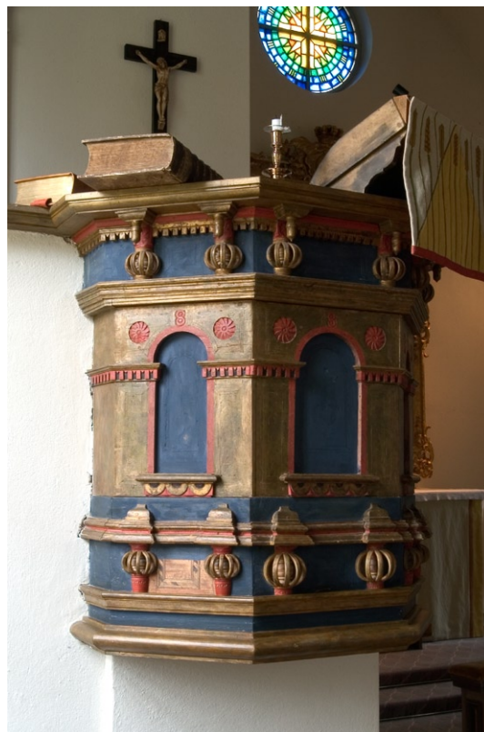
Kyrkans predikstol från 1620-talet.

Kyrkans predikstol från 1620-talet togs åter i bruk vid 1952 års restaurering, då den ersatte en predikstol från 1877. 1600-talspredikstolen in-