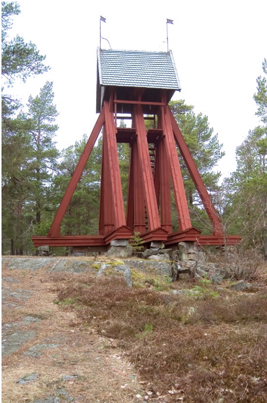
Klockstapel från sydväst.

det Levinska gravkoret ut. Det uppfördes av Adolf Ludvig Levin (1733–1807), Arbottna herrgård, under 1700-talets senare del. Koret är en tunnvälvd putsad tegelbyggnad med ingång från kyrkan.