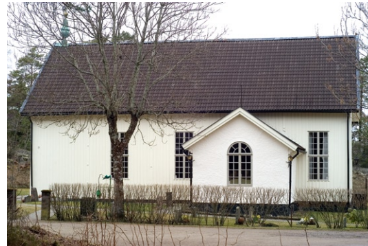
Kyrkobyggnaden med det lilla utbyggda gravkoret från söder.

Kyrkan har en dörröppning i vardera gavel. Entrén till kyrkan är belägen i den västra gaveln