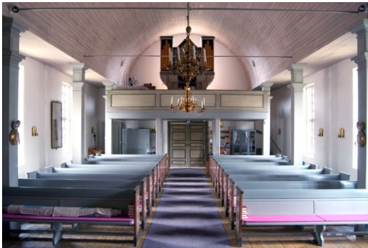
Kyrkorummet från öster.

lad av Per Krafft den äldre. Den förgyllda rokokoramen kröns av det svenska riksvapnet och en sluten kungakrona, vilket indikerar att ramen