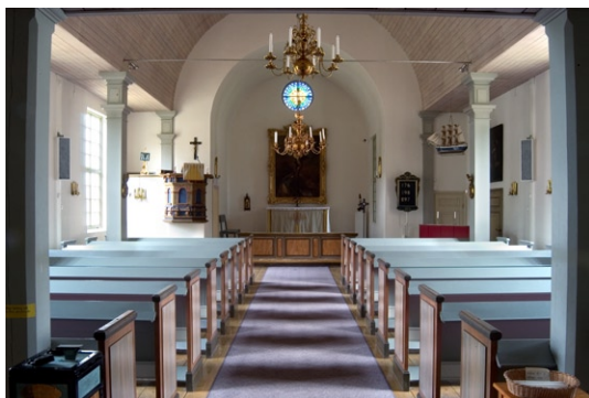
Kyrkorummet från väster.