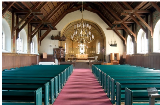
Interiör mot öster.

Kyrkans interiör domineras av den öppna takstolen, laserad i brunt med polykrom dekormålning liksom läktaren, allt oförändrat sedan byggnadstiden. Långhusets väggar är boaserade upp till fönstrens underkant, däröver putsade och dekormålade. Av den ursprungliga vägg boaseringen återstår golv- och krönlist medan pärspåntpanelen ersattes 1956 med släta fyllningar och hela boaseringen övermålades i en ekådring.