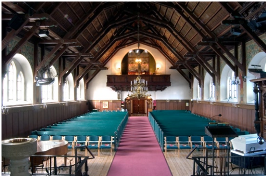
Interiör mot väster.

Fönstren har svagt färgade glas. Mellan fönstren har väggarna målade helfigurer som föreställer apostlarna med attribut och över fönstren täcks