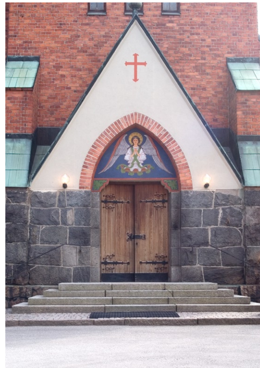
Västportalen i tornet.

Entrén i väster sitter i en spetsbågig grundutbyggnad. Portalens omfattning är murad i rött tegel. Porten består av svängdörrar i ek med beslag av svart smide. En målning i tympanonfältet ovanför porten, ursprungligen utförd i alfresco , skadades av misstag vid en restaurering 1960, men rekonstruerades 1977 efter ett fotografi. Motivet föreställer en ängel