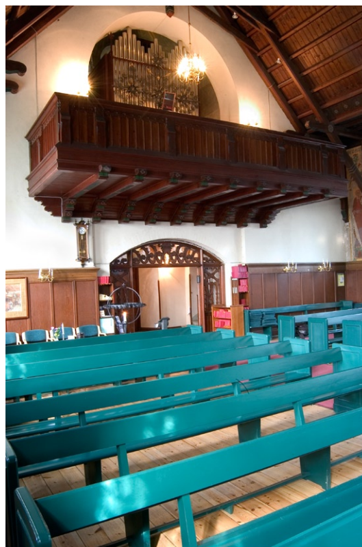
Interiör mot väster med läktare och orgelfasad.

Klockorna från Nacka gamla kapell smältes ner och göts om 1891 av Joh A Beckman & Co,