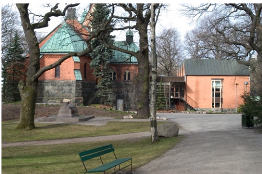
Exteriör från öster.

med diadem och gloria och är liksom den vegetativa hörndekoren över porten utförd i jugendstil .