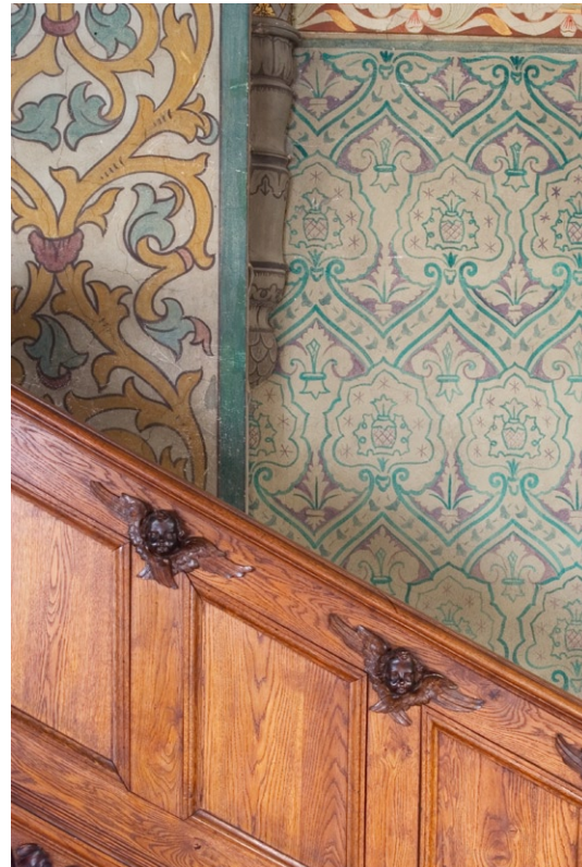
Trappa till predikstolen med dekormålning i triumfbåge och kor .

väggarna av schablonmålade akantusrankor i grönt och brunt. Skisser till interiörens ursprungliga målningar är utförda av arkitekten och konstnären Agi Lindegren som behärskade den dekorativa konsten till fulländning.