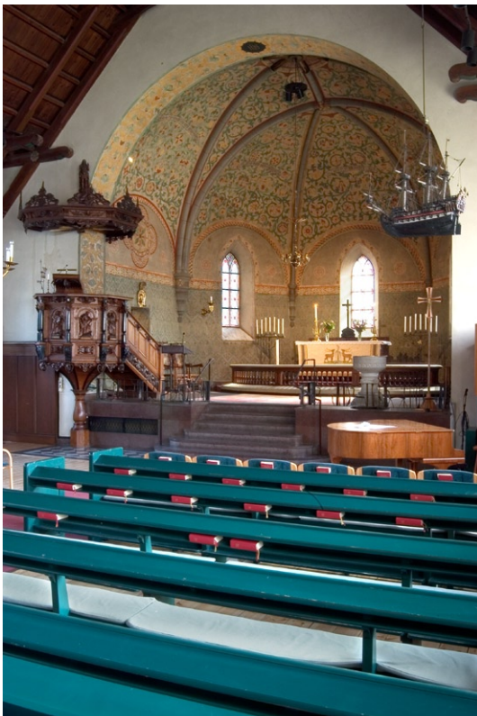
Interiör mot koret.

Fönstren har svagt färgade glas. Mellan fönstren har väggarna målade helfigurer som föreställer apostlarna med attribut och över fönstren täcks