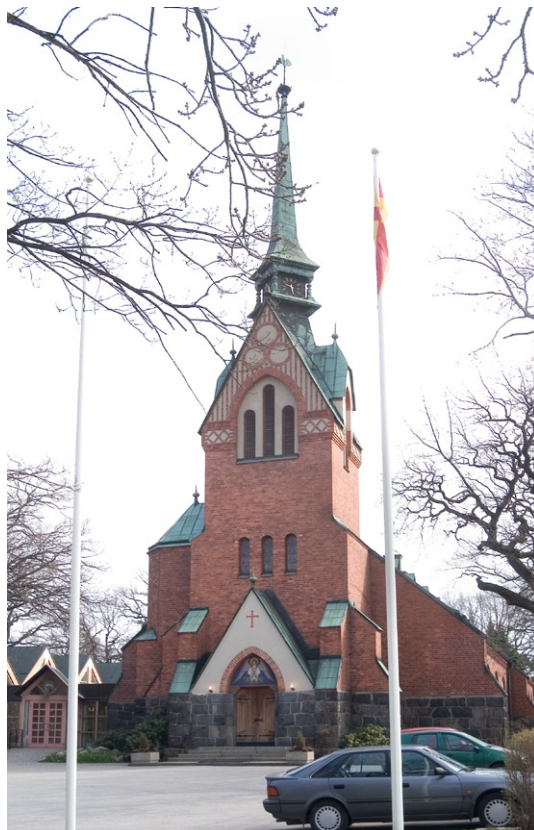
Västfasad med torn och entré.

Fasadmurarnas släta, hårdbrända tegel kontrasterar mot den höga stenfotens tuktade granitblock. Det röda teglet karakteriseras av att vara utfört med precision, ett viktigt uttryck under industrialismens början. Strävpelare förekommer runt hela kyrkan. Tornet är murat med ut-