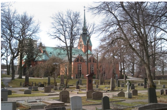
Exteriör från norr med kyrka och tillbyggt församlingshem.

I församlingshemmet har arkitekten utgått från kyrkans ursprungliga tegel och fasaderna är murade i tegel från Brunflo över en sockel av sten. Höga burspråk av trä och glas bryter upp