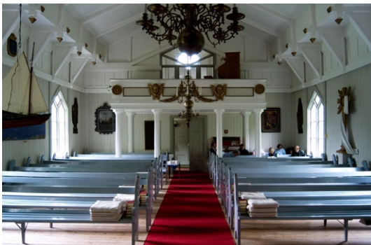
Interiör mot entré och läktare i väster.

Väggen bakom altaret är klädd med en klart kornblå pärlspåntpanel prydd med förgyllda metallstjärnor i krans runt altarprydnaden. Altaret av trä är likaså av blåmålad panel medan altarringen är vitmålad med förgyllda lister kring fyllningarna och klädd med ett rött tyg. Två gråmålade trefyllningsdörrar på ömse sidor om altaret leder till sakristian . Till höger om altarringen står den gamla vedkaminen i ursprungligt läge och till vänster finner man predikstolen som liksom bänkinredningen är samtida med kyrkan. Predikstolen i trä står på en åttkantig sockel och är liksom altarringen vitmålad med förgyllda lister kring fyllningarna. Bänkinredningen består av på vardera sidan tio