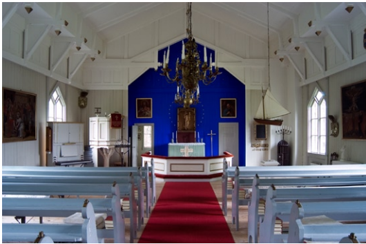
Interiör mot koret i öster.

Väggen bakom altaret är klädd med en klart kornblå pärlspåntpanel prydd med förgyllda metallstjärnor i krans runt altarprydnaden. Altaret av trä är likaså av blåmålad panel medan altarringen är vitmålad med förgyllda lister kring fyllningarna och klädd med ett rött tyg. Två gråmålade trefyllningsdörrar på ömse sidor om altaret leder till sakristian . Till höger om altarringen står den gamla vedkaminen i ursprungligt läge och till vänster finner man predikstolen som liksom bänkinredningen är samtida med kyrkan. Predikstolen i trä står på en åttkantig sockel och är liksom altarringen vitmålad med förgyllda lister kring fyllningarna. Bänkinredningen består av på vardera sidan tio