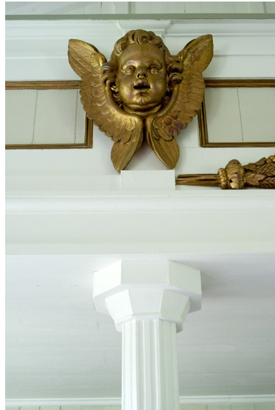
Förgylld putti på läktarbarriären.

stycken lösa gråmålade bänkrader med kontursågade gavlar samt ljushållare för stearinljus. Ett relativt nytt inslag i kolet är från 1991 av Gunnar Guhrén.