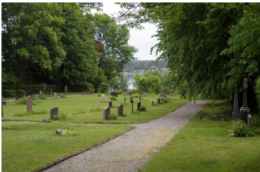
Kyrkogården söder om kyrkan.

Kyrkogården omges i dag av en lummig grönska med flertalet uppvuxna träd, men hade tidigare ett mer öppet läge. I norr och delvis i väst avgränsas området av ett enkelt omålat trästaket ett par vitmålade trägrindar mitt för kyrkporten samt ytterligare grindar i väst. I öst avgränsar en häck och i väst och söder bygger en stenmur upp den äldre kyrkogårdens etage. Kyrkogården är gräsbevuxen med raka grusgångar och endast ett fåtal gravstenar. Strax sö-