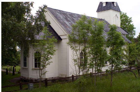
Exteriör från nordost.

tornet samt de spetsbågade fönstren med spröjsverk. Fasaden är klädd med omväxlande liggande och stående brädpanel som smyckas av tandsnittslister , lister och enkla pilastrar . Tandsnitt örningen samt portalen har drag av renässans . Numera är kyrkan enhetligt vitmålad men var förmodligen ursprungligen tvåfärgad med ljus panel och mörkare accenter. Kyrkporten med panel av snedställda, profilerade brädor är målad i brunt samt försedd med kraftiga gångjärnsbeslag. En gjuten kyrktrappa i fem steg leder upp till kyrkporten. Årtalet 1876 i metallisiffror samt ett enkelt vitmålat träkors kröner porten.