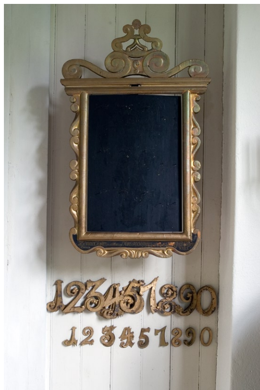
Nummertavla av svartmålat trä med snidad förgylld ram från 1700-talets slut.

Dessa är troligen från kapellets invigning. Två oljemålningar som föreställer aposteln Petrus med den galande tuppen samt Ecce Homo , skänkta till församlingen 1729, flankerar idag altaret. Lorentz Billing på Östervik skänkte två kyrkklockor samt nästan allt kyrksilver till 1702 års kapell.