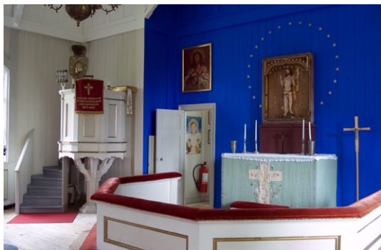
Altare och predikstol.

Från 1702 års kapell härrör en oljemålning som föreställer Korsfästelsen. Denna fungerade förmodligen som altartavla och flankerades av två stycken utsågade figurer på bemålad träpanna föreställande Moses och Johannes döparen.