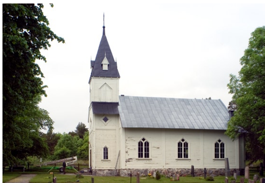
Exteriör från söder.

tornet samt de spetsbågade fönstren med spröjsverk. Fasaden är klädd med omväxlande liggande och stående brädpanel som smyckas av tandsnittslister , lister och enkla pilastrar . Tandsnitt örningen samt portalen har drag av renässans . Numera är kyrkan enhetligt vitmålad men var förmodligen ursprungligen tvåfärgad med ljus panel och mörkare accenter. Kyrkporten med panel av snedställda, profilerade brädor är målad i brunt samt försedd med kraftiga gångjärnsbeslag. En gjuten kyrktrappa i fem steg leder upp till kyrkporten. Årtalet 1876 i metallisiffror samt ett enkelt vitmålat träkors kröner porten.