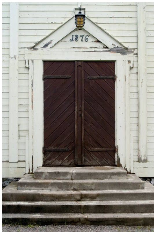
Västportalen i nygotisk stil.