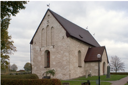
Exteriör från sydväst.

Fönstren är rundbågiga och försedda med småspröjsade träbågar. målade i en engelskt röd kulör. I absiden är sedan 1750 ett litet rundfönster upptaget. 1910 försågs det med en glas-målning som framställer ett Kristushuvud. Kyrkans ingång är genom vapenhuset , vars rundbågiga öppning vidgades och försågs med en ny