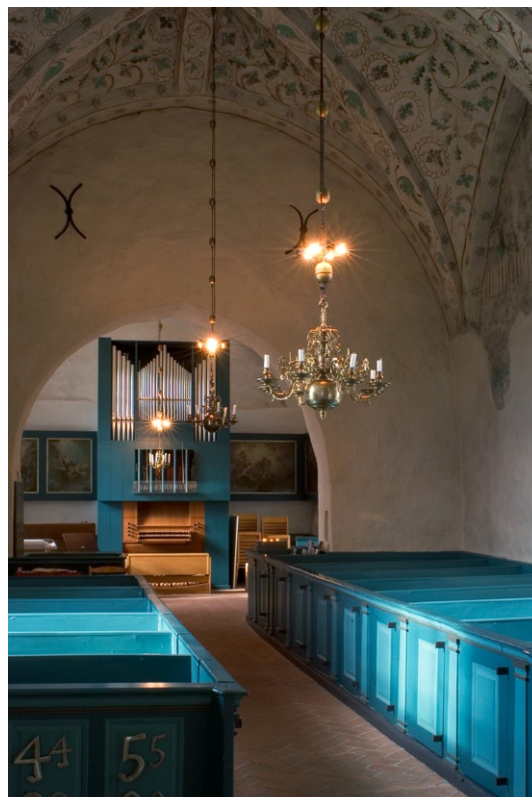
Kyrkorummet åt väster.

Bakkyrkan utgörs av långhusets förlängning under 1400-talet. Under 1750-talet uppfördes här en läktare som revs 1910. Längs väggarna i