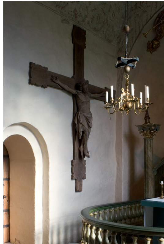
Triumfkrucefifix från omkring 1300.

Under 1700-talets mitt omgestaltades kyrkan interiört. Då tillkom altarpredikstolen , bänkar och läktare och valvmålningarna överkalkades. Restaureringen bekostades av C W Cederhielm, ägare till Lindholmens gård. Altarpredikstolen i rokoko har en symmetrisk uppbyggnad med svängda sidotrappor som slutar i kolonner med korintiska kapitäl . Den är marmoreringsmålade med förgyllda detaljer samt smyckad med oljemålningar som framställer Kristus i Getse-