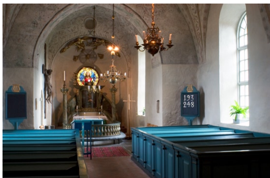
Kyrkorummet åt öster.