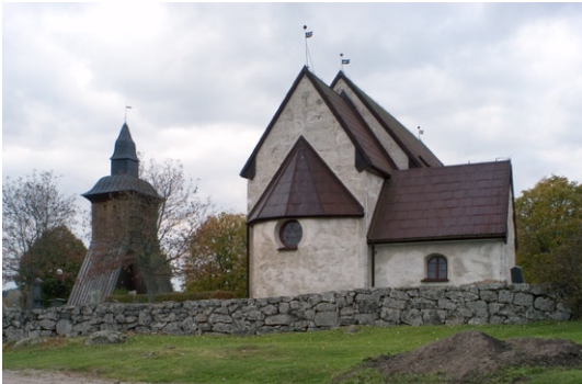
Kyrkan och klockstapel från öster.

Exteriört är kyrkan slätputsad och avfärgad i en vit kulör. I västgaveln finns tre höga, smala spetsbågiga blinderingar . Alla tak är sadeltak , med undantag för absidens halvkoniska form, och sedan 1977 klädda med cortenstål . Detta har även använts till vindskivor, hängrännor, stuprör och fönsterbleck. Kyrktaket har tre flöjlar med årtalen 1887, 1687 samt 1812.