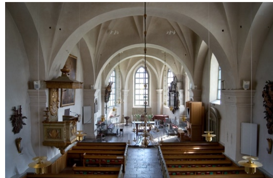
Interiör av koret i öster.

Kyrkan försågs med en orgel 1837. Orgelfasaden samt läktaren utfördes efter ritningar av C G Blom Carlsson, men läktaren utvidgades vid 1900-talets mitt. Nuvarande orgelverk tillverkades 1970 av Marcussen & Søn, Aabenraa,