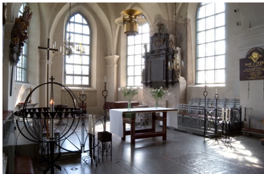
Interiör av koret i öster.