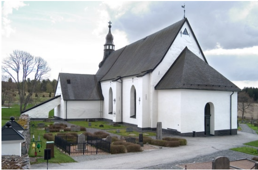
Exteriör från nordväst och bogårdsmur i norr.

ornets bottenvåning. Tornet revs dock 1750 medan bottenvåningen och vapenhuset fick stå kvar. Vapenhuset täcks av ett valmat yttertak och är, liksom långhusets tak, täckt med skiffer. Den rundbågiga portalen är i övre delen försedd med ett fönster. Dubbelporten till vapenhuset är dekorerad av beslag från 1400-talet, dock renoverade och kompletterade.