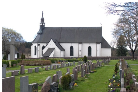
Norrfasaden med sakristian.

Kyrkans huvudentré går via vapenhuset i väster. Det inrättades 1705 i det medeltida väst-