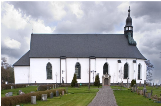
Sydfasaden med gravkor i öster.

Sakristian, som tillkom under 1400-talet, är belägen i norr. Röstet är dekorerat med en ornering som har stora likheter med orneringen på Uppsala domkyrkas torn, varför sakristian kan