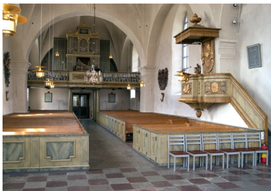
Interiör av långhuset med orgelläktare i väster och predikstol i norr.

Danmark. Orgeln har 38 stämmor. Sedan 1979 finns en kororgel från Richard Jacoby Orgelverkstad i Stockholm.