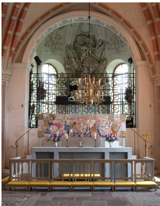
Altare och det Bielkenstiernska gravkoret från väster.