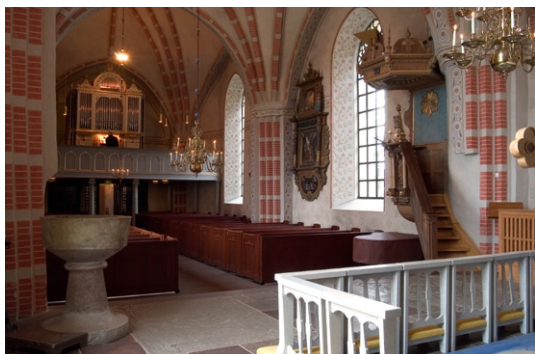
Kyrkorummet från sydöst.