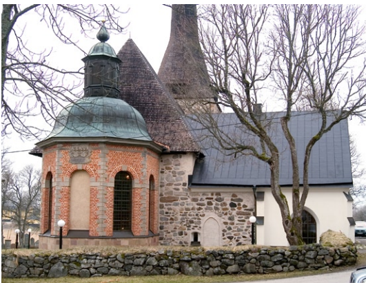
Kyrkobyggnaden från nordöst.

Vapenhuset är putsat med cementblandning med kvastad yta, troligen från 1950-talet. Det