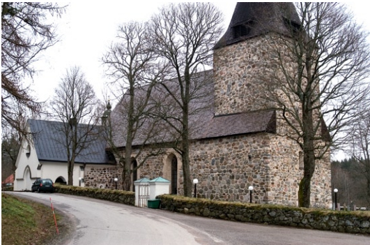
Kyrkobyggnaden från nordväst.