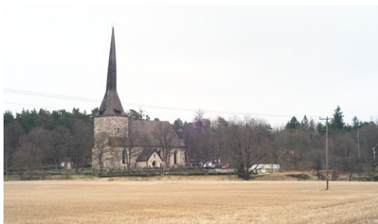
Kyrkobyggnaden från sydväst.

Ett svagt kuperat odlingslandskap uppbrutet av skogsklädda höjdparter sträcker sig mellan Österhaninge kyrka och gårdarna Husby och Kalsvik. I norr rinner två åar från Kalsvik och Alby och förenas till ett gemensamt flöde som passerar Husby på väg till sitt utlopp i Blista fjärd. Kyrkan, kyrkoherdebostället Solberga och de stora gårdarna Husby, Hässlingby och Kalsvik bildar den gamla kärnbygden i Österhaninge.