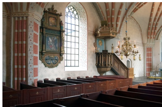
Kyrkans norra långhus vägg med predikstol och epitafium.

Dopfunten i kalksten är av enkel, odekorerad gotländsk typ från 1200-talet. Kyrkans huvudorgel är tillverkad av Åkerman & Lund Orgelbyggeri, Knivsta 1973 och har 25 stämmor. I tornet hänger två klockor, båda gjutna 1903. De tidigare klockorna fanns i en stapel öster om kyrkan, men de smalt när stapeln brann 1903.