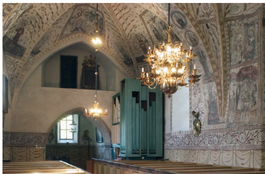
Kyrkorummet åt väst.

Sakristian härrör från 1300-talets början, då kyrkan byggdes om till salkyrka. Det vitkalkade kryssvalvet med ribbor är samtida. Golvet av