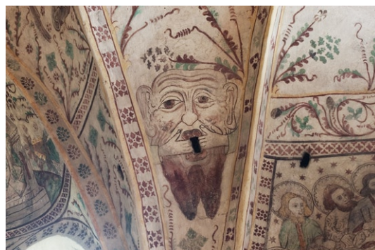
S k skvallerhål. Detalj av kyrkorummets kalkmålningar.

Kyrkorummet och vapenhusets kalkmålningar dateras till senast 1470-talet. Målningarna kalkades över 1687. Vid 1902 års restaurering togs kalkmålningarna åter fram varvid de kompletterades och övermålades hårt. Målningarna är inspirerade av tiggarmunkarnas predikningar och framställer figurala scener omgivna av rik ornamentala dekoration. Långhusets valv är försedda med flera sk ”skvallerhål”, dvs ett hål i valvet som ska ”skvallra” om ett läckage skulle uppkomma i taket. Vapenhusets målningar framställer de 15 tecken som ansågs förbåda världens undergång, en i Norden sällsynt serie.