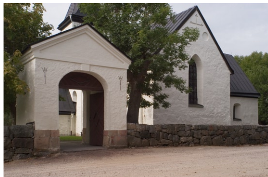
Östra stigluckan med bogårdsmur och kyrkans kor och sakristia i bakgrunden.

Klockstapeln från 1950 ligger på en liten höjd öster om kyrkan utanför bogårdsmuren , på platsen för den gamla stapeln som brann 1949. Den är uppförd efter ritningar av konstnären I Anderson och arkitekt B Schill och är en öppen, tjärad klockbock som täcks av en spånklädd huv av sadeltaksmodell . Klockorna härrör från den gamla stapeln och är gjutna 1660, troligen av klockgjutaren Johan Meyer i Stockholm.