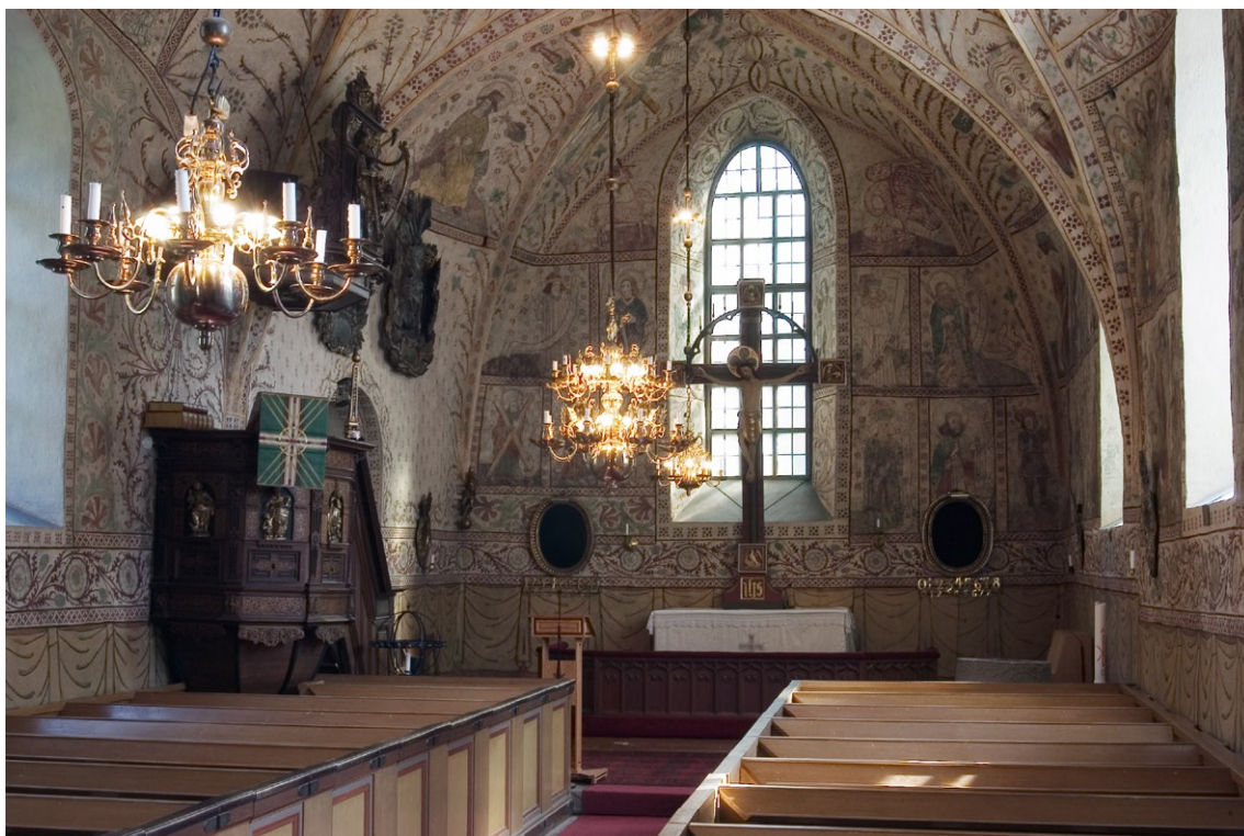
Kyrkorummet åt öst.

Kyrkans läktare avlägsnades 1964. Den sena 1700-talsorgeln flyttades till Skå kyrka och ersattes av en ny orgel med 14 stämmor, byggd av Grönlunds Orgelbyggeri. Den har en blågrön lasyr och är placerad på golvet längst bak i det norra bänkkvarteret. Öppningen i västmuren över ringkammaren är upptagen 1902 för att ge plats åt den gamla orgelns bälg.