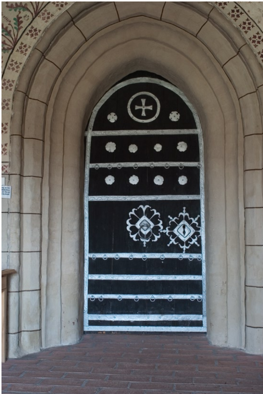
Den medeltida vapenhusdörren med silverfärgade beslag.

brädor är omlagt och sänkt 1902, då en källare under sakristian inrättades till pannrum och försågs med betongvalv. Ingången är rundbågig och försedd med en bräddörr med medeltida nyckelskylt och ring.