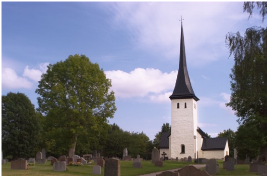
Exteriör från väst.