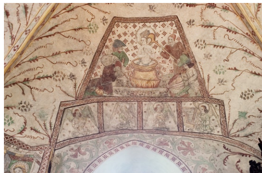
Kalkmålning i östra långhusvalvets norra sida.