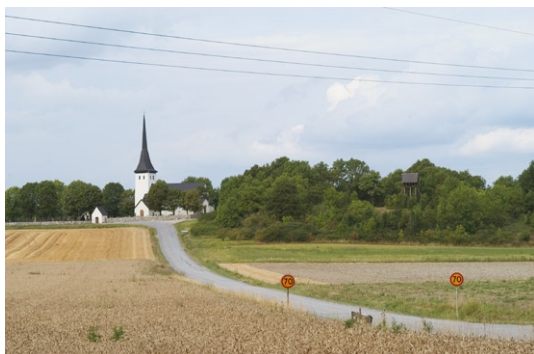
Exteriör från söder.

Kyrkogårdens kallmurade gråstensmur är tillkommen i flera etapper. Ursprungligen var den troligen murad i bruk, putsad och täckt av en trähuv. Den äldsta delen av kyrkogården intill kyrkan har utvidgats åt väster 1832 och 1919. En trädkrans av hamlade lindar och askar utmärker den äldsta delen av kyrkogården medan den yngre delen är planterad med björkar. Ett par av träden i den äldre trädkransen härrör troligen från en trädplantering som gjordes 1846.