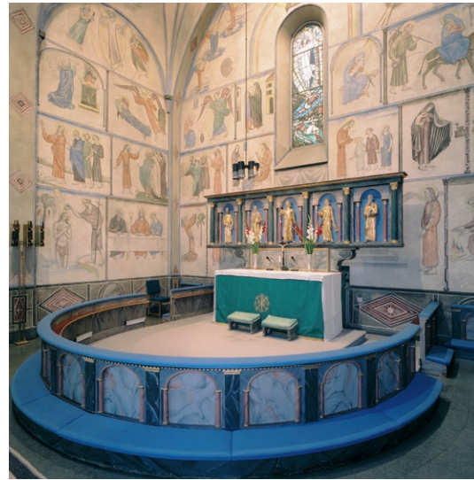
Koret. Vägmmålningar, korfönster © OLLE HJORTZBERG/BUS 2008

Koret, som nås via trappsteg i kalksten, är något smalare än långhuset och rakt avslutat i söder. Väg- och valvmålningar är liksom triumfbågen dekormålade, de figurativa delarna är