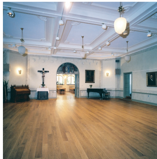
Samlingssal i kyrkans bottenvåning.