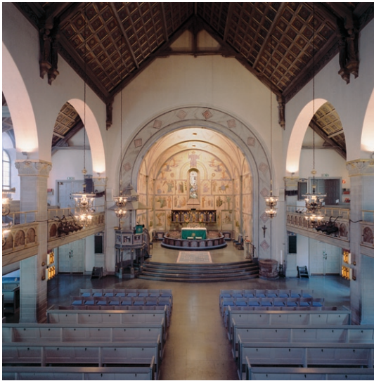
Kyrkorummet från orgelläktaren mot koret.

infattat, tonat glas. De öppna bänkkvarteren är indelade av mittgång och under läktarna av sidogångar. Bänkarna är gråmålade med en mörkare marmorerad fyllning på gavlarna. De främre tre raderna är borttagna och ersatta med lösa stolar.