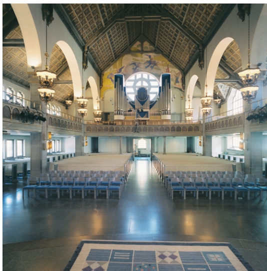
Kyrkorummet mot orgelläktaren.