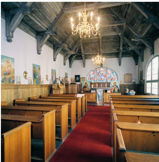
Kapellinteriör mot koret.

I kyrkobyggnadens bottenvåning ligger den stora samlingsalen med oljat ekgolv, putsade och målade väggar med marmorerad bröstning och ett tak indelat av kraftiga bjälkar med profilerade lister. Vid ett marmorerat altare står ett krucifix av trä. Ett dörröverstycke har en målning utförd av Olle Hjortzberg. Fönstren har spröjsade träbågar, vissa med espanjletter .