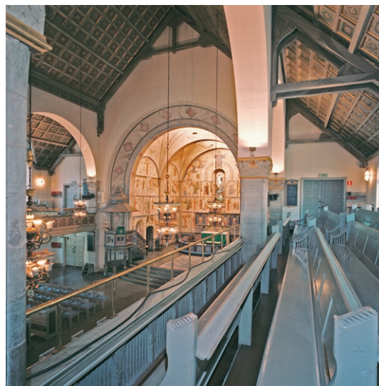
Västra läktaren mot koret.

1972 och är byggd av Marcussen & Søn med 52 stämmor. Det gradänguppbyggda golvet är belagt sekundärt med ekparkett. Den norra väggen är prydd med en väggmålning kring det stora runda fönstret, utförd av Olle Hjortzberg under 1940-talet. Två ljuskronor av samma typ som i mittskeppet men mindre hänger över denna del av läktaren. Framför orgeln hänger 12 sekundära cylindriska armaturer.