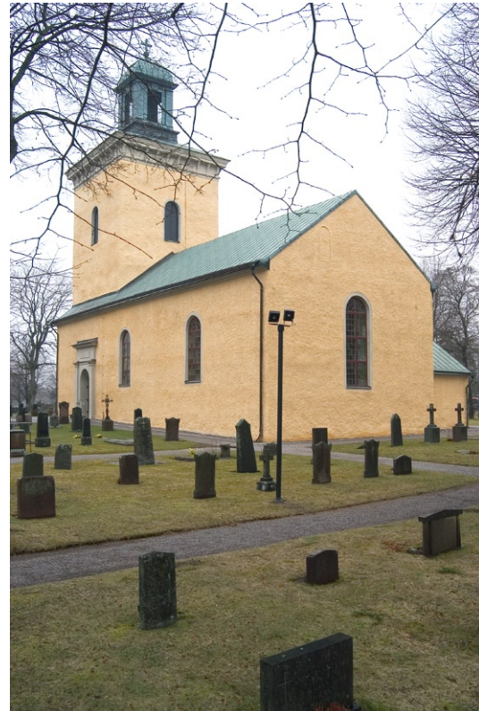
Exteriör från sydöst.