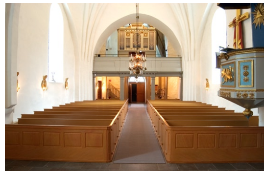
Interiör från öster.