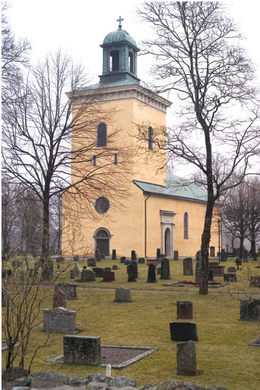
Exteriör från sydväst.

De spritputsade fasaderna är avfärgade med ljus ockragul kalkfärg. Fönstersmygar, portalomfattningar och takfotslistor är slätputsade och avfärgade i ljusgrått. Tornets västgavel har ett säreget utseende med två ”höfter”. Tornen i grannkyrkorna, Österhaninge och Brännkyrka har haft liknande höfter, som förekom under