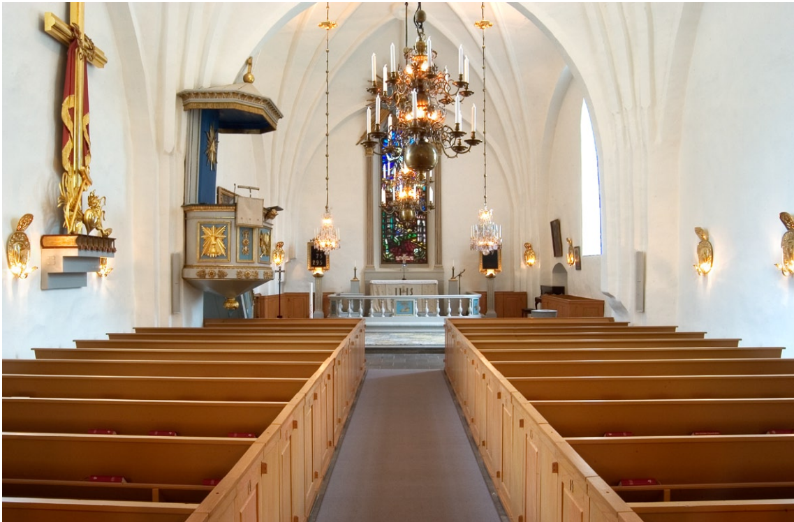
Interiör från väster.