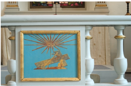
Konsoler och utsmyckning på altarringen.