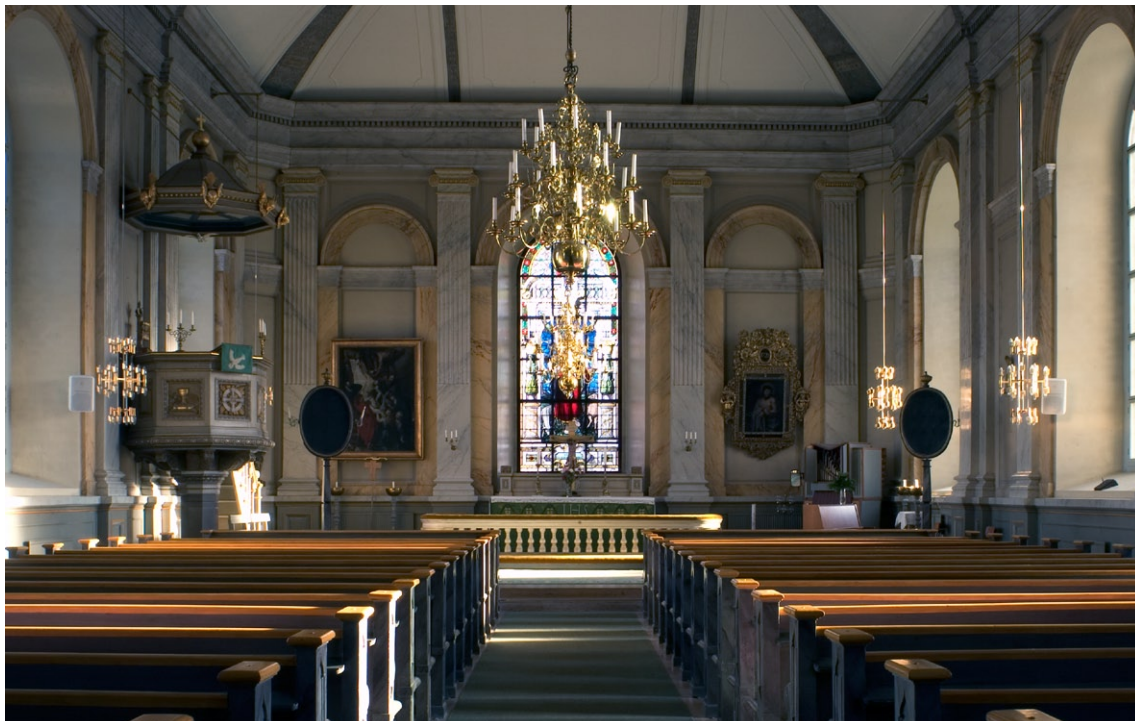
Interiör mot koret i öster.

Kyrkorummet täcks av ett relativt flackt tunnvalv utsmyckat med dekorativa ramverk. Läktaren i väster uppfördes i samband med renoveringen 1897. Nuvarande orgel och orgelfasad tillkom dock först 1909. Orgeln, som har 21