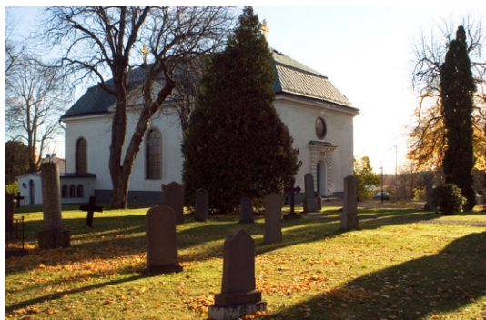
Exteriör från nordväst.

På kyrkogården finns ett gravkor , uppfört