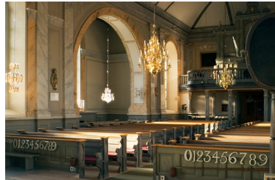
Interiör mot sydväst.

Kyrkorummets väggar är strängt rytmiskt och arkitektoniskt indelade av de höga, rundbågiga fönstren och de däremellan stående pilastrarna , krönta av joniska kapital . Mellan dessa finns i sin tur blindbågar. Arkitekturelementen i trä är marmorerade. De rundbågiga fönstren i tvärskeppens armar liksom östgavelns målade glasfönster kom till i samband med en större renovering 1896 under ledning av Johan Laurentz. Centralmotivet i glasmålningarna är Kristus som Den gode herden, inramad av ornament i nyrenässansstil .