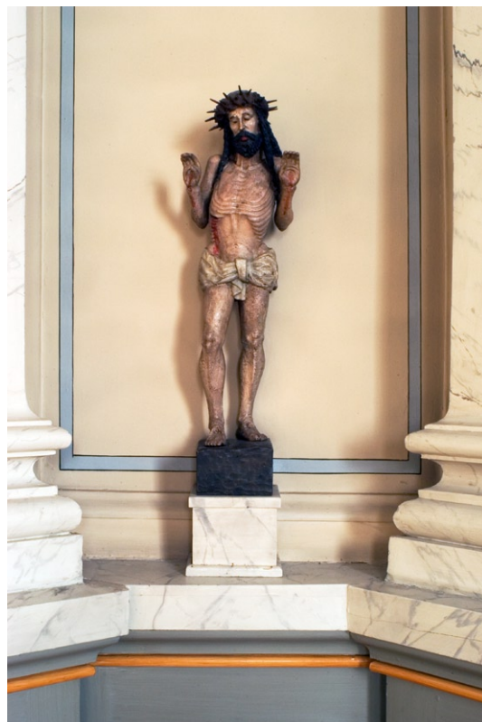
Målad träskulptur av Kristus som smärtomannen, troligen 1600-tal.

På altaret står ett krucifix, troligen från senare delen av 1700-talet och mot södra långväggen står en skulptur av Kristus som smärtomannen. Skulpturen härrör troligtvis från 1600-talet och