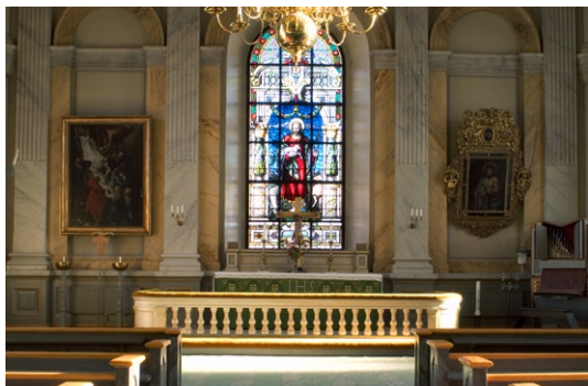
Interiör mot koret med glasmålning från 1890-talet.

Kyrkorummet har två bänkkvarter på vardera sidan om en mittgång. Bänkinredningen kom till under den stora renoveringen 1896–1897. De öppna bänkarnas gavlar är inspirerade av nyrenässansens formspråk och är marmorerade i en grå färg. I samband med att koret byggts ut, har några bänkrader avlägsnats i kyrkans främre