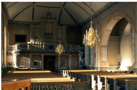
Interiör mot orgelläktaren i väster.

stämmor och är tillverkad av Setterquist & Son, Örebro, är ännu bevarad om dock renoverad under 1960-talet. 1978 tillkom en kororgel med 7 stämmor. I samband med en invändig upprustning 1967–68 inrättades väntrum, kapprum och wc under orgelläktaren. Samtidigt ändrades belysningen.