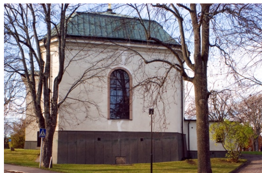
Exteriör från öster.

Kyrkan är uppförd i nyklassicistisk stil med putsade fasader, avfärgade i vitt. Fasaderna är mycket strikta och den enda dekoration fasaderna har är rusticeringen kring entrén, de markerade gavelröstena samt den profilerade takfoten. De rundbågiga fönstren försågs med nya omfattningar i samband med en renovering under 1960-talet. Taket, som är brutet och med val-