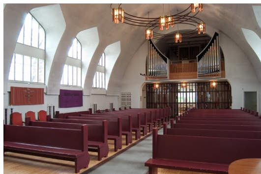
Kyrkorummet från öster.

tats från östra till västra sidan. Altaret som även det är från 1965, står på ett fundament av likaså mörkröd kalksten. Altarskivan av ljus furu vilar på tre konsoler.