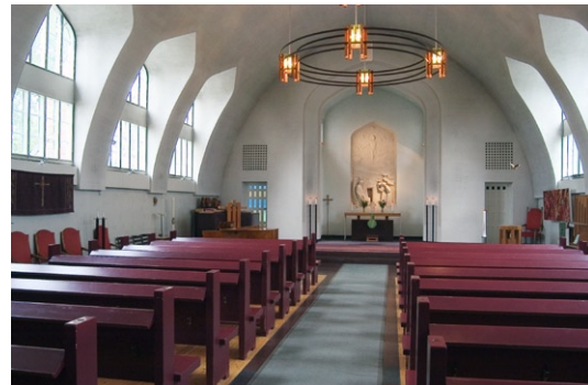
Kyrkorummet från väster.

Jugend karaktären i kyrkorummet har raderats ut vid två restaureringar. 1937 kläddes den