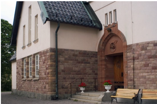
Kyrkans entréportal av röd sandsten.

Kyrkans sockel består av huggna granitblock varpå en murgördel av rödaktig grovhuggen granit står. Kraftiga strävpelare av likaså röd granit ramar in de höga fönstren på vardera långhus -väggen. I övrigt är fasaderna slätputsade och vita. Långhusets fönsteröppningar har en karakteristisk bred, spetsbågig jugendform och är avdelade på höjden. De småspröjsade bågar är vitmålade. Från sakristian är en glasvägg mot norr. Kyrkans entréportal är belägen i klocktornets bottenvåning. Till portalen leder en trappa och ramp i granit. Entréportalen av röd sandsten med en knoppliknande överdel kröns av tre smala fönster. I tympanon finns en huggen relief, som föreställer en duva med en olivkvist i näbben. Portarna i ljus ek och med handsmidda järnbeslag är upptill dekorerade med skurna bildreliefer föreställande en uppslagen bibel och en kalk omgiven av en lagerkrans respektive en rosenprydd törnekrans. Kyrkan har ytterligare tre dörröppningar vilka leder till sakristian , skrudkammaren