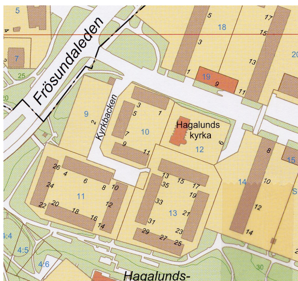
Situationsplan. Solna stads översiktskarta 2005.