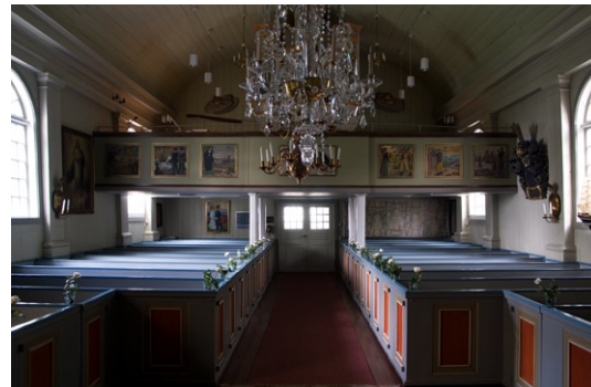
Interiör mot entré och orgelläktare i sydväst.

lens marmorering togs fram och retuscherades. Trappbarriären nyttillverkades och målades. I kor ets trägolv finns tre gravhällar infällda, den äldsta från 1600-talet över tullinspektören och