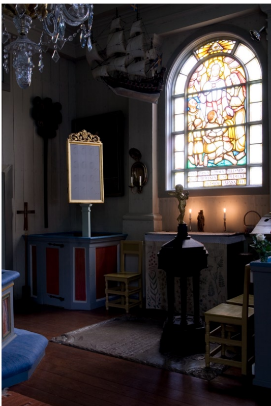
Interiör med glasmålning över sidoaltare i sydost, votivskepp .