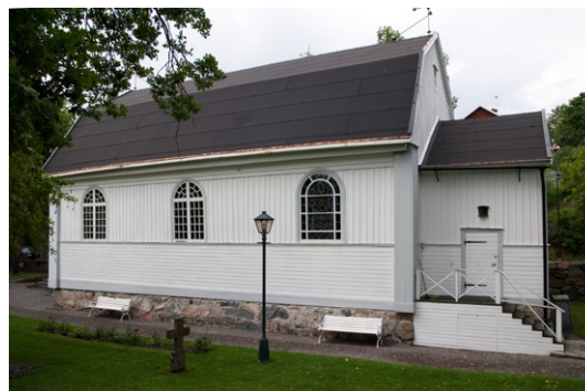
Exteriör från sydost.

Över en oregelbunden, fogad stengrund är väg-garna klädda med liggande brädfodring upp till fönstren, däröver med stående locklistpanel .