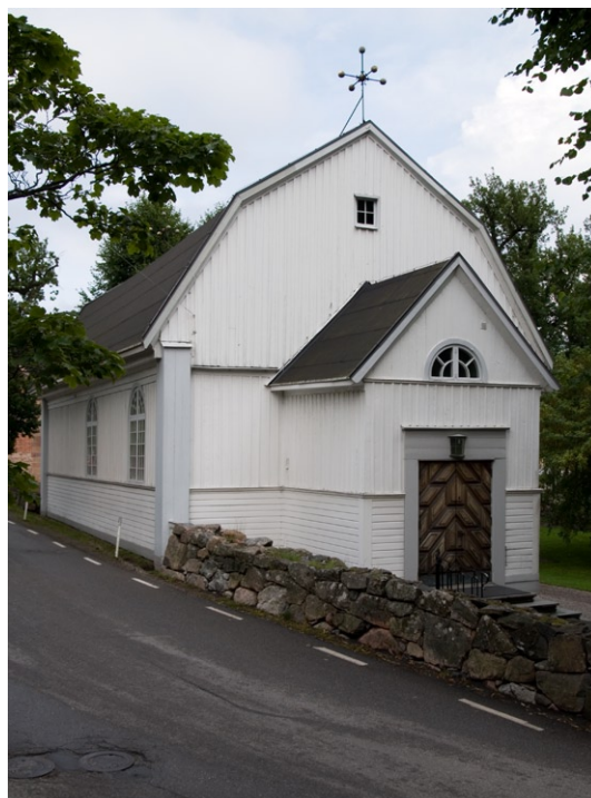
Bogårdsmur mot vägen.

Kyrkogårdens gränser har justerats något i förhållande till kartan från 1740. Den inhägnas av en låg stenmur som tillsammans med kyrkan bildar gräns mot vägen, vars vägbanan ligger högre än kyrkogården. Utanför muren står en mycket gammal ek som i folkmun kallas ”kunskaps-eken”, eftersom den använts som affischplats. På kyrkogården står ytterligare en gammal ek. Det sägs att kapellet byggdes i en ekbacke, möjligen kan träden vara en rest från denna. Flera lindar av okänd ålder flankerar kyrkogårdens två ingångar. Fyra på den sydöstra sidan och två på den nordvästra. Lindarna, troligen planterade i slutet av 1700-talet eller början av 1800-talet, har nyligen åter hamlats efter ett uppehåll på 30