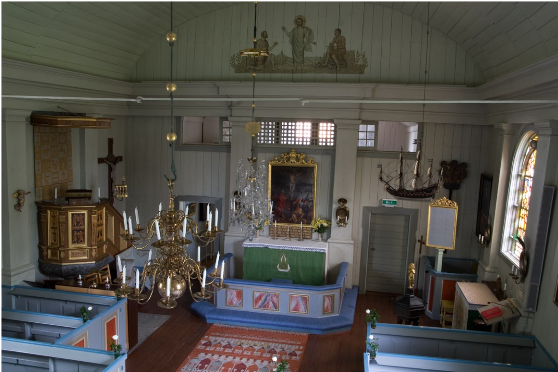
Interiör mot kor et och herrskapsläktaren i nordost.

därunder liksom altarringen med släta fyllningar, marmorerade i rött, grått och vitt samt två altarpallar, ritade av arkitekt Einar Lundberg. Intill predikstolen på norra väggen hänger kyrkans äldsta altartavla från 1654 med en framställning av nattvarden och givarnas porträtt infällda i ramen.