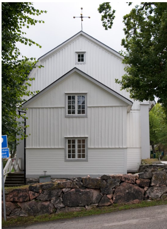
Exteriör från nordost.

nen, ligger för närvarande enbart papp på långhusets tak i väntan på beslut om lämpligt tak-täckningsmaterial. Kyrkans entrédörr har rusticerad ekpanel, sakristians dörr har liggande målade brädpanel.