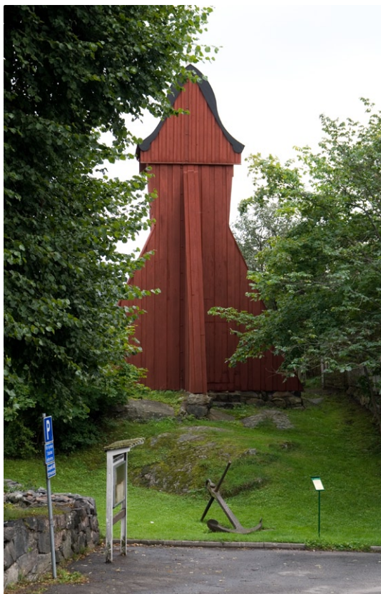
Klockstapel på berget söder om kyrkan.