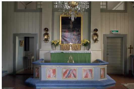
Interiör mot koret med herrskapsläktaren.

Mot korväggen är ett målat altare av trä placerat. Över det hänger en altartavla från 1700-talets första hälft som föreställer Kristus på korset, en oljemålning på duk med förgylld ram, krönt av änglar och sol med treenighetssymbol . Vid restaureringen 1936 tillkom inskriftstavlan