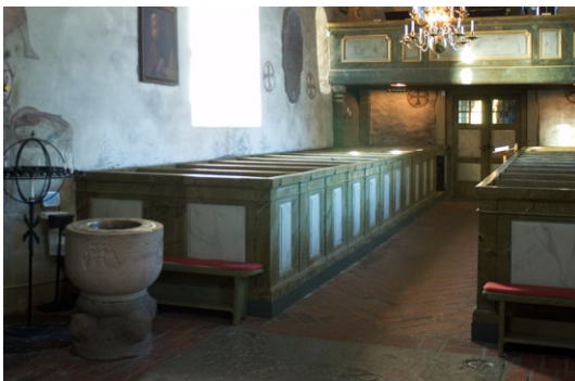
Kyrkorummet mot väster med dopfunten i förgrunden.

Orgelläktaren uppfördes redan under 1700-talet. I samband med renoveringen 1917–18 byggdes dock läktaren om och dess framskjutande sidopartier avlägsnades. Förutom orgelläktaren tillkom även kyrkans övriga fasta inredning under renoveringen 1768–69. På vardera sidan om mittgången finns två slutna bänkkvarter. Bänkarna justerades något i samband med renoveringen 1917–18. I koret finns två korbänkar som flankerar altarpredikstolen mot norr och söder. De två smäckra nummer-tavlorna som är fästade på korbänkarna skänktes till kyrkan i samband med att orgeln sattes upp 1817.