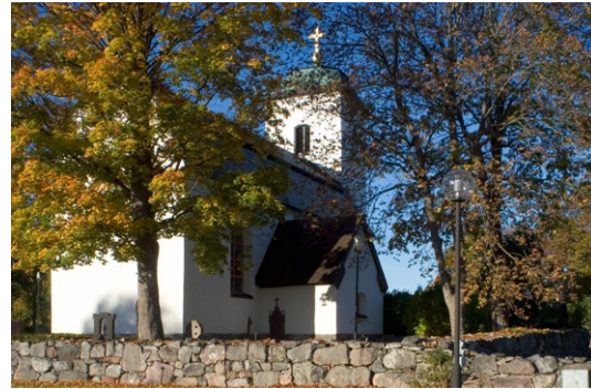
Kyrkogård och bogårdsmur från nordost.

norra av de två fönstren är dock endast öppnat inåt. Det södra, som är helt upptaget, hade tidigare samma utförande som det norra, men förändrades under gotiken till en mer tidstypisk form.