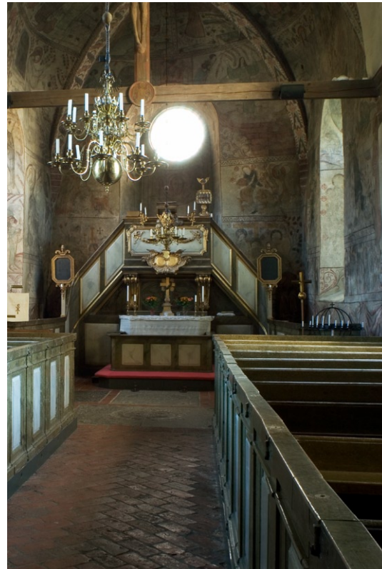
Kyrkorummet mot koret i öster.

Altarpredikstolen har ritats av slottsarkitekten Jean Eric Rehn och är utförd enligt tidens moderna och klassicistiska manér, liksom bänkarna. Altarpredikstolens mitt är rikt utsmyckad med dekorerade lister, en festong samt en kartusch . Arrangemanget kröns av en kerub . Visuellt bärs konstruktionen upp av två kraftiga och förgyllda konsoler.