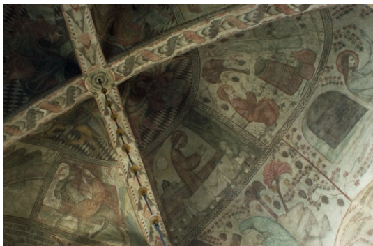
Valv med kalkmålningar av Olle Hjortzberg.

År 1917–18 renoverades kyrkan under ledning av Sigurd Curman, sedermera riksantikvarie. Curman tog åter fram väggarnas medeltida kalkmåleri. Då måleriet saknades i valvet, kompletterades det med nya målningar av Olle Hjortzberg (1872–1959). Färg och motivval ansluter till de medeltida målningarna, även om växtornamentiken utförts på ett för Hjortzberg typisk maner. I samband med renoveringen 1917–18 försågs korets fönster med glasmål-