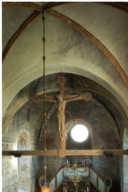
Koret med altarpredikstol samt triumfkrucifix i förgrunden.

ningar efter förslag av Olle Hjortzberg. Under samma renovering placerades ett triumfkrucifix i triumfbågen mellan koret och långhuset, enligt medeltida manér. Triumfkrucifixet tillverkades i Lübeck under 1460-talet. Armarna, mittpartiet, törnekronan samt korset utgör dock kompletteringar från 1918 av konservator Allan Nordblad.