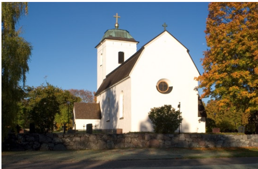
Exteriör från öster.

Kyrkan präglas huvudsakligen av restaureringen 1768–69, då den i stort fick sin nuvarande gestalt. Kyrkan har putsade fasader, avfärgade i vit kulör. Mot vardera långsidan vetter två högsträckta och rundbågiga fönster. Dessa, liksom rundfönstret på östra gaveln, kom till under renoveringen 1768. På långhusfasaderna västra del finns två mindre, romanska fönster, som togs fram i samband med restaureringen 1917. Det