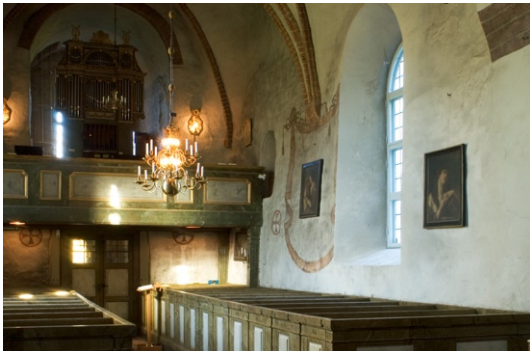
Kyrkorummet mot väster och orgelläktaren.

Orgelläktaren uppfördes redan under 1700-talet. I samband med renoveringen 1917–18 byggdes dock läktaren om och dess framskjutande sidopartier avlägsnades. Förutom orgelläktaren tillkom även kyrkans övriga fasta inredning under renoveringen 1768–69. På vardera sidan om mittgången finns två slutna bänkkvarter. Bänkarna justerades något i samband med renoveringen 1917–18. I koret finns två korbänkar som flankerar altarpredikstolen mot norr och söder. De två smäckra nummer-tavlorna som är fästade på korbänkarna skänktes till kyrkan i samband med att orgeln sattes upp 1817.