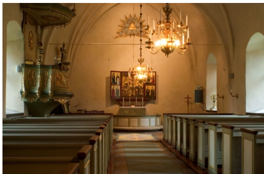
Interiör mot koret i öster.

Predikstolen i rokoko , som kröns av ett ljud-