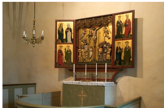
Medeltida altarskåp över altaret.

På altaret står ett altarskåp från 1400-talet, sannolikt med nordtyskt ursprung. Predellan är dock tillverkad under senare tid. I koret finns kyrkans dopfunt som härrör från 1100-talet, tillverkad av sandsten, sannolikt i norra Uppland. För övrigt smyckas koret med ett krucifix samt ett krön i form av ett Gudsöga , omgivet av strålar som tidigare utgjort en del av altar-