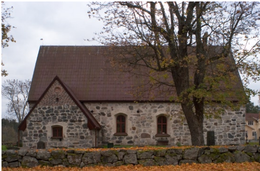
Fasad av långhus och sakristia mot norr.

In till kyrkan leder entrén via vapenhuset .