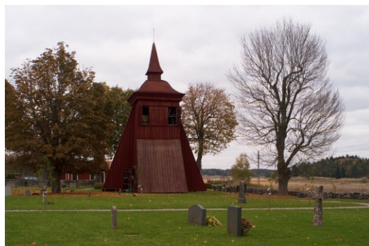
Klockstapel öster om Frösunda kyrka.

Invändigt är gravkapellets golv belagt med