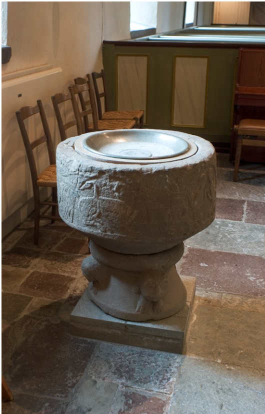
Medeltida dopfont i koret.

prydnaden från 1760-talet, även detta troligen utfört av Magnus Granlund. I koret hänger en liten mässingsljuskrona från slutet av medeltiden.