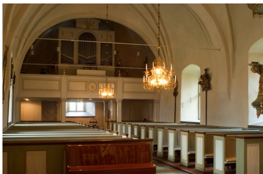
Interiör mot orgel och orgelläktare i väster.

novering. 1986 byggdes läktaren åter om och fick en rak barriär. Det nuvarande orgelverket, som har 18 stämmor, tillkom 1988 och tillverkades av A Magnussons orgelbyggeri, Mölnlycke. Orgelfasaden är från 1824.