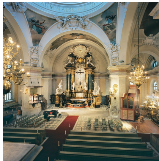
Kyrkorummet från orgelläktaren mot koret.

Väggarna i kyrkorummet är marmorerade i gult med pilastrar som är marmorerade i ljusgrått liksom de fyra murpelarna. Över pilastrarna löper en kraftigt profilerad list runt hela kyrkorummet. Ovanför listen är väggarna vita. På väggarna i korsarmarna följer ett listverk det tunnvälvda takets form och bryts högst upp av kartuscher . Liknande kartuscher , men med änglaskulpturer, finns bl a högst upp i korsmittens gördelbågar . Kupolen, tunnvalven och de välvda kapelltaken är dekormålade al fresco med bibliska motiv av konstnären Vicke Andrén (1856–