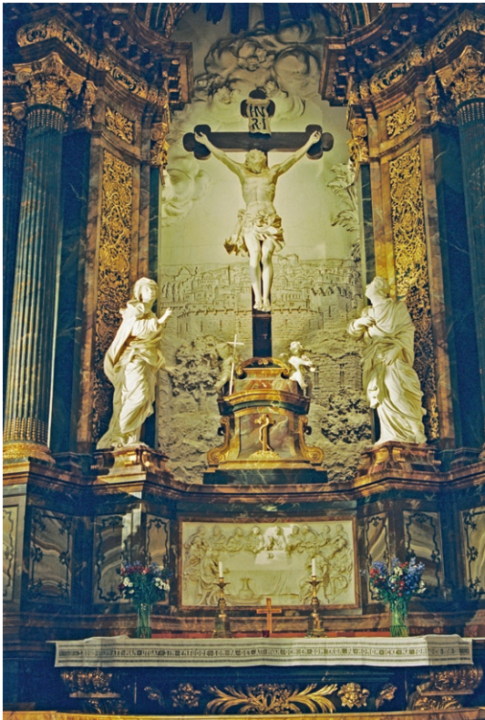
Altaruppsatsens mittparti. Stuckrelief