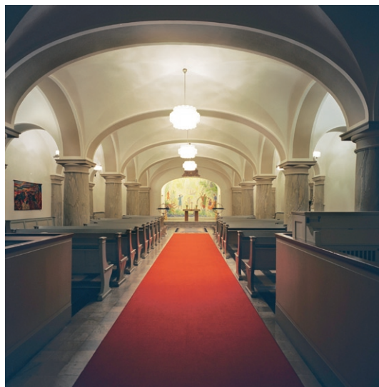
Den s k Lillkyrkan belägen under kyrkorummet.

Under kyrkan, med ingång från väster, leder två branta trappor ned till den s k Lillkyrkan, vilken byggdes som gravkapell samtidigt med kyrkan. Rummet är treskeppigt och orienterat i östvästlig riktning med kor i öster. Golvet är belagt med svart och vit marmor och väggarna putsade och vitmålade. Sex relativt låga kolonner, marmorerade i grågrönt, bär upp de flacka kryssvalven som täcker rummet. Bänkarna är målade i grått förutom gavlarna som är marmorerade i brungrått. Takarmatureerna som hänger i de treskeppen är sammansatta av små glaskupor. Ko-