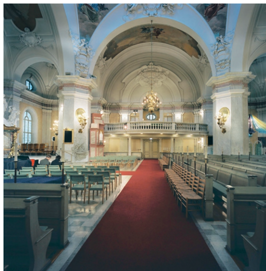
Kyrkorummet mot läktaren i norr.

Mot murpelaren i sydväst är predikstolen placerad, ritad av Agi Lindegren. Både trappa och korg är gjorda av rödbrun, polerad marmor, trappträcket är av förgyllt smidesjärn. Korgen har vit marmordekor i relief. Det flacka ljudtaket är av mörkbitsat trä. Dopfunten mot murpelaren i nordväst är gjord av vit marmor och skulpterad i form av två små änglar med en dopskål emellan sig. Konstnär var Sigrig Blomberg. Mot samma murpelare står en kororgel från 1992 tillverkad av Grönlunds Orgelbyggeri i