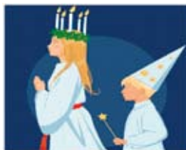
Lucia? Se Ärentuna kyrka 13 december!