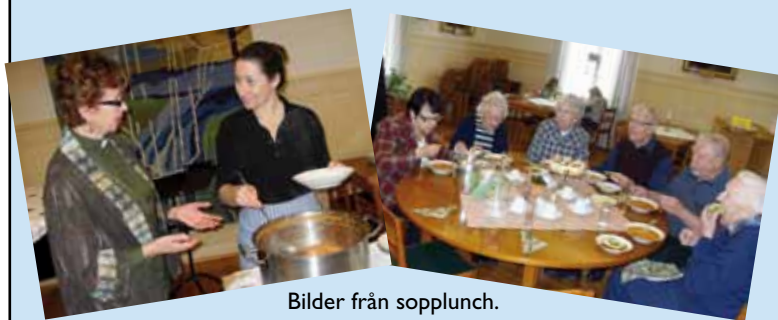
Bilder från sopplunch.