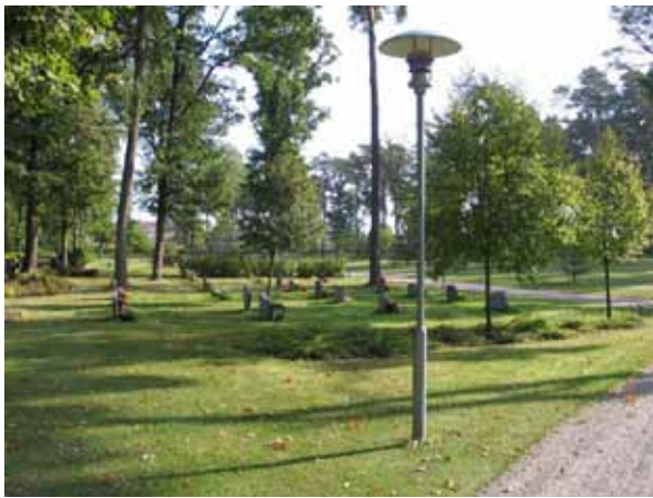
Ett av kvarteren för kistor i norra delen av området som anlades 1995. Kvarter 18 från väster. (KI Norra kyrkog 214)

gravplatser tagna i bruk. De är placerade utmed häcken mot kyrkogården och vända in mot öster.