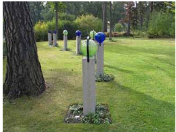
Ett av urngravsområdena med gemensam gravvård i kvarter 22. Vårdarna är granitpelare som kröns av glaskulor och svartmålade järnband. (KI Norra kyrkog 223)