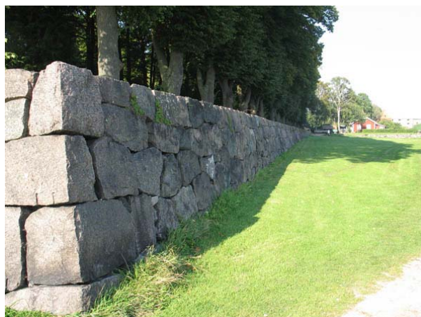
Kyrkogårdens mur i öster. (KI Södra kyrkog 500)