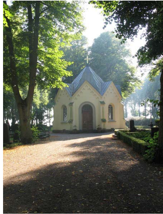
Gravkapellet i nygotisk stil ritades av Teodor Ankarsvärd. (KI Södra kyrkog 504)