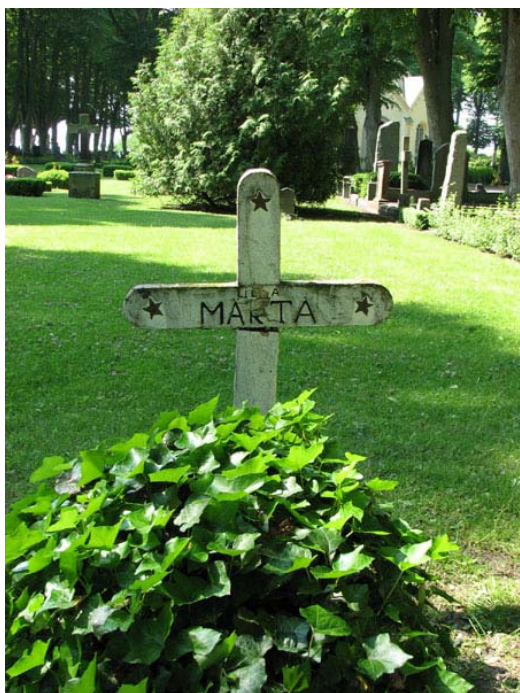
En av kyrkogårdens få bevarade trävårdar är Det här enkla korset med texten Märta. Framför korset en kulle överväxt med murgröna. Kvarter E (KI Södra kyrkog 124)