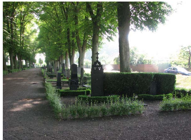
Kvarter C från norr. (KI Södra kyrkog 050)