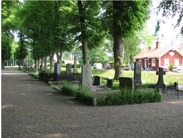
Kvarter F från söder. Till höger i bilden vaktmästeriet. (KI Södra kyrkog 152)

omgärdningar i form av gjutjärnsstaket, smidesstaket, stenramar, pollare och kätting i olika utföranden, rörformade räcken eller buxbomshäckar. Vid flera av gravplatserna är också buxbomshäckar planterade som avgränsningar av planteringsytor eller som dekoration. Det förekommer också växtlighet såsom rhododendron vid gravplatserna. Inom gravplatserna kan det finnas flera gravvårdar av olika ålder. Ofta visar det på familjegravplatser där olika generationer gravsatts men det finns också gravplatser som återanvänts. Man har då låtit den gamla vården stå kvar. Yrkestitlar anges på många av vårdarna i alla kvarteren. Flera personer har haft ledande befattningar. Här finns också många akademiker, militärer och näringsidkare av olika slag.