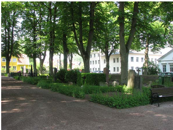
Kvarter B från sydväst. (KI Södra kyrkog 022)

De sju kvarteren utgör långsmala områden utmed kanterna kring den äldsta delen av kyrkogården. Utmed kyrkogårdsmuren i norr ligger kvarteren A och B, utmed muren i väster och gränsen mot området från 1889 ligger kvarteren C och L, i öster kvarteren F och G och i söder kvarter M. Kvarteren avgränsas på alla sidor av grusgångar. Majoriteten av gravvårdarna är vända mot en gång men det finns undantag t.ex. där gravplatsen går över hela kvarterets bredd. Kvarteren är i stort sett helt belagda med grus. Endast ett fåtal gravplatser är insådda med gräs. I kvarterens ytterkant är rader av lindar planterade.