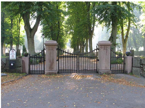
Kyrkogårdens ingång i norr har gjutjärnsgrindar. Dubbelgrindarna i mitten blev påkörda 1987 och ersattes med kopior från Gamleby Gjuteri AB. (KI Södra kyrkog 483)