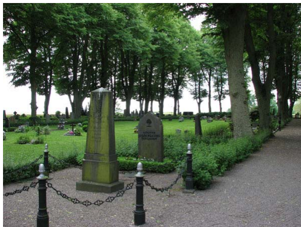
Kvarter H från nordväst. (KI Södra kyrkog 203)