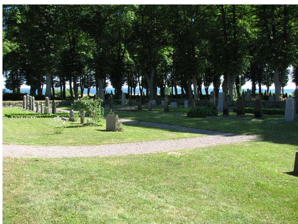
Mosaiska kyrkogården från nordväst. (KI Södra kyrkog 433)

kyrkogårdar i flera större städer t.ex. Malmö och Norrköping. I Kalmar län är mosaiska kyrkogården i Kalmar den enda i sitt slag. Mosaiska kyrkogården har brukats av flera judiska församlingar i sydöstra Götaland. Anläggandet av kyrkogården i Kalmar kan ses som ett tecken på den förändring i synen på olika religiösa samfund som Sverige, och flera andra länder, genomgick under 1800-talet. I slutet av 1800-talet blev det tillåtet att tillhöra andra religiösa samfund än Svenska kyrkan, men man var tvungen att tillhöra ett samfund. Först 1951 fick vi religionsfrihet i Sverige. Den Mosaiska kyrkogården i Kalmar utgör en del av stadens historia. Den vittnar om influenser och människor som kommit utifrån och slagit sig ner i staden och satt avtryck här. Kyrkogården bär också spår av världshändelser genom minnesvårderna över nazismens offer. Kyrkogården bör få behålla sin nuvarande utformning och gamla gravvårdar stå kvar så länge inte platserna behövs.