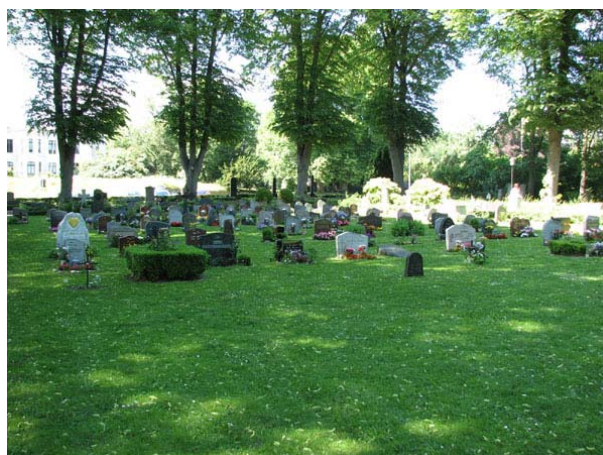
Linjegravsområdet i kvarter O har under senare år lagts om för urngravar. Bilden är tagen mot väster. (KI Södra kyrkog 411)