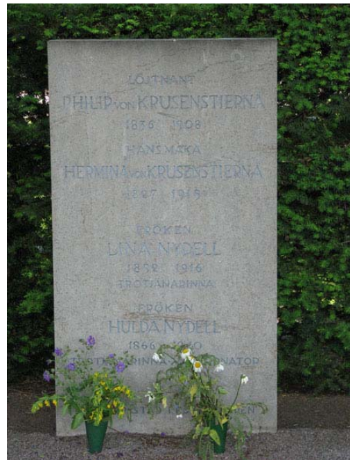
I kvarter 8U ligger bl a medlemmar av familjen Krusenstierna begravda. (KI Södra kyrkog 469)