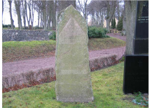
Kyrkogårdens upphovsman C J A Magnet ligger begravd i östra delen av kvarter A tillsammans med hustrun Emelie. De dog 1867 respektive 1885. Vården är en för tiden typisk hög sten i nationalromantisk stil med oslipade ytor och asymmetriskt krön. (KI Södra kyrkog IMG 8807)