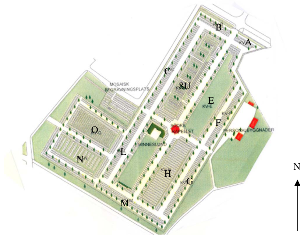
Karta över Södra kyrkogården