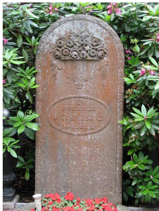
Bland rhododendron i norra delen av kvarter Minneslunden står hovjuvelerare Svensons Gravvård som dekorerats med en urna full av rosor. Kvarter Minneslunden. (KI Södra kyrkog 267)