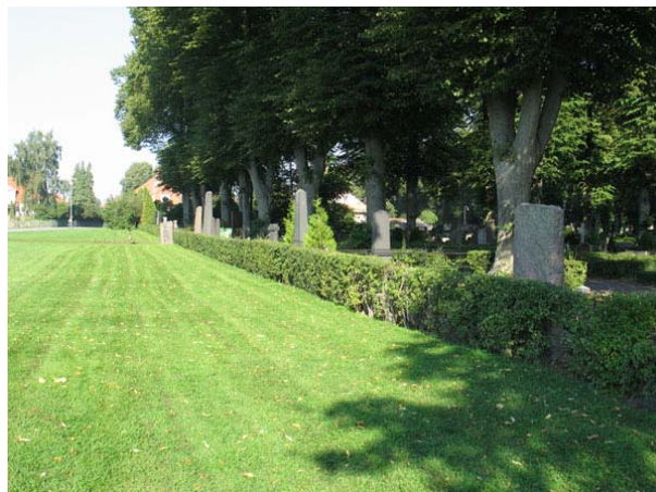
Hagtornshäcken som omgärdar kyrkogården i sydväst. (KI Södra kyrkog 497)