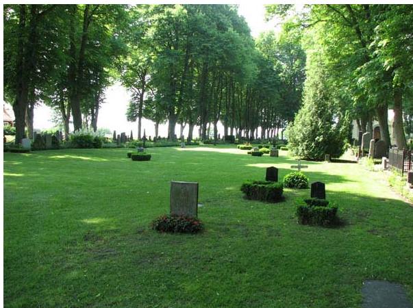
Linjegravsområdet i kvarter E från norr. (KI Södra kyrkog 120)

under 2000-talet. I kvarter Minneslunden finns endast två vårdar bevarade på linjegravsområdet. En stor del av ytan gjordes i mitten av 1970-talet om till minneslund.