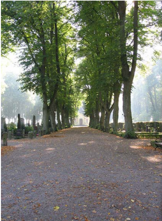
Från kyrkogårdens ingång i norr går en bred grusgång kantad av lindar. (KI Södra kyrkog 485)

På kyrkogården finns gravvårdar från 1860-talet fram till idag. Även när det gäller vårdarna märks det att detta är en stadskyrkogård. Det finns många påkostade stora vårdar och gravplatser.