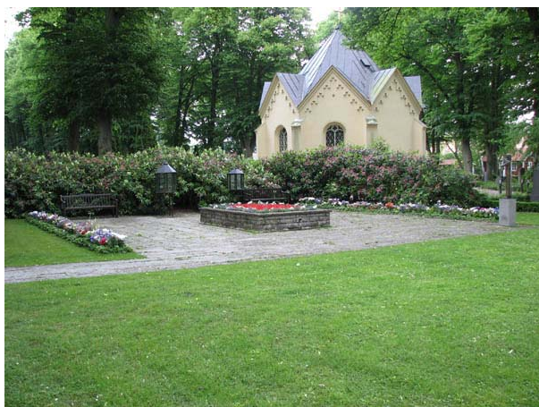
Minneslundan från söder. Till höger i bilden Tomas Qvarsebos bronsskulptur föreställande en flöjtspelande flicka. (KI Södra kyrkog 284)

De senaste två årtiondena har gravvårdarna gått mot en friare utformning. Formerna har blivit rundare och inte enhetligt rektangulära. Även dekoren har blivit mer varierande och personligare. Från mitten av 1800-talet fram till mitten av 1900-talet var det vanligt att ange den dödes yrkestitel på gravvården. Idag kan man visa sitt yrke eller intresse med en symbol på gravvården. Ett typiskt drag för stadskyrkogården är att man inte anger varifrån man kommer. På en landsortskyrkogård är detta mycket viktigt men på Södra kyrkogården finns det angivet endast på ett fåtal vårdar. Gravvårdarna är främst av grå eller svart granit men även röd förekommer. Utöver graniten finns ett mindre antal vårdar av kalksten, sandsten, marmor, smide, gjutjärn och trä. Det finns också ett antal gravkullar överväxta med murgröna. Flera av gravplatserna är familjegravar som använts under lång tid vilket gör att det inom samma gravplats kan finnas vårdar från olika tider.