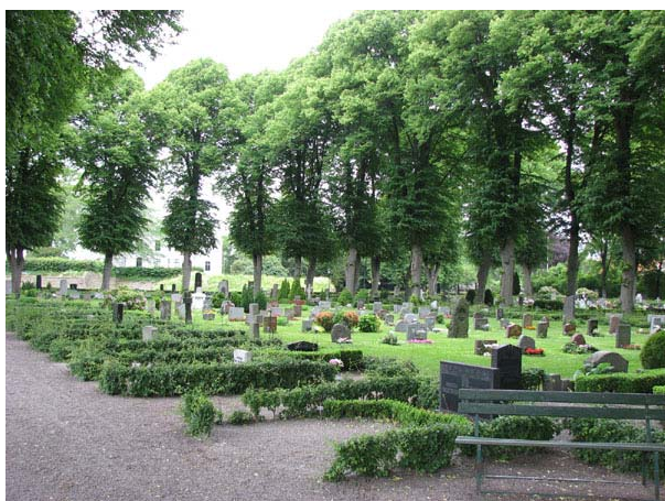
Kvarter N från sydost. (KI Södra kyrkog 343)

De båda kvarteren ligger i kyrkogårdens sydvästra del. Båda tillkom vid utvidgningen av kyrkogården 1889. Kvarteren består dels av rader av köpta gravplatser i områdets kanter mot söder, väster och norr, dels av var sin större yta utmed gången från kyrkogårdens västra ingång. Det är denna gång som delar utvidgningsområdet i två olika kvarter. De större ytorna omges i alla väderstreck av grusgångar som kantas av lindar. Dessa delar av kvarteren har samma struktur som kvarteren E, H, Minnelunden och 8U. Köpta gravplatser ligger i dess ytterkanter och i mitten har funnits linjegravsområden. Av dessa finns idag endast enstaka gravvårdar kvar. Flest linjevårdar finns i kvarter O. I de gamla linjegravsområdena har man istället påbörjat en omläggning. I kvarter N påbörjades denna 1975 och området är ordnat för kistgravplatser. Linjegravsområdet i kvarter O började läggas om 1995 och området planerades då för urnor. I stort sett samtliga köpta gravplatser är belagda med grus medan linjegravsområdena är insådda med gräs.