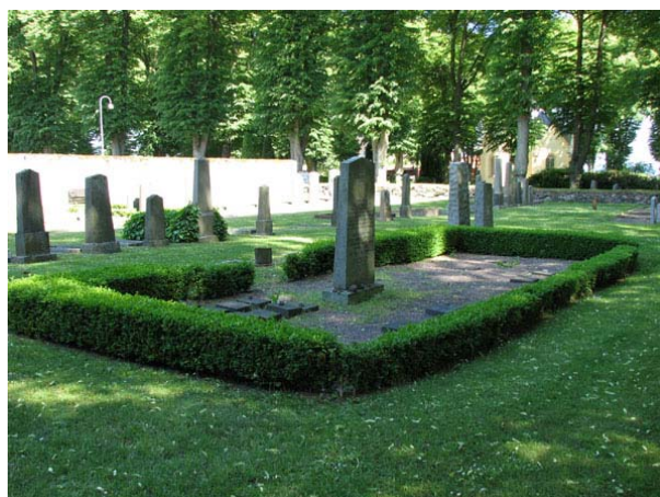
Mosaiska kyrkogården från sydväst. I förgrunden minnesvårderna över de koncentrationslägerfångar som dog i Kalmar 1945. Inom den buxbomsomgärdade gravplatsen ligger flera små vårdar med namn och data. (KI Södra kyrkog 446)