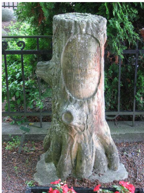
Vid sekelskiftet 1900 förekom gravvårdar i form av stubbar eller avhuggna trädstammar. På Södra kyrkogården finns t.ex. denna vård i kvarter E. (KI Södra kyrkog 086)

materialet som vårdarna är gjorda av men det finns även vårdar av röd granit, gjutjärn, sandsten, kalksten och trä. Trävårdarna utgörs av två träkors, det ena brunmålat och det andra vitmålat, på linjegravsområdet i kvarter E. Framför det vita träkorset finns också en gravkulle överväxt med murgröna. Fler av linjegravplatserna, med eller utan gravvård, har en rektangulär planteringsyta omgärdad av buxbomshäck. I det närmaste samtliga av de köpta gravplatserna är omgärdade. Vanligast är en låg häck av hagtorn eller måbär, men det finns också staket av smide eller gjutjärn, räcken, pollare och kätting i olika utföranden, häckar av buxbom eller idegran, stenramar, kantställda kalkstensskivor. En har en omgärdning av låg mur. Att ange den dödes yrkestitel är mycket vanligt i synnerhet på vårdarna i kvarter Minneslund. Titlarna är kopplade till akademiska yrken, militärer, handelsmän och hantverkare, affärsmän och sjöfart. Det förekommer även titlar på linjegravsområdenas vårdar. Den vanligaste titeln är sjökapten. Till de mera ovanliga titlarna hör stentryckare, sophiasyster, filosof och värnpliktsvägrare.