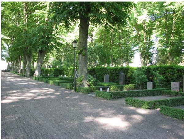
Kvarter 8U från sydväst. (KI Södra kyrkog 462)

Kvarter 8U har samma rektangulära form som kvarteren E, H och Minneslunden och precis som dessa kvarter anlades det med en tydlig skillnad mellan köpta och allmänna gravplatser. Linjegravsområdet i kvarter 8U började dock att läggas om 1958. Hela linjegravsområdet gjordes då till urnlund. Utmed linjegravsområdets östra sida anlades långsträckta rader i kvarterets längdriktning. Dessa följs av en gång belagd med kalkstensplattor. I vinkel med denna gång går dels ett par mindre gånger, dels rader med gravvårdar. Raderna med gravvårdar är avdelade i mindre områden som skiljs åt av planteringar av spirea och ölandstok. Gravvårdarna är ordnade så att alla vårdar i en rad är antingen liggande eller stående. Eftersom gravplatserna är anpassade för urnor är det relativt tätt mellan raderna. Hela urnlunden är insådd med gräs medan de köpta gravplatserna är belagda med grus. Gränsen mellan urnlunden och de köpta gravplatserna markeras av en hög idegränshäck som helt skyddar den inre delen av kvarteret från insyn.