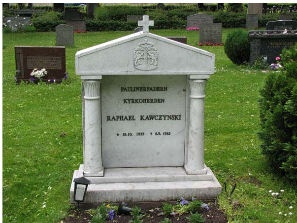
Linjegravsområdet i kvarter N började läggas om för kistgravplatser på 1970-talet. Här en påkostad marmorvård över paulinerfadern och kyrkoherden Raphael Kawczynski som dog 1882. (KI Södra kyrko 374)

De båda kvarteren tillkom i slutet av 1880-talet då kyrkogården utvidgades. Man valde dock att ge det nya området exakt samma struktur som den äldre delen av kyrkogården. Det gör att man idag uppfattar kyrkogården som en helhet. Det är bara en noggrann studie av kyrkogårdens gravvårdar som avslöjar att denna del är lite yngre. Liksom de tidigare beskrivna delarna av kyrkogården är det främst anläggningsformen som är viktig t.ex. den tydliga uppdelningen mellan olika typer av gravplatser. En omläggning av linjegravsområdena pågår men än idag finns spår av linjegravar från 1910-talet. Dessa spår är viktiga att värna. Hos flera av gravvårdarna finns hantverksmässiga, konsthistoriska eller lokal- och personhistoriska värden att värna. Gravvårdar av gjutjärn ska föras in på församlingens inventarieförteckning.