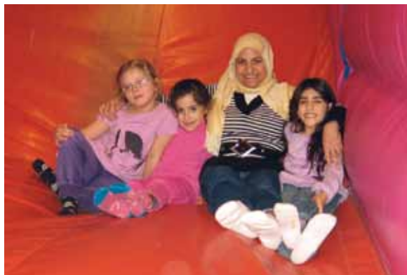
Resan till Busborgen i februari.