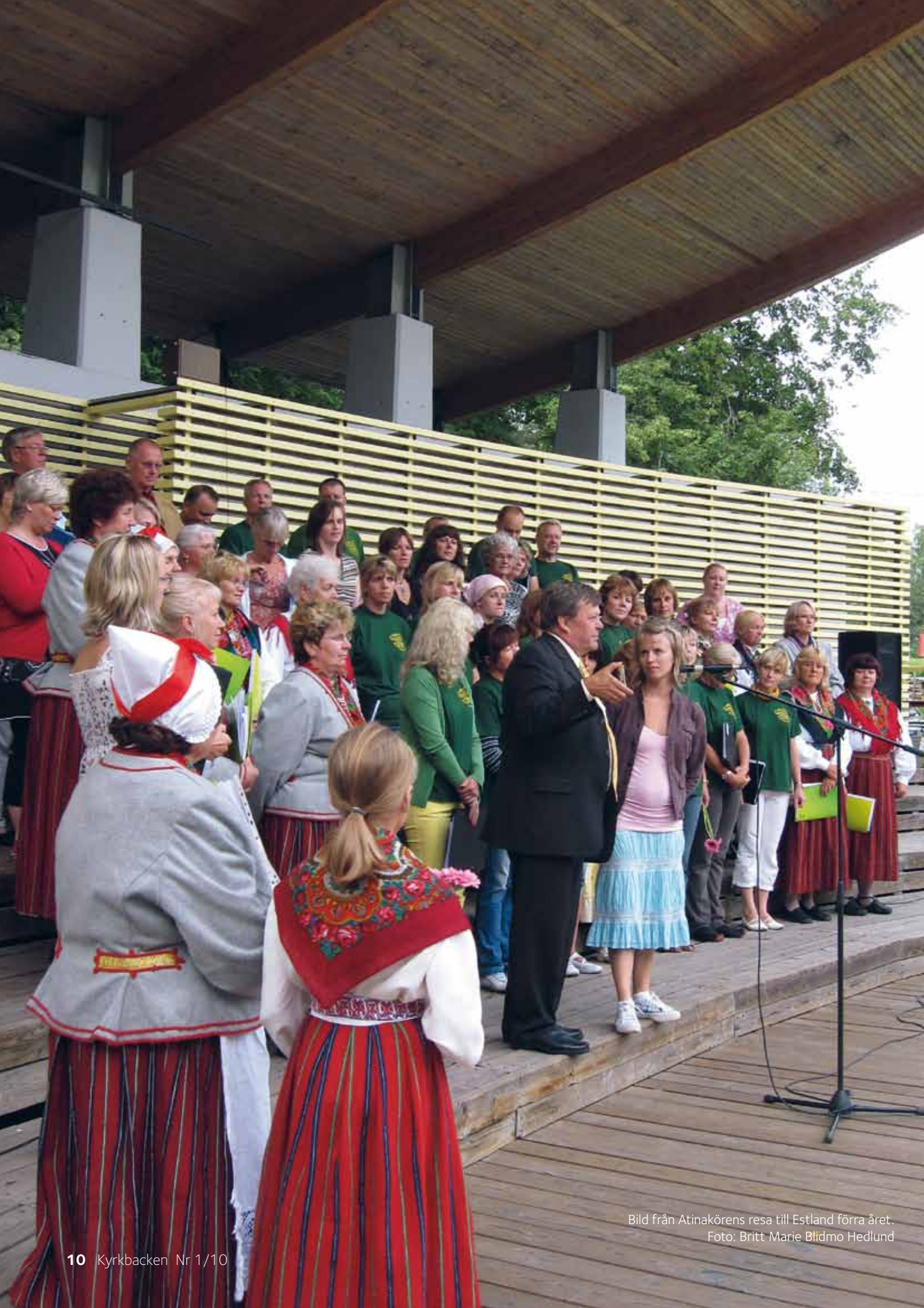
Bild från Atinakörens resa till Estland förra året.