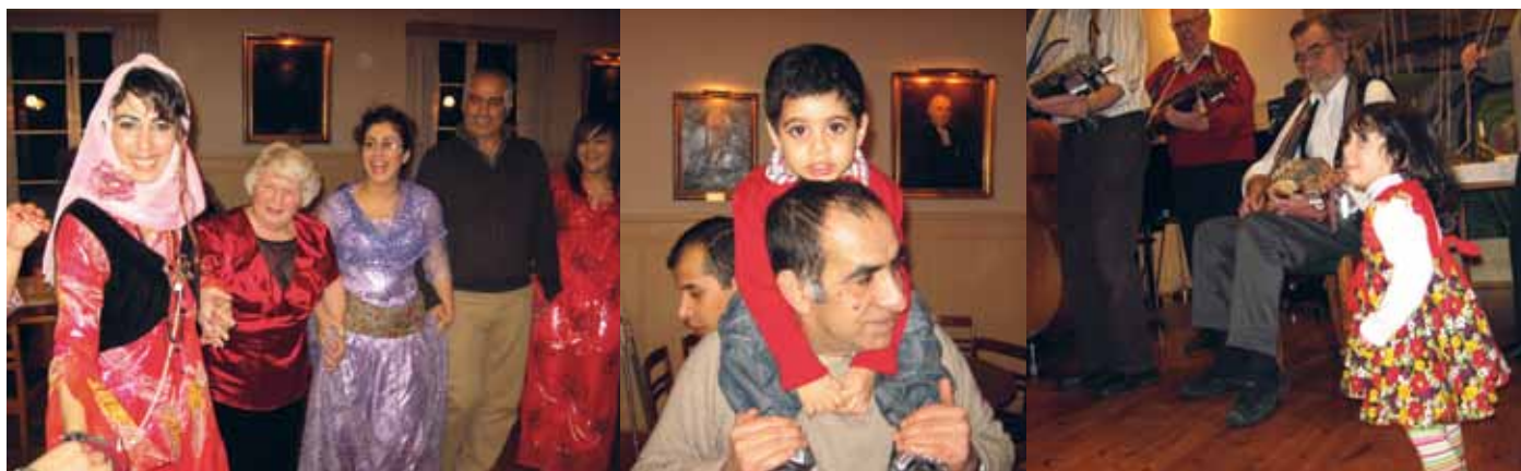
Knytkalas i Västerlövsta församlingshem i februari. Mat från olika kulturer blandat med sång och dans.