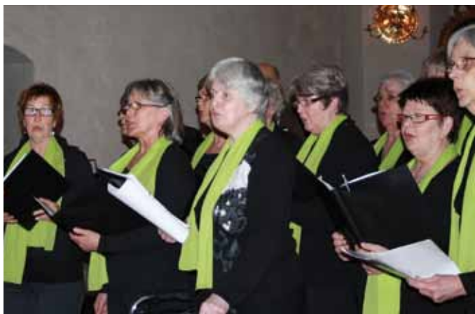
Kören Sångkraft, Vittinge

1,1 miljard människor saknar tillgång till rent vatten