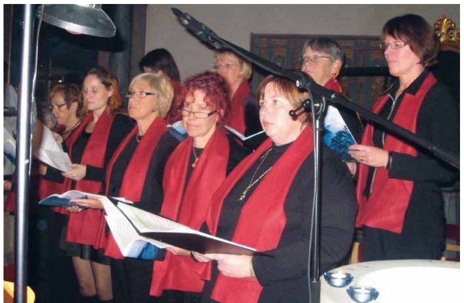
Huddunge kyrkokör vid "mässa i irländsk folkton" i höstas.