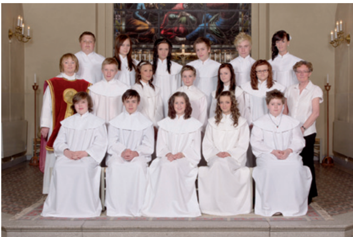
Konfirmation i Röke kyrka lördagen den 21 maj klockan 14.00.