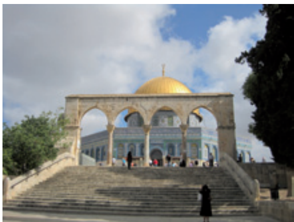
Tempelplatsen med Klippmoskén i bakgrunden.

Tempelplatsen med den välkända Klippmoskén var nästa dags första etapp på vår fortsatta vandring. Här är det arabiskt område så vi passerade en säkerhetskontroll för att komma in. Vi hade ”helig klädsel” det vill säga kläder som täcker axlar och knän. Helig klädsel hade man alltid på alla heliga platser. På tempelplatsen kan man se Moria berg gå i dagen. Tänk att det är samma berg som Abraham en gång gick på.