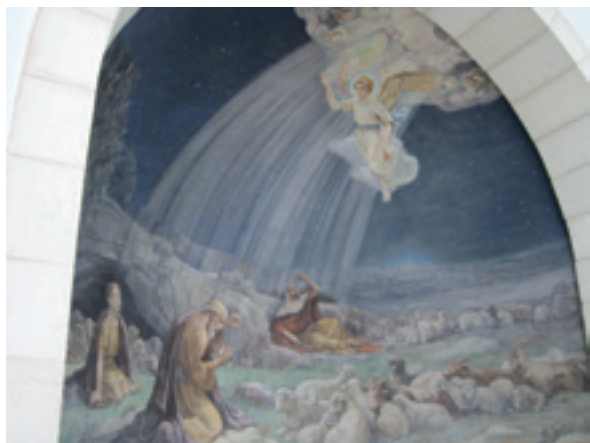
Målning från kyrkan vid Herdarnas äng i Betlehem.

I Betlehem satt vi invid ängarna som troligen ser ungefär likadana ut idag som när herdarna såg och hörde änglarna sjunga den där julnatten. Det var en märklig känsla. Vi var också i födelsekyrkan och födelsegrottan. Det var här i närheten som Jesus föddes. Betlehem är historiskt och arkeologiskt belagd miljö. Man har grävt fram det gamla Betlehem.