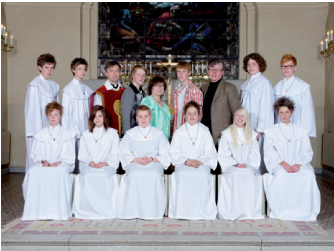
Konfirmation i Röke kyrka lördagen den 8 maj klockan 12.00.