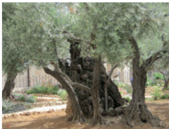
Gammalt olivträd i Getsemane trädgård.

En stark upplevelse var att komma till Olivberget. Vi startade vår vandring uppe på berget. Första stopp på vägen ner blev i Jesu tårars kyrka, Dominus Fleuit, som är en av de nyaste kyrkorna i Jerusalem färdigställd 1955. Enligt legenden var det här Jesus grät över Jerusalem. När man sitter i kyrkan har man ett vackert fönster framför sig och genom det kan man se ut över Jerusalem. Vi sjöng ”Bred dina vida vingar” som skrevs utifrån Jesu förbön över Jerusalem. Vår vandring fortsatte nerför berget på stenbelagda och ojämna vägar. När vi kom ner steg vi in i Getsemane trädgård. Den är inte stor, men man fick ändå känslan av hur det kunde ha varit när Jesus och lärjungar var här bland olivträden. Olivträden vi såg var inte från Jesu tid utan cirka 400 år gamla. Vi fick dock höra att ett olivträd aldrig dör helt, utan att det kommer nya skott från olivträdens rot. Det var tänkvärt tyckte jag.