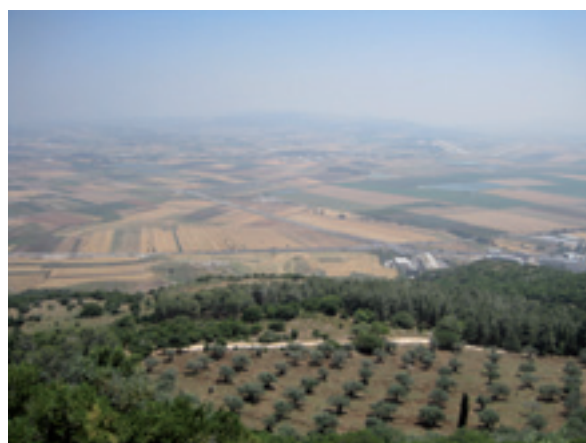
Utsikt från Karmelberget.

En dag vandrade vi uppe på Karmelberget där man har en otrolig utsikt över Israelslätten. Karmel betyder fruktträdgård och är Israels största nationalpark. Det var här Elia kämpade mot Baals-profeterna enligt bibeln. Vi firade mässa i stillheten under olivträden uppe på berget.