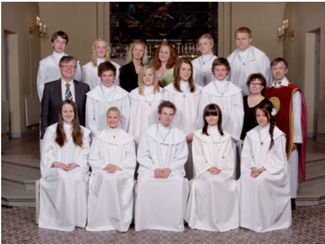
Konfirmation i Röke kyrka lördagen den 15 maj klockan 15.00.