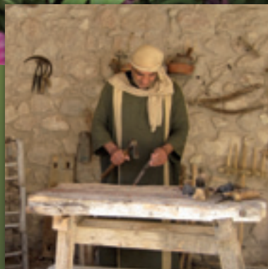
På vandring i Israel