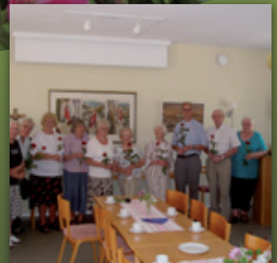
Vägkyrkorna, en viktig mötesplats