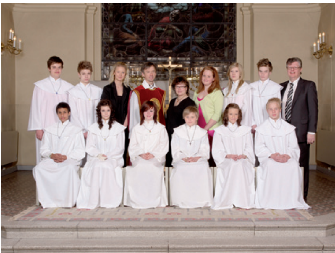
Konfirmation i Röke kyrka lördagen den 15 maj klockan 12.00.