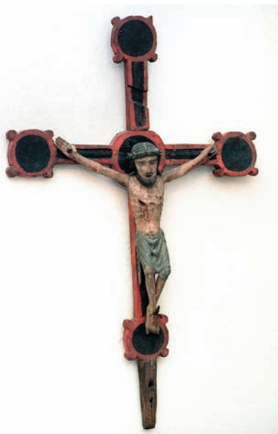
Processionskors från omkring 1340.