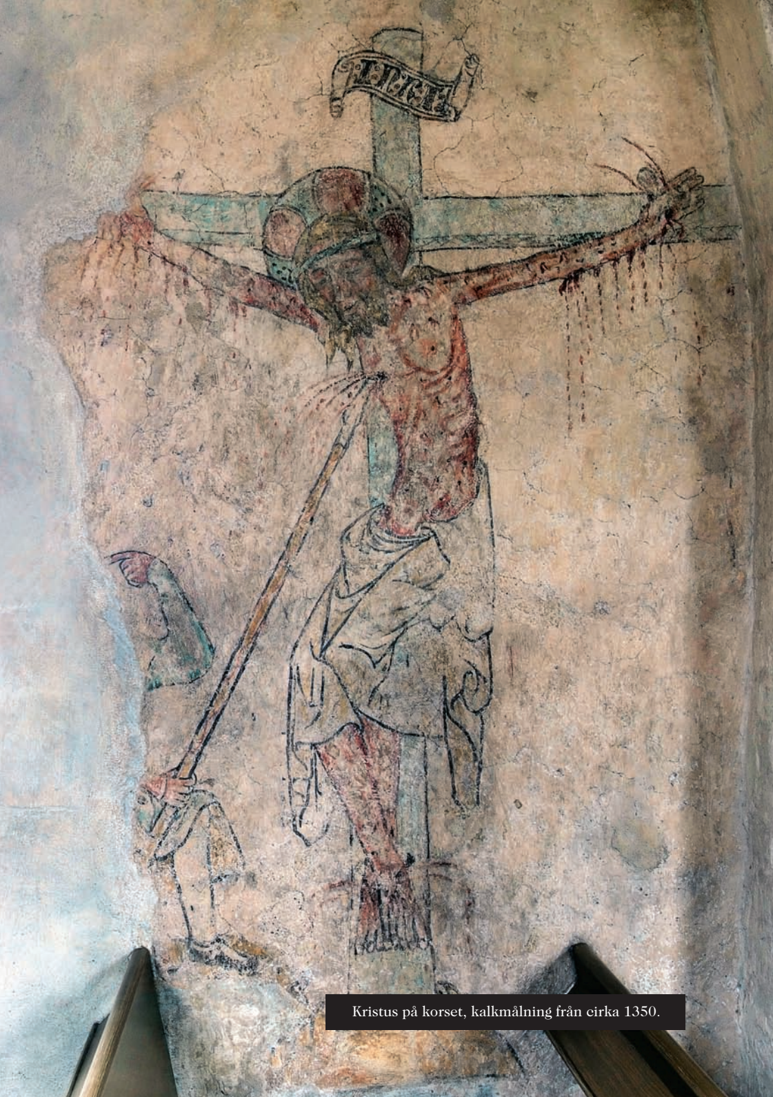
Kristus på korset, kalkmålning från cirka 1350.