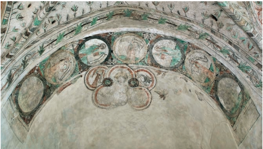
Kalkmålningar från 1505, i absiden Kristus som Världsdomare samt evangelisterna. I triumfbågen framställes kvinnliga helgon.