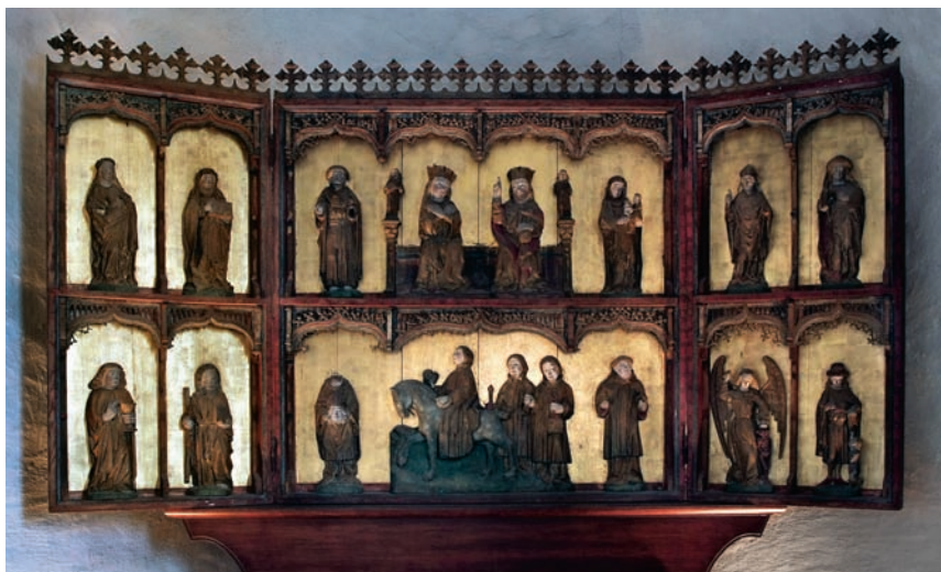
Altarskåp, nordtyskt arbete från omkring 1505.