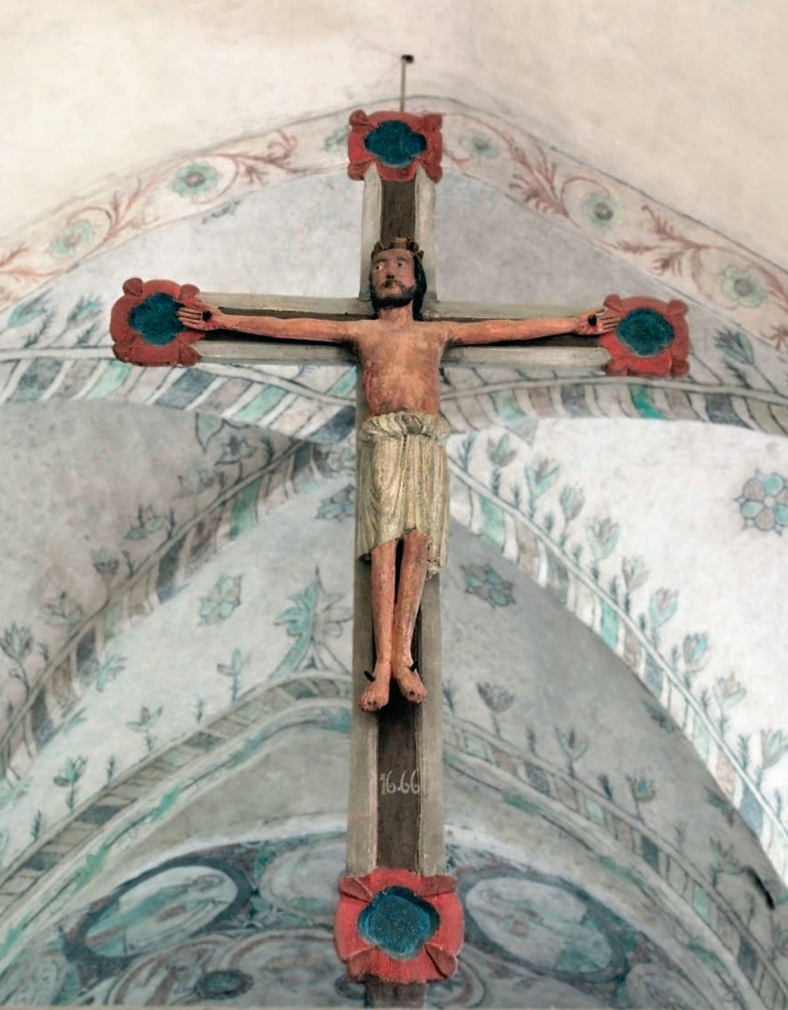
Triumfkrucefifix från 1100-talets senare del.