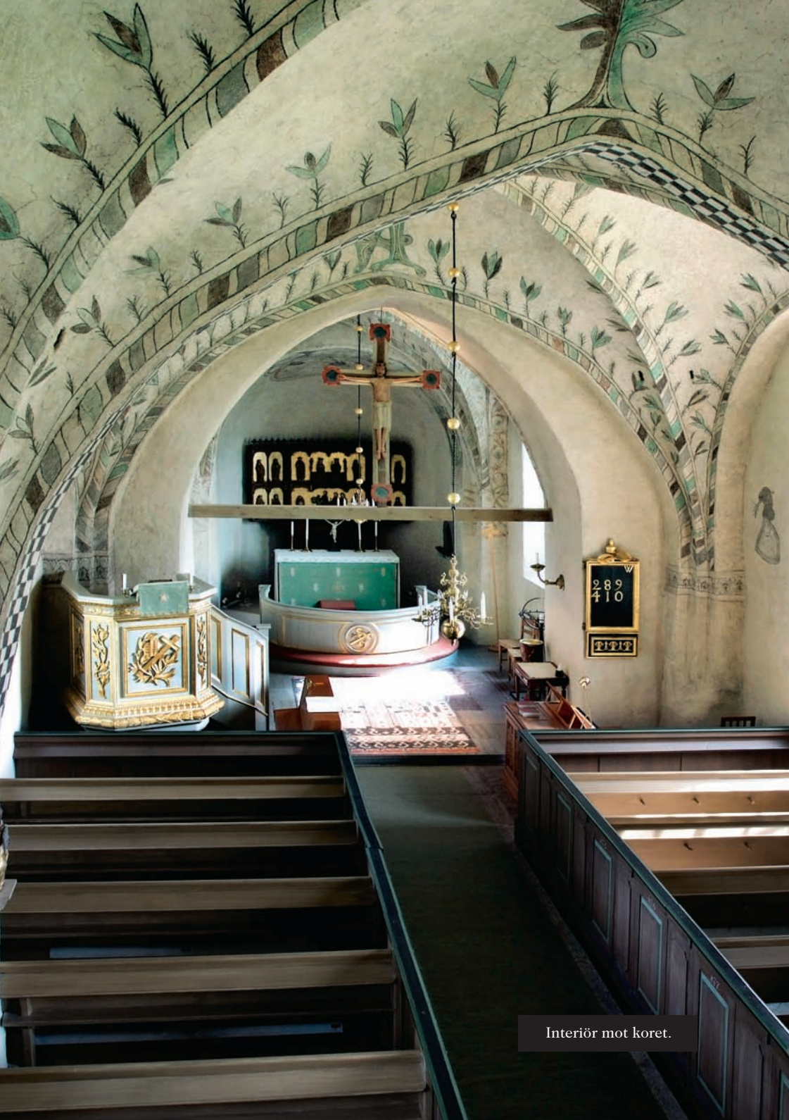
Interiör mot koret.