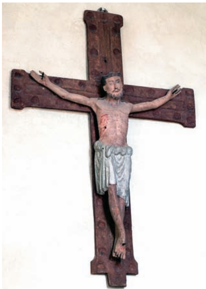
Triumfkrucifix från 1200-talets senare del.

Ett processionskrucifix med en smal Kristus nedhängande på korset är be-