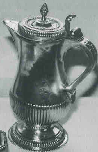
Kalk med fot och skaft från 1400-talet. Oblatask från 1706. Kanna omgjord 1723.

Brudkronan köptes 1679 av guldsmeden Valentin Wefwer men minskades 1750 av Nils Trybom.