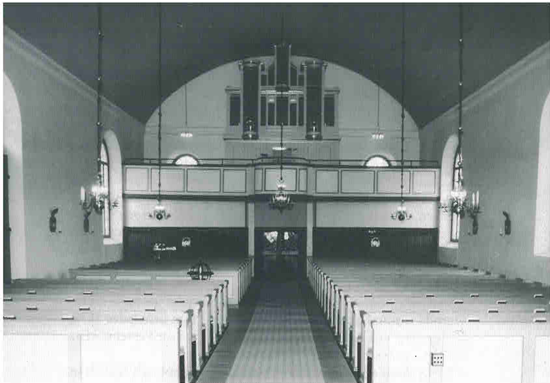
Interiör mot orgelläktaren.

har en storartad effekt i interiören, som domineras av detta konstverk.