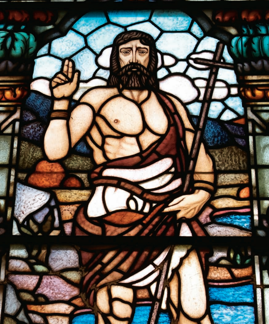
Glasmålning i korfönster med S. Johannes (detalj).