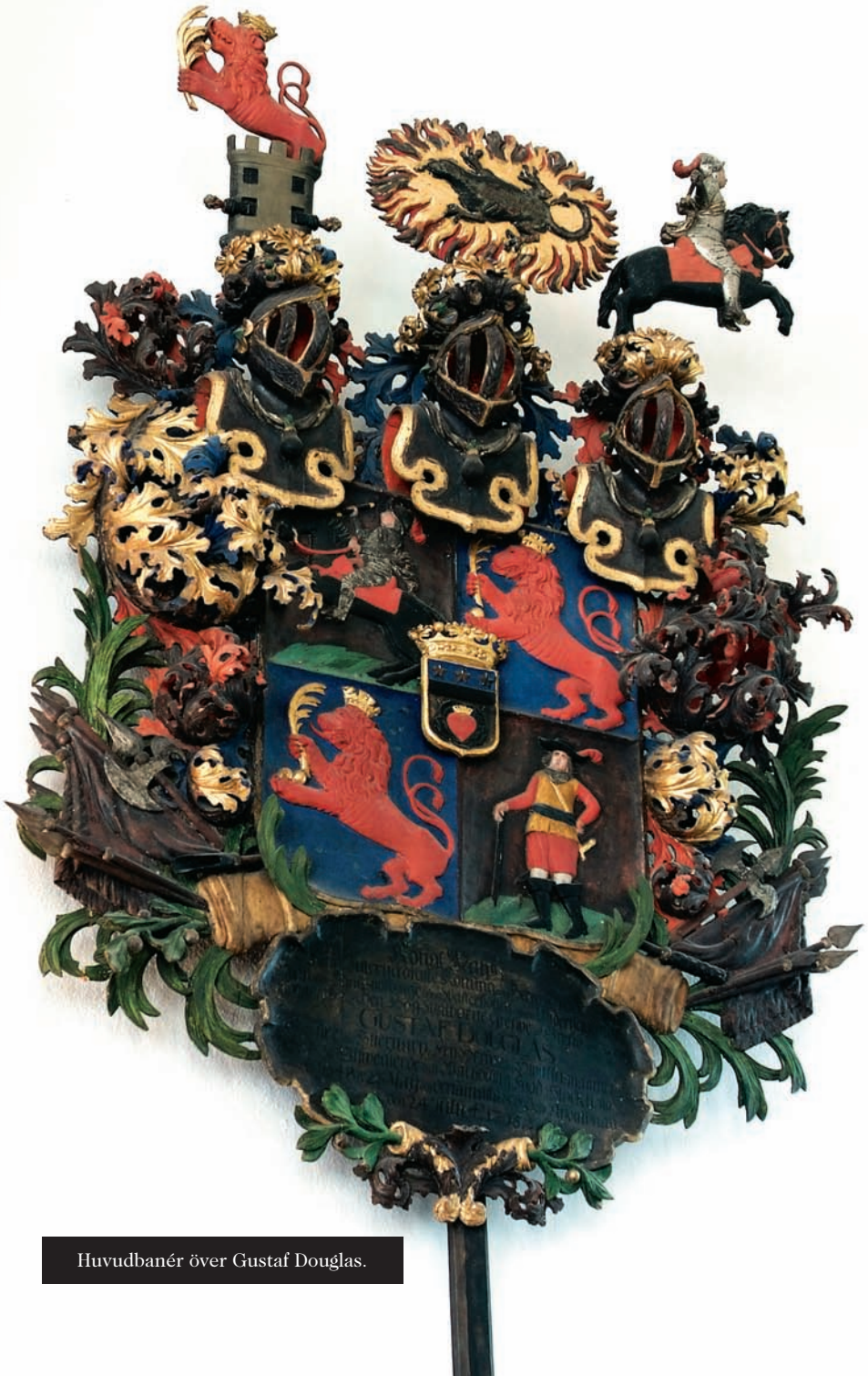
Huvudbanér över Gustaf Douglas.