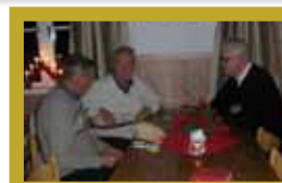
Ansvarig utgivare beklagar att dessa bilder föll bort ur förra numret.