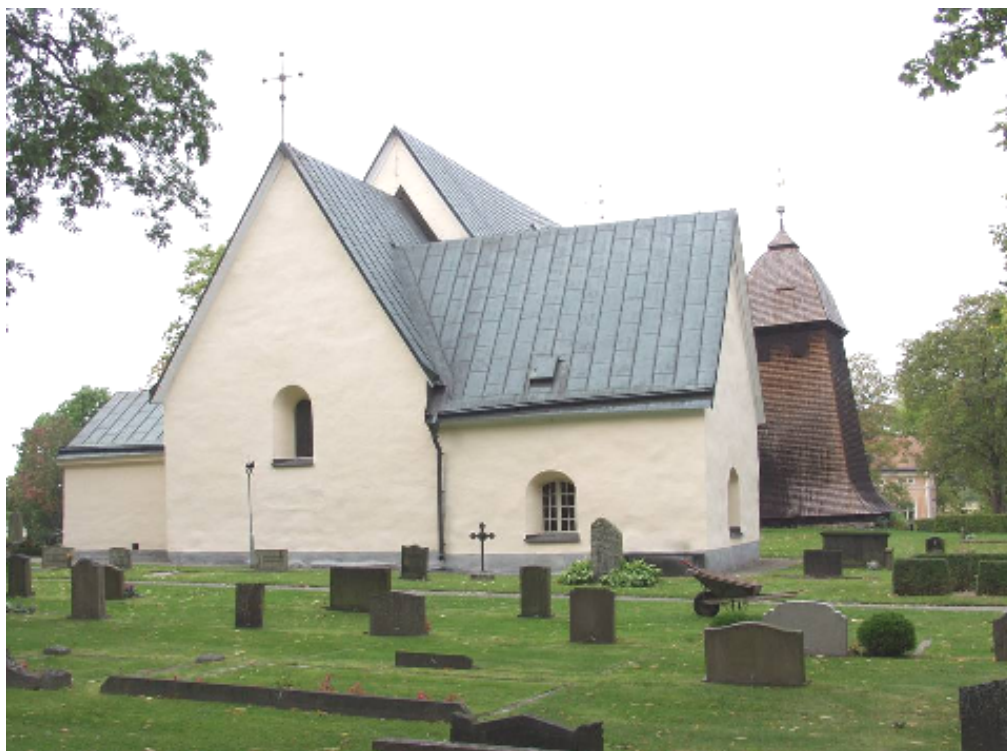
Gravkorets norra sida, korets östra gavel och sakristia; i bakgrunden ses klockstapeln som är klädd med spjälkade spån. Bortom denna skymtar det före detta skolhuset. Digitalfoto Rolf Hammarskiöld

Badelunda kyrka består av långhus med sakristia utbyggd mot norr, ett lägre, smalare kor i öster, gravkor och vapenhus mot söder. I långhusets östra, medeltida del är ytterväggarna murade av natursten, liksom i sakristian, vapenhuset och korets nedre del, medan långhusets västra del, korets övre del och gravkoret är tegelmurat. Fasaderna är slätputsade, sockeln avfärgad grå och väggarna i lätt gråaktig gul nyans, på västra gaveln artikulerade blinderingar. På långsidorna förekommer synliga dragjärn av 1700-talstyp. Yttertaken sluttar brant och är belagda med koppar som ärgat. De rundbågiga fönsteröppningarna har gråmålade snickerier från 1959 och blyinfattat nyantikglas, fränsett korgavelns fönster som har glasmålning.