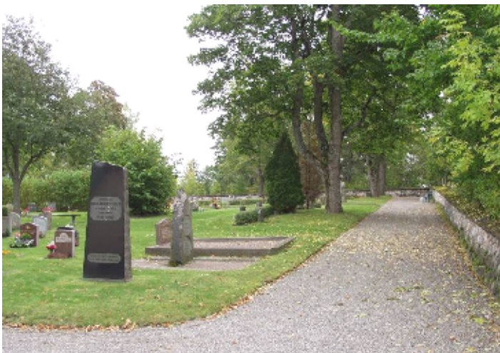
Kyrkogårdens östra sida

Gravvårdsområdet är till största delen gräsbevuxet. På östra sidan utbreder sig fyra tydligt åtskilda kvarter.