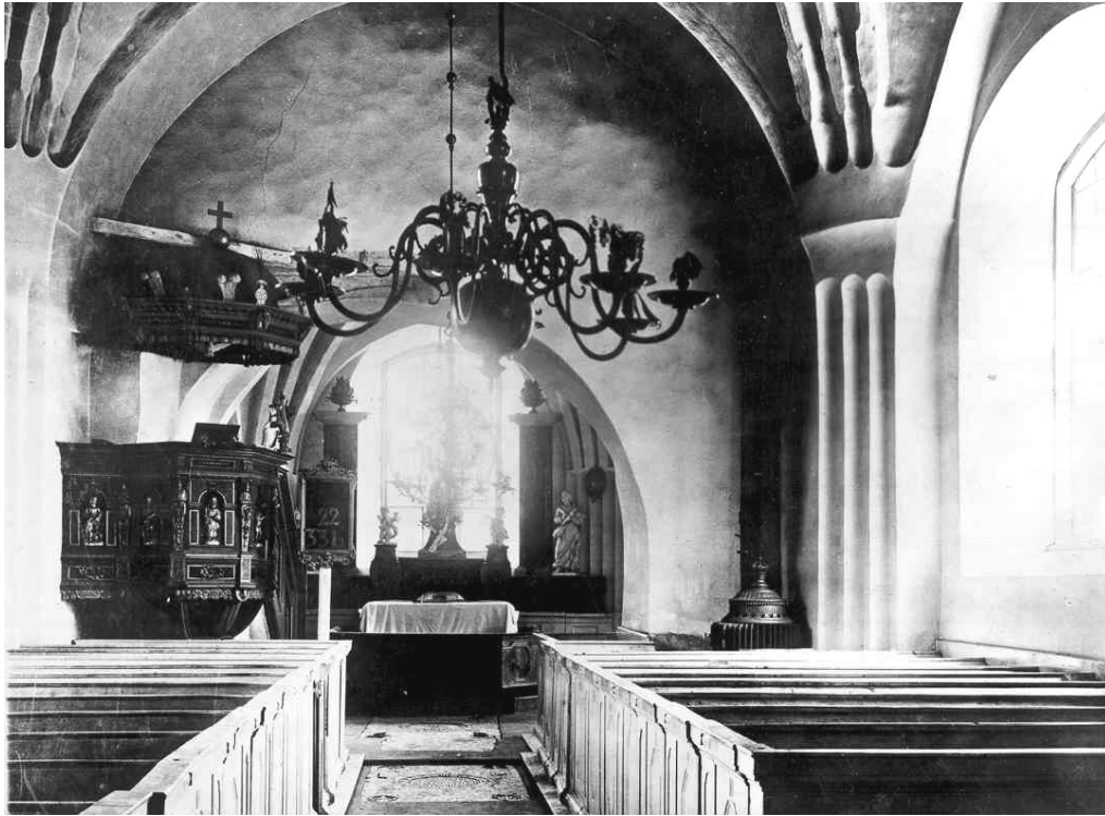
Före 1892 bestod kyrkans golv av tegel och stora gravhällar. Bänkinredningen var sluten, antagligen insatt på 1700-talet. Valv och väggar hade ojämnare putsytor än idag. Digital kopia av äldre foto i kyrkans sakristia

Vid stor ombyggnad 1892, efter arkitekt C G Ekholms handlingar, utbyggdes kyrkan till nuvarande volym genom att korets valv och yttertak höjdes. Fönsteröppningarna förstörades och fick bågar av svartmålat järn med färgade rutor. Yttertaketets spåntäckning ersattes med korrugerad plåt. Vid samtidig inre omgestaltning borttogs tegelgolv och gravhällar och istället lades svart-vitt klinkergolv. Öppen bänkinredning byggdes och fick ådring som imiterade ek - närmast ett standardutförande vid denna tid. De förut vitlimmade valven och väggarna fick en livligare färgsättning, där bland annat rosa ingick.