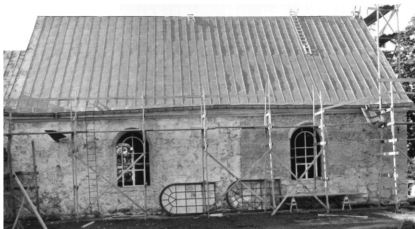
Norrsidans blottlagda murverk år 1959; Till vänster ses medeltida gråstensmur och till höger murverk från 1658-59 av övervägande tegel. De uppställda fönstren i förgrunden var från 1892 och skulle bytas ut

Tre år senare -1959- omgestaltades kyrkan både in- och utvändigt efter handlingar upprättade av arkitekterna Ärland Norén och Per Bohlin. Fasadputsen nedknackades så att de yttre murverken för en tid var helt blottlagda och kunde dokumenteras. Nyputsning skedde med cementstarkt bruk, med en hållfasthet motsvarande betong. Till en början var tanken att avfärgning skulle ske i en rosaröd nyans, som identifierats vid föregående putsknackning, men efter lokala protester valdes istället en gråvit KC-färg. Fönsteröppningarna krymptes och fick gråmålade snickerier med blyinfattade rutor av nyantikglas.