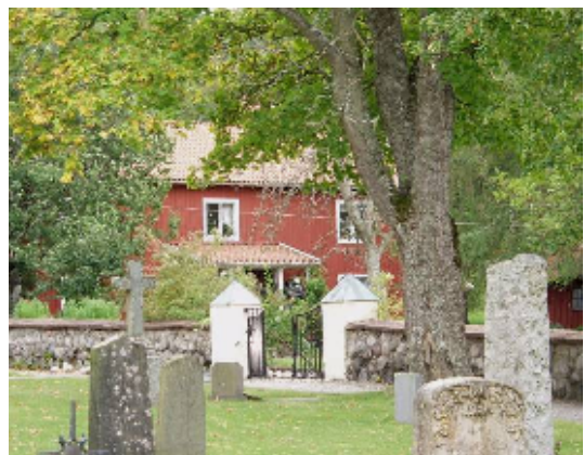
Den tidigare prästgården ligger i nära anslutning på kyrkogårdens södra sida.

Landsbygden runt sockenkyrkan domineras av den nord - sydgående Badelundaåsen, som alltsedan förhistorisk tid tjänat som kommunikationsled och erbjudit bra mark för tidig bosättning. Fornlämningsförekomsten, odlingslandskapet och äldre vägsystem är främsta motiv till att området klassats som riksintresse för kulturmiljövården. Av den historiska kyrkbyns bebyggelse återstår den f d prästgården direkt söder om kyrkan, f d skolhus på andra sidan om förbipasserande väg, samt en likvagnsbod som omvandlats till maskin- och redskapsförråd. Fram till 1972 fanns även en långa kyrkstallar.