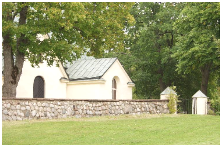
Södra kyrkogårdsmuren med grind

Kyrkogården är utsträckt i öst-västlig riktning på en plåtå, på en avsats av Badelundaåsen. Den omgärdas av en 1940-talsmur, bestående av specialsorterade runda stenar förankrade i betong, samt krön av Ölandskalksten. På norrsidan finns ett längre avsnitt svart gjutjärnstaket från 1890-talet. Öppningarna i väster, söder och norr består av putsade grindstolpar med toppiga, kopparklädda tak och svarta järngrindar.