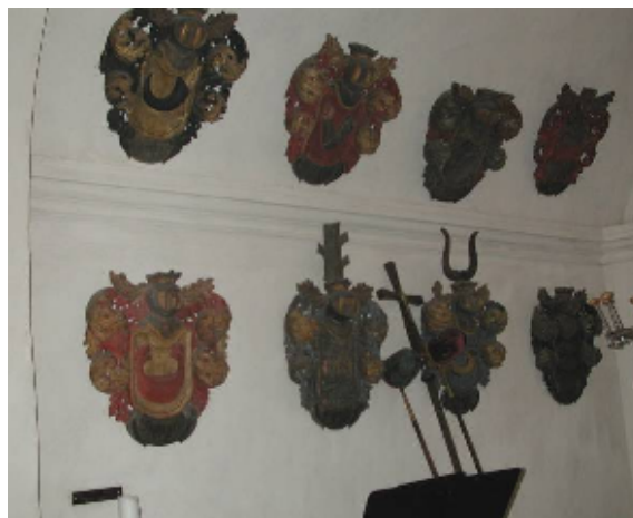
Epitafier i Horn - Wittenbergska gravkoret