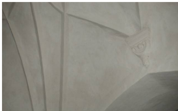
Laverade putsytor i kyrkorummet 2003

Vid yttre renovering 1998 avfärgades fasaderna med KC-färg i en gulaktigare nyans än förut och fönstersnickerierna målades mer distinkt grå. Samtidigt försågs kyrkorummet med nya radiatorer och intermitterent uppvärmning infördes. År 2003 genomfördes inre renovering, då valv och väggar rengjordes, retuscherades och fixerades med kalkvatten. Bänkinredningen ommålades med linoljefärg i samma nyans som förut.