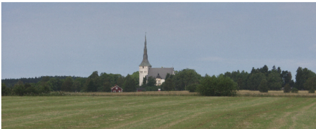
Romfartuna kyrka 2004-08-12

Romfartuna socken består av lätt kuperad slättbygd, dominerad av större gårdar samlade i byar. I nordsydlig riktning går Badelundaåsen som sedan medeltiden varit en av landskapets viktigaste vägar. Området tycks ha varit bebyggt redan på stenåldern. Överhuvudtaget är socknen rik på fornlämningar, mest från järnåldern.