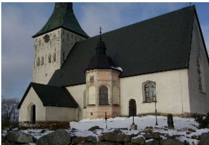
Kyrkans södra sida

Kyrkan är grundlagd på en berghäll, som sluttar brant mot väster. Långhuset har höga murar, ett högrest, skiffertäckt sadeltak och västtorn med kopparklädd spets. Mot nordost finns en sakristia och mot söder vapenhus och gravkor. Ytterväggarna består av natursten i de nedre, medeltida delarna, medan tegel överväger i de övre som tillkommit på 1600-talet och senare, liksom i gravkoret. Sockeln är oputsad, fasaderna i övrigt spritputsade och kalkavfärgade i gulaktigt vit nyans. Gravkoret avviker med slätputsade väggfält och putsrustik, samt avfärgning i terranyans. Fönsteröppningarnas form och storlek varierar; mot norr och väster är de rundbågiga, mot söder är en korgbågig och en draperibågig. Fönstersnickerierna är brunmålade, spröjsade i mellanstora rutor av munblåst, klart glas. Inträde sker genom vapenhuset, vars rundbågiga portal har omfattning i flera språng och furuport med rikt ornerat medeltida järnsmide. På långhusets södra sida, öster om gravkoret, finns en mindre järnport, klädd med skivplåtar och prydd med krucifix och vapensköldar.