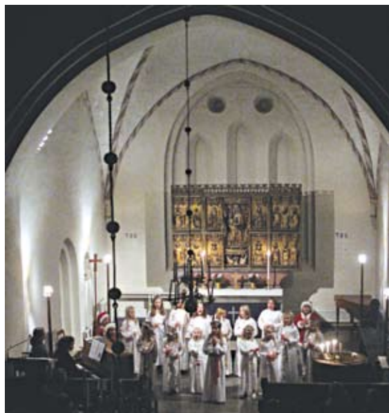
Luciagudstjänsten i Lena kyrka 2009.