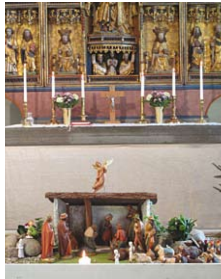
Julkрубban i Lena kyrka

Missa inte utställningen om vänförsamlingsarbetet och Highfields församling i Harare. Finns att se i kyrkan hela hösten!