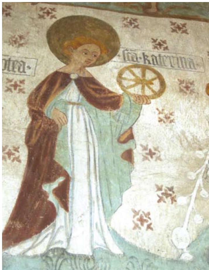
Katarina av Alexandria, avbildad i Tensta kyrka.