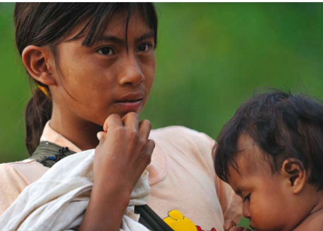
Ung kvinna med barn i Colombia.

Den första advent börjar som vanligt Svenska kyrkans internationella arbetes årliga julkampanj. Temat i år och ytterligare två år framåt är barn i krig och konflikt, runt om i världen. Detta under rubriken "GE ALLA BARN en framtid utan våld." Under kampanjen kommer exempel på arbete i Colombia och Sydsudan särskilt lyftas fram.