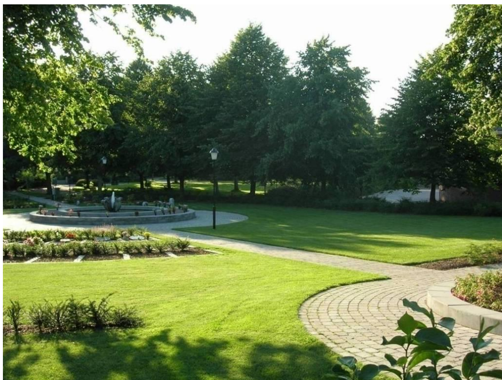
I en del av den "gröna kyrkogården" togs den Nya minneslunden i bruk 2004.