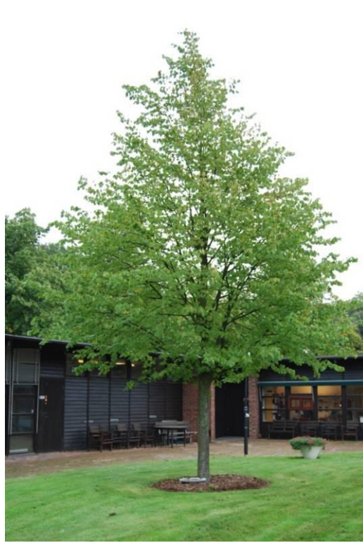
Nyplanterat träd våren 2008.