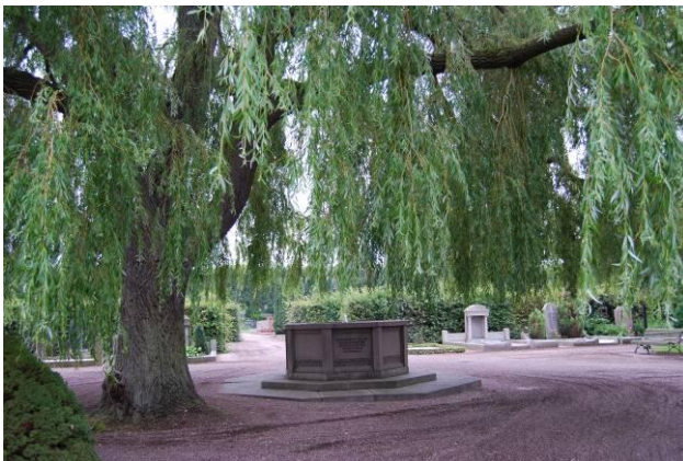
Kaskadpilen med granitbrunn på Centralplatsen.

Ett annat huvudelement som Ekelund tillförde är Centralplatsen med sin ursprungliga kaskadpil och granitbrunn. Här var det från början planterat fyra blågranar i gräsmattorna, som byttes ut under 1980-talet. Platsen har genomgått en del förändringar under åren, bland annat har några monument efter förlista sjömän under 2:a världskriget tillförts platsen i slutet av 1940-talet.