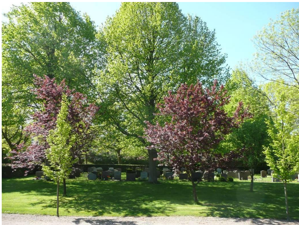
Kvarter 55 från norr, med träd från både 1950-talet och 2000-talet.

Området skiljer sig från den övriga kyrkogården genom att det inte finns speciellt många barrträd i den här delen av kyrkogården.