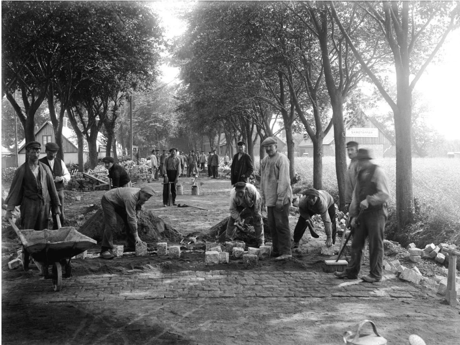
Stensättning på Hälsingborgsvägen 1920-tal, foto från norr. Ladorna och byggnaderna till höger i bilden var en del av gården Fridhem som låg på nuvarande kyrkogården.

Den sista större utvidgningen skedde 1980 i de norra delarna. Här förbereddes kvarter för jordbegravning som inte behövde utnyttjas i så stor utsträckning. När det slöts avtal 1999 mellan Landskrona Församling och Lunds stift/Länsstyrelsen om en muslimsk del på kyrkogården kom denna mark till användning.