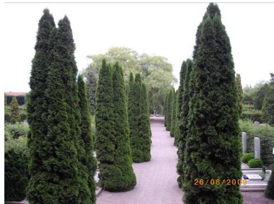
Tujaallén som sammanbinder Gamla Minneslunden med Centralplatsen.

Kaskadpilen är en representant för alla de träd med hängande växtsätt, så kallade sorgträd, som planterades på kyrkogårdar från mitten av och i slutet av 1800-talet. De har försvunnit många vackra hängalmar och paraplyalmar på Landskrona Kyrkogård omkring sekelskiftet 2000, på grund av almsjukan och vi riskerar idag att även bli av med några 100-åriga hängaskar på grund av askskottsjuka.