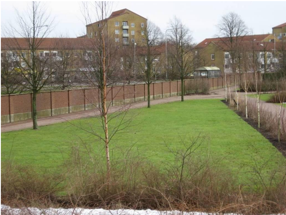
En del av gården Fridhems tidigare ägor. Flyttning av 20-åriga parklindor gjordes här 2007, för att få större gräsytor för jordbegravning.