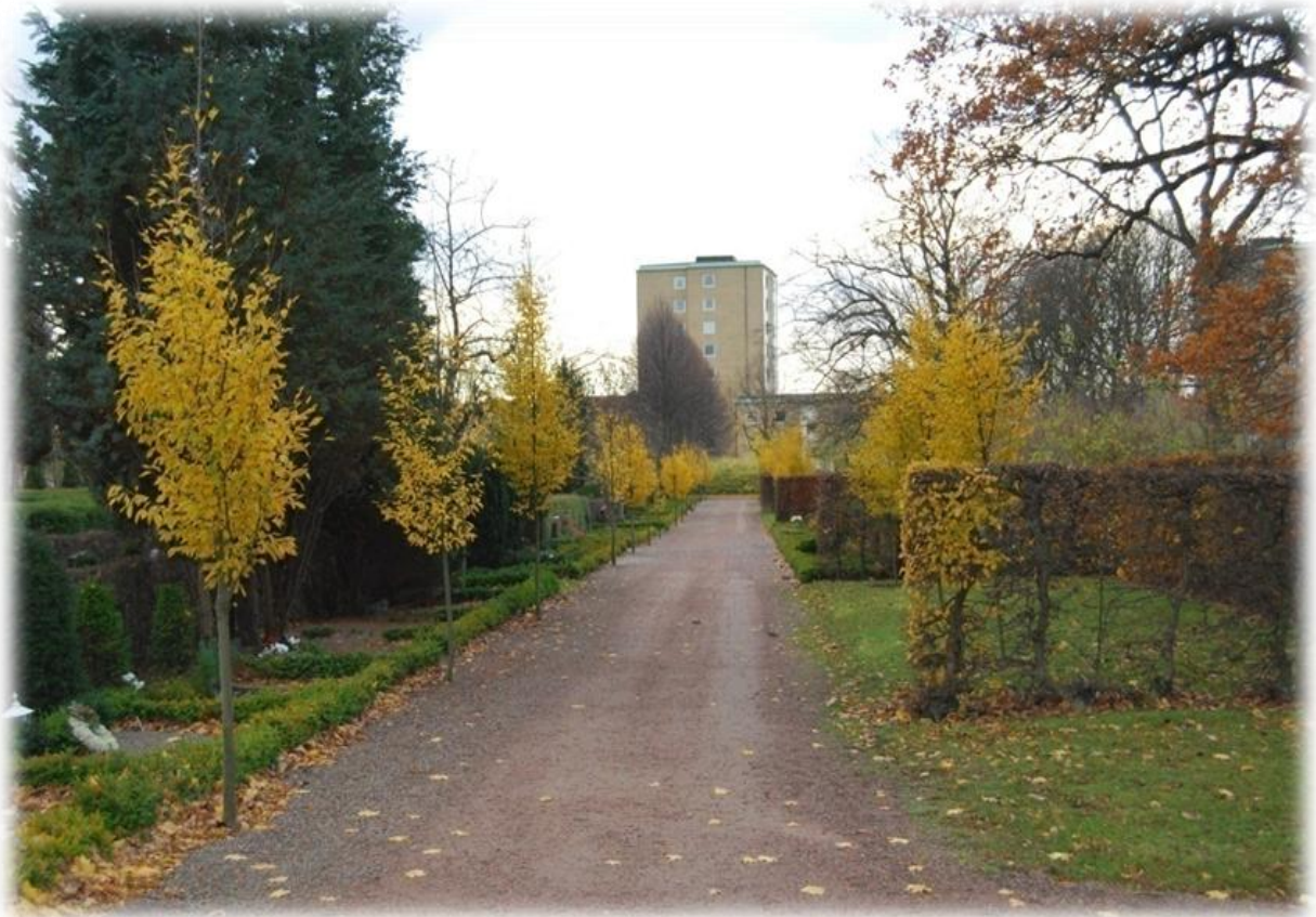
”Kolonigången” med pelaravenbok.

Den ”gröna kyrkogården” som togs i bruk i början av 1960-talet efter det att kyrka, kapell och krematorium byggts, ritades av professor Per Friberg. I denna södra del av kyrkogården, som hade inlemmats i området redan 1922, fanns det länge koloniträdgårdar.