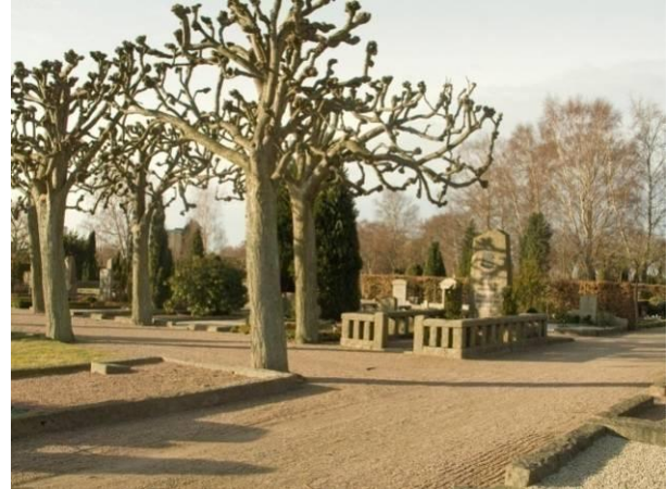
De två sista träden och Thulins grav 2009.

Vid den stora utvidgningen av kyrkogården 1922 som ritades av stadsarkitekten Frans Ekelund, tillkom ytterligare en huvudaxel. Ekelund hade tänkt sig en entré ifrån sydväst där du först kom till en monumentplats och sedan till den pampiga huvudaxeln, planterad med cypress och poppel.