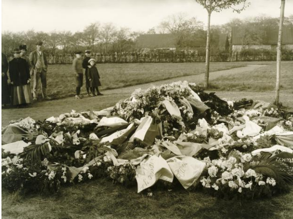
De två sista träden efter Enoch Thulins begravning 1919.