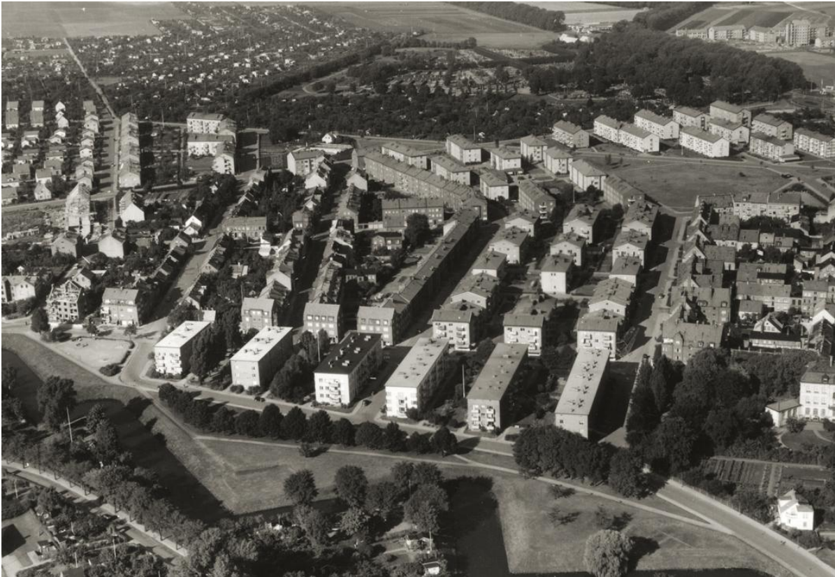
Västra Landskrona i början av 1950-talet med kyrkogården i övre delen.

Karakteristiskt för kyrkogården är de många barrväxter som finns planterade, varav många har nått trädform. Det finns vackra cypresser, idegranar och tujor av en mängd olika arter och sorter. Det som också utmärker kyrkogården är de vackra lindarkaderna.