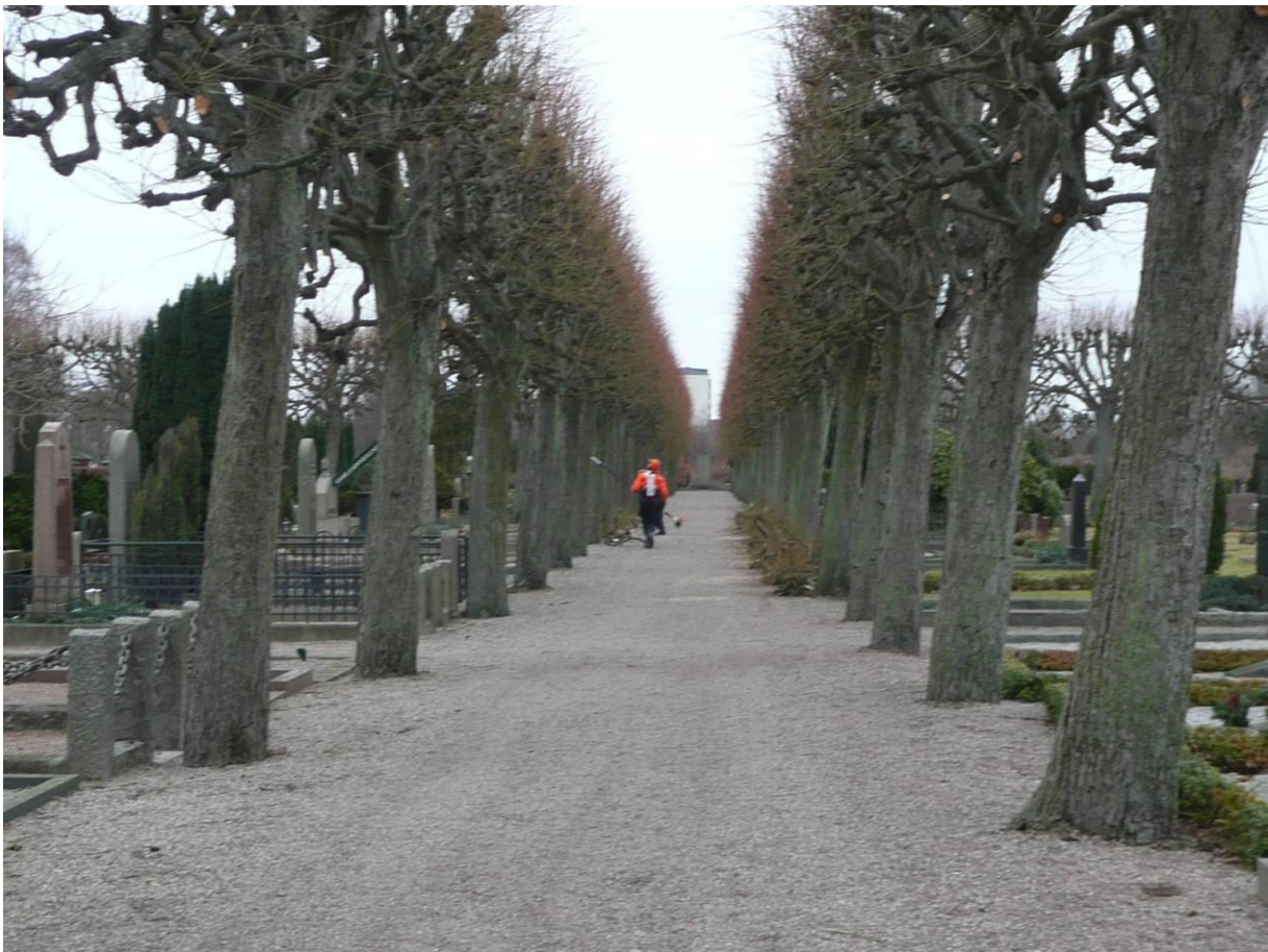
Huvudgången med glanslind efter höjningen 2009.

Hans gravplats ligger intill lindarkaden, i kvarter 43. Lindarkaden klipptes in till arkadform av anläggningsträdgårdsmästare Carl Gustav Lenwall under Grahnbergs sista år som stads-trädgårdsmästare.