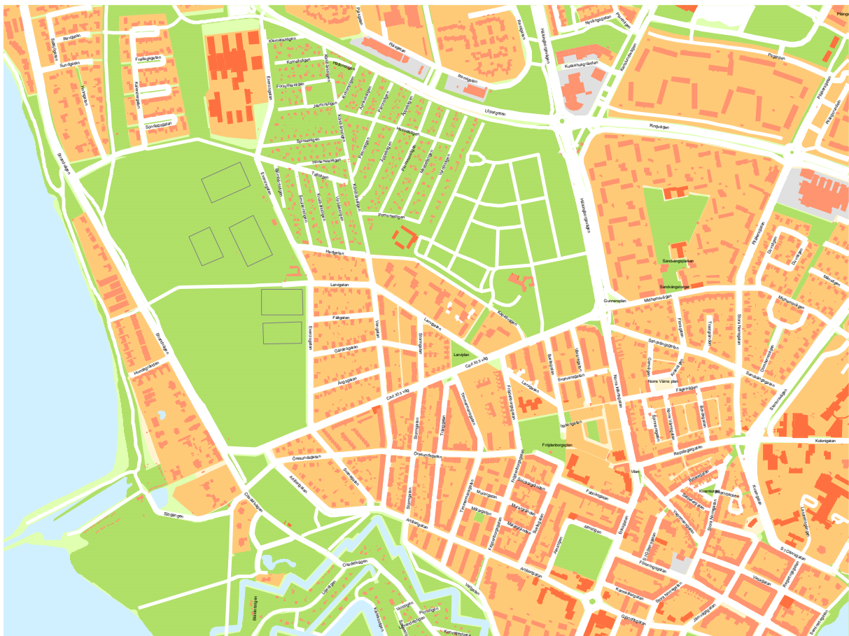
Kartbild över västra Landskrona. Landskrona GIS-Portal, Landskrona Stad.

I den urbana miljön finns olika typer av trädmiljöer representerade. Särskilt skyddsvärda träd påträffas framförallt i parker och på kyrkogårdar. Det finns cirka 3 000 kyrkogårdar i landet varav ca 2 500 landsortskyrkogårdar och många har höga naturvärden.