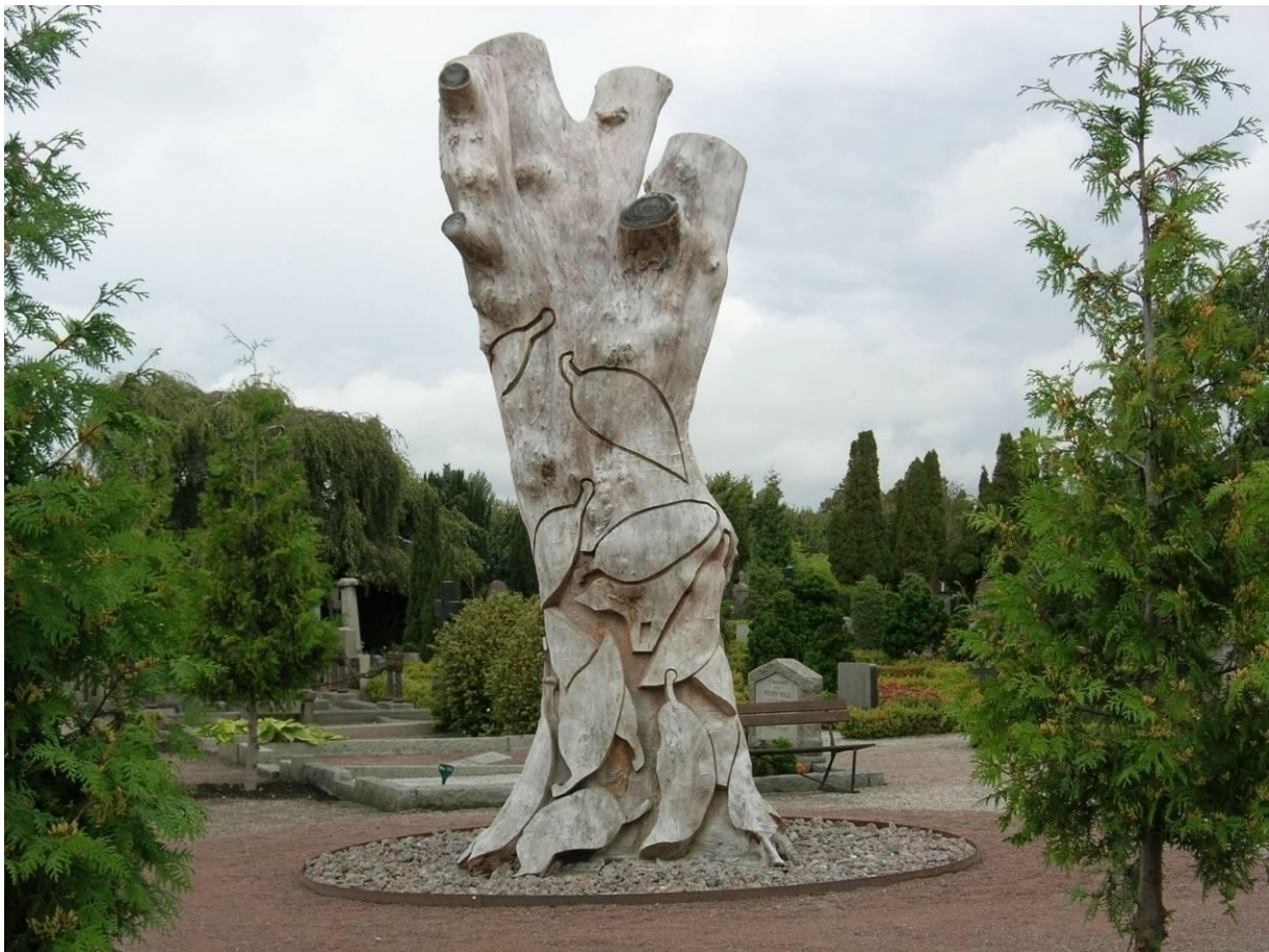
Den konstnärligt utformade stubben av den sista skogsalmen på kyrkogården.

De cirka 50 skogalmarna och ett hundratal andra vackra typer av alm som hängalmar, paraplyalmar, pyramidalmar och hörsholmsalmar föll offer för almsjukan och togs successivt bort mellan åren 1990-2005. När den sista stora skogsalmen i korsgången dog, bevarades en 5 meter hög stubbe, som konstnären Mikael Liljeqvist har utformat till en vacker skulptur.