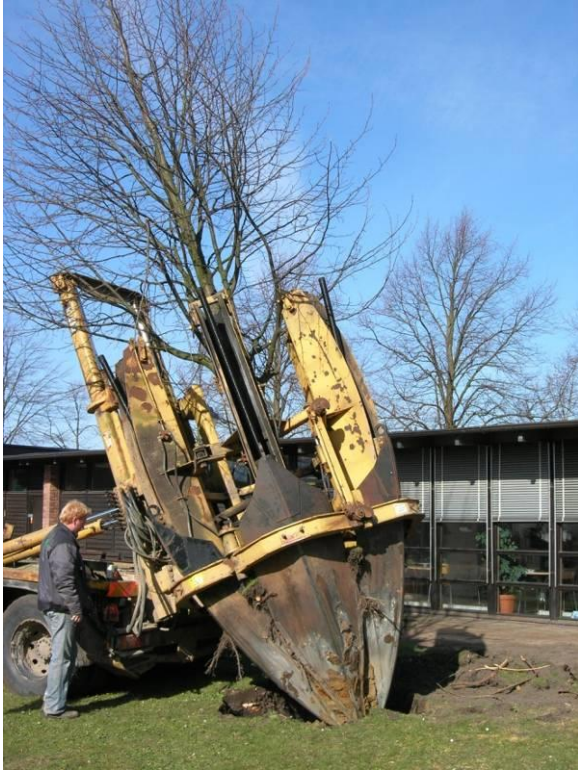
Flyttning av träd med spadmaskin 2007